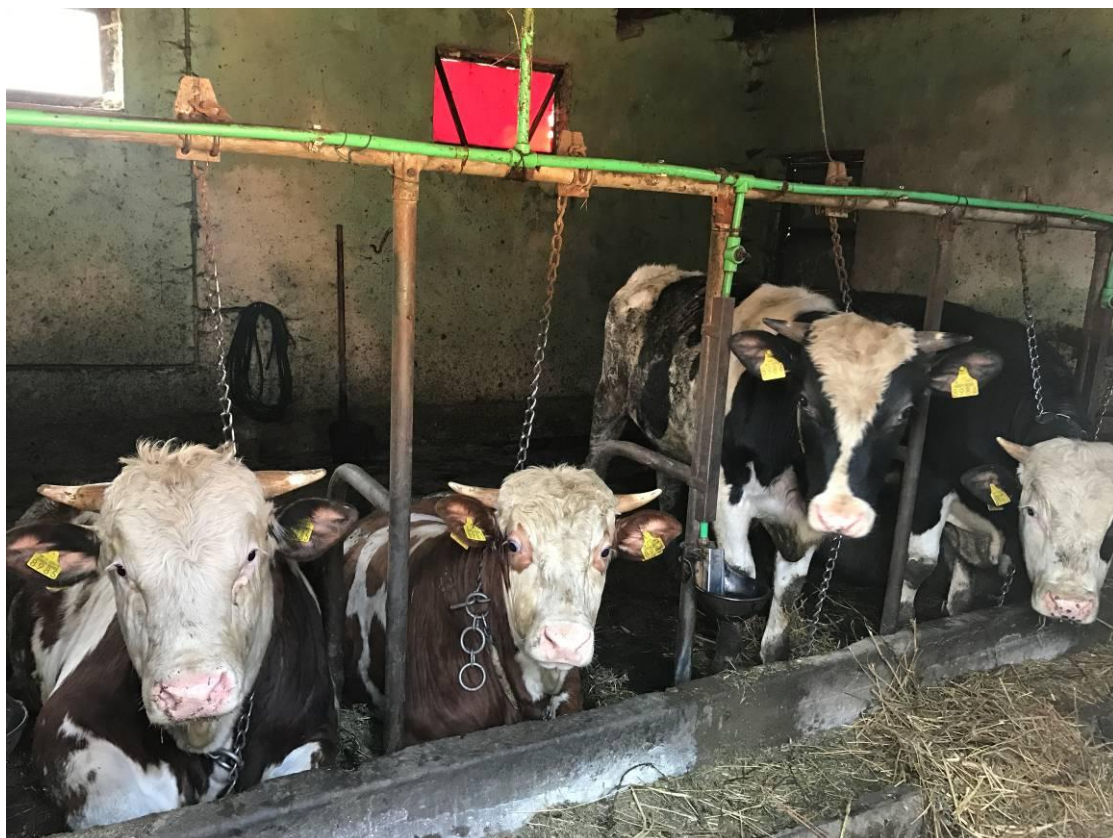
Slika 7. Junad koja su trenutno u staji

4.5. Kretanje broja grla i prosječne tjelesne mase na istraživanom OPG-u tijekom 2015. i 2016. god.