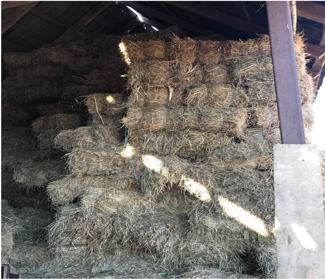
Slika 5. Balirano i uskladišteno sijeno (foto: V. Strepački, 2016.g.)