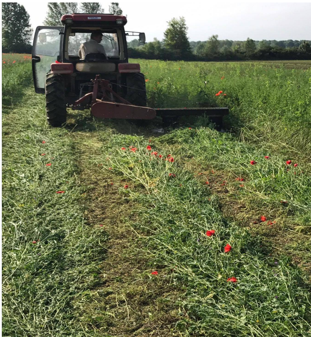
Slika 4. Košnja lucerne

Lucerna u 2016.godini je bila na 1,6 ha. Prosječan prinos lucerne je bio 12 t/ha.