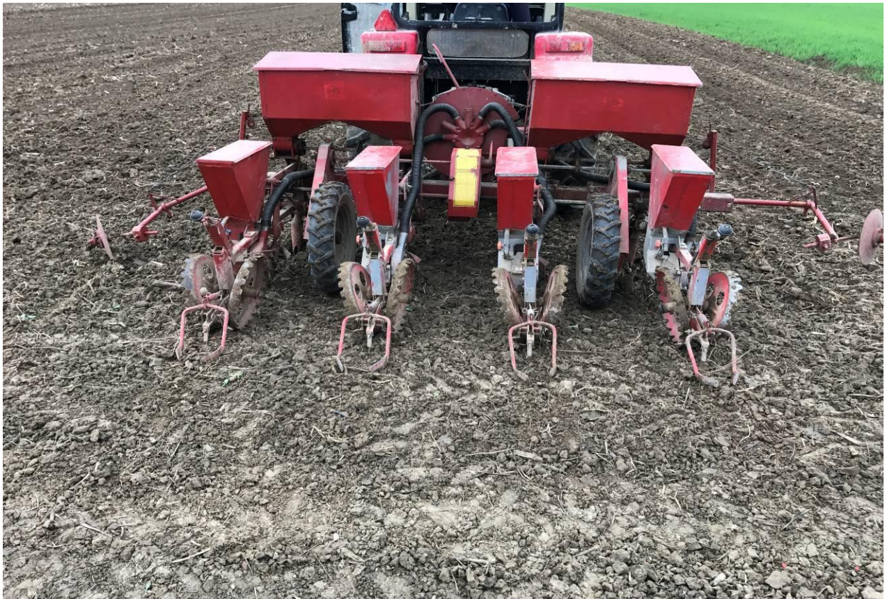
Slika 1. Sjetva kukuruza na OPG-u (foto: V. Strepački, 2017.g.)