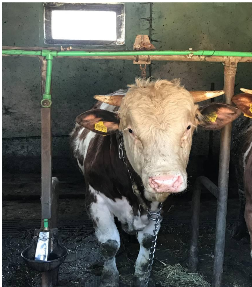
Slika 6. Smješaj u staji

Dok su u staji bila junad pred prodaju (što su bili kupljeni početkom 2015. god.), kupljeno je još novih 5 teladi. Svih 5 teladi je kupljeno zajedno, sredinom veljače 2016. god. Telad su bila stara od 2 – 2,5 mj., 3 teleta su pripadala simentalskoj pasmini, a 2 holštajn-friziskoj pasmini goveda (prodavač je htio prodati samo ako se svih 5 kupi, pa zbog toga nisu samo simentalci kupljeni). Trenutno se nalaze u staji (početak ožujka 2017.god.), planira ih se prodati kroz 2 – 3 mj., ovisno o tome hoće li se moći svi zajedno prodati ili će jedan po jedan (Slika 7.).