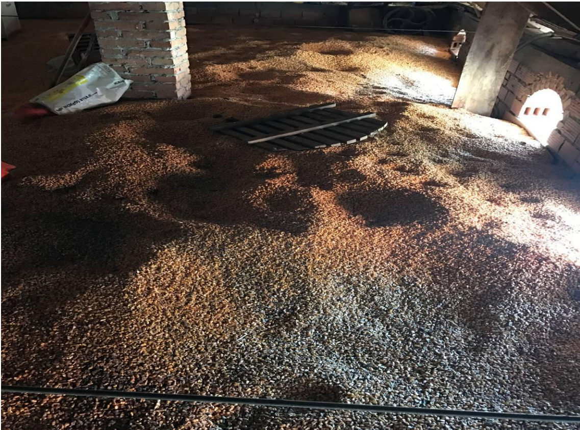
Slika 3. Skladištenje zrna kukuruza