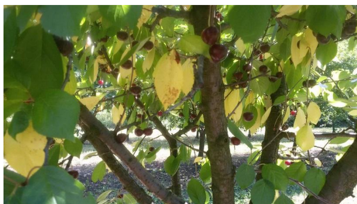
Slika 16. Kozičavost lista višnje