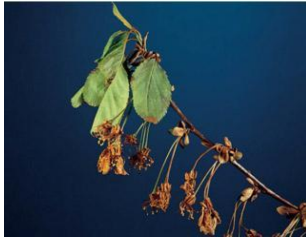
Slika 1. Palež cvijeta i mladice višnje

Sušenje mladica u cvatnji očituje se kroz naglo posmeđenje, sušenje i propadanje tek procvalih cvjetova (Slika 1.). Mladica se osuši, a broj osušenih mladica može biti velik i na njima nema plodova. Simptomi infekcije mogu biti vidljivi i na plodovima (Slika 2). Gljiva parazitira sve koštičavo voće i u našem uzgojnom području javlja se svake godine u slabijem ili jačem intenzitetu (Ivić i Novak, 2012.).