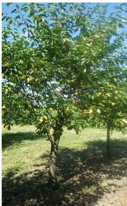
Slika 15. Stablo zaraženo Blumeriom japii

U 2017. godini početkom lipnja pojavila se kozičavost lista u vrlo slabom intenzitetu (5%), a ostale bolesti tijekom vegetacije nisu utvrđene (Slika 15. i 16.). Provodila se preventivna zaštita višnje s 13 tretiranja (Tablica 2.). Broj tretiranja voćaka ovisi o vremenskim uvjetima, prisustvu patogena, razvojnoj fazi i osjetljivosti voćaka.