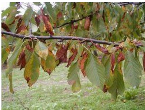
Slika 10. Uvijenost i sušenje lišća višnje

Jači napad ove gljive u Hrvatskoj utvrđen je 2011. godine na području Ravnih Kotara, Šestanovca i Cista Prova (Ražov i sur., 2012.).