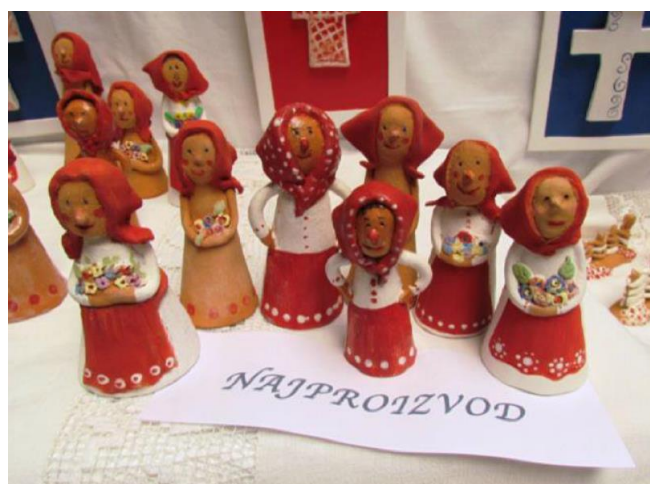
Slika 6. Snašice, UZ Tkanica, OŠ Milan Amruš, Slavonski Brod