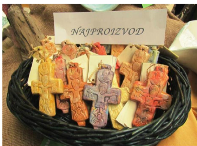
Slika 7. Čikin križić, UZ Mocire, OŠ Voštarnica, Zadar