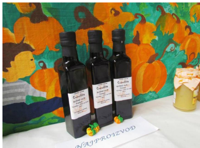
Slika 5. Bučino ulje, UZ Cucurbita, OŠ Dragutin. Lerman, Brestovac