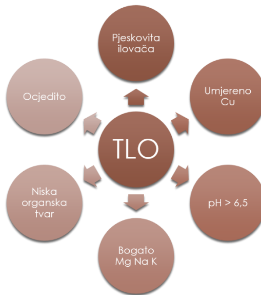
Slika 10. Zahtjevi smilja s obzirom na sastav tla

Smilje je trajnica i uzgoj na jednoj površini traje 5-8 godina te je preporučljivo planirati nasade smilja na površinama na kojima su ranije uzgajane kulture nakon kojih nije jaka zakorovljenost. Takve su kulture strne žitarice, leguminoze i okopavine.