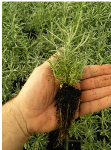
Slika 8. Presadnice smilja (Foto original).

Moguće je presadnice smilja proizvoditi i sjetvom direktno u kontejnere čime se olakšava daljnja manipulacija njima i smanjuje utrošak vremena. Ovako uzgojene presadnice ne presađuju se dodatno jer se radi o uzgoju jedne ili dvije biljke po kontejneru nego se one direktno iz kontejnera sade u nasade (Slika 8). Presadnica smilja spremna je za 90 dana za daljnu sadnju na poljoprivrednim površinama kod uzgoja iz sjemena (Slika 9).