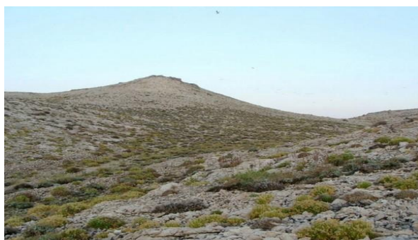
Slika 4. Samoniklo smilje.

Obzirom na prepoznata brojna pozitivna svojstva biljke, smilje se od davnina prikuplja (Stanković i su., 2001.). S porastom komercijalnih potreba za ovom biljkom sve je više sakupljača te se Zakonom o zaštiti prirode propisalo uvjete sakupljanja smilja kako bi se vrsta očuvala. Ovim zakonom vremenski je ograničen period u kojem se smilje smije prikupljati. Temeljem mišljenja Državnog zavoda za zaštitu prirode sakupljanje smilja na području Dubrovačko neretvanske županije, otocima Splitsko-dalmatinske, Šibensko-kninske i Zadarske županije te na području otoka Paga odobreno je od 1. lipnja do 1. kolovoza, a na ostalim područjima od 15. lipnja do 15. kolovoza (Mucalo, 2015.).