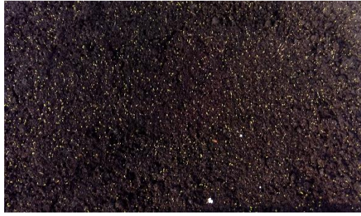
Slika 7. Klijanci smilja (Foto original).

Važno je kod proizvodnje presadnica imati na umu da je za proizvodnju 1 ha nasada smilja potrebno oko 60 g sjemena (sjetva na oko 10 m 2 hladnog klijališta).