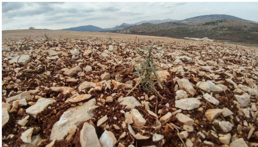
Slika 1. Smilje na kamenitom tlu.

Pripadnike ove porodice nalazimo na iznimno oskudnim staništima (pješčane dine, klifovi i kamenjari) pretežno umjerenog i suptropskog pojasa.