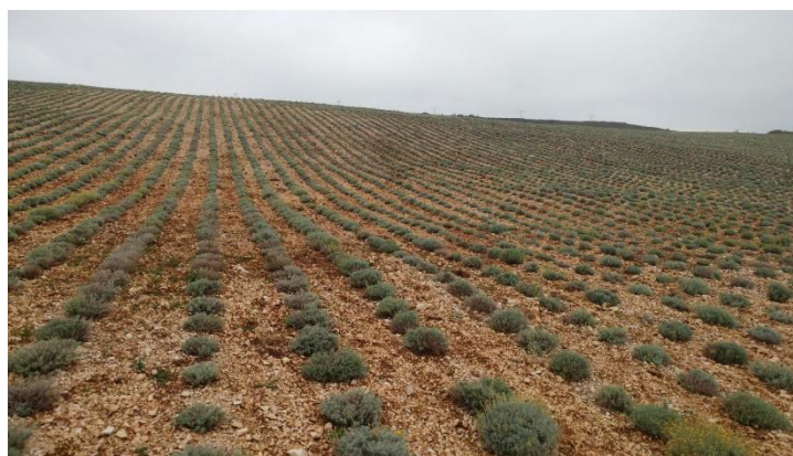
Slika 5. Nasad smilja.

Danas se nastoji ublažiti potreba za branjem samoniklog smilja intenzivnim uzgojem (Slika 5). Naime, tržišni trendovi doveli su do velike potražnje za smiljem kao ljekovite odnosno aromatične biljke. Uslijed toga dolazi do nekontroliranog branja samoniklog bilja i posljedično smanjenja biljnog fonda no i do svjesnosti poljoprivrednika o mogućnosti uzgoja smilja (Rajić i sur., 2015.).