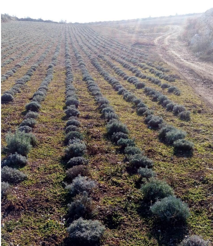
Slika 12. Nasadi u proljeće.

O nasadu, posebno u početnim fazama, je potrebno voditi brigu i u smislu osiguravanja dovoljne količine vlage pa se preporuča navodnjavanje. Navodnjavanje se obično vrši u prvoj godini kako bi se omogućilo mladim biljkama da ojačaju i stvore podzemni izdanak. Stariji nasadi obično nemaju potrebu za navodnjavanjem. Jačanje nasada se postiže i češćim orezivanjem grmića ne u svrhu žetve nego kako bi se potaknulo biljku na stvaranje gušćeg grma (Kolak i sur., 2008.). Smilje je, kako je već ranije rečeno, višegodišnja biljka o kojoj, bez obzira na njenu otpornost, treba voditi računa posebice u smislu gnojidbe te redovitog okapanja i kultiviranja kako bi se spriječilo zakorovnavanje površina pod nasadima.