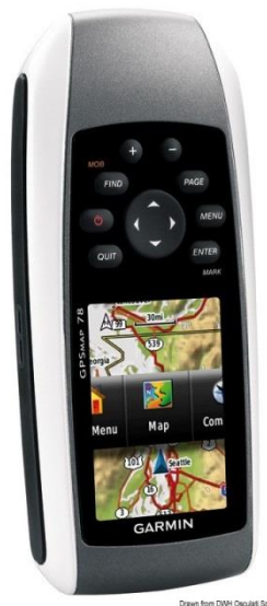
Slika 10. Prijenosni GPS

Prijenosni GPS uređaj za satelitsko pozicioniranje na terenu (slika 10.).