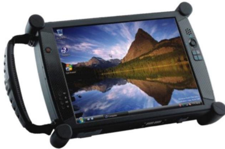
Slika 9. Tablet PC

Terenska računala (tablet PC) posebno su oblikovana za prikupljanje i unos podataka na terenu. Rade na standardnim operacijskim sustavima (Windows) kao što je prikazano na slici 9. Kao dodatak omogućuju GSM i mobilnu komunikaciju, kao i integriranu kameru. Često imaju posebno razvijeni softver i ekran osjetljiv na dodir.