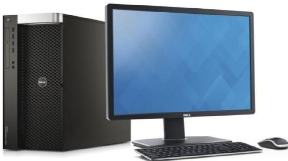
Slika 8. Grafička radna stanica sa monitorom

Radne stanice su svojim izgledom slične osobnim računalima, ali ih brzinom rada, memorijskim prostorom i kvalitetom monitora višestruko nadmašuju. Grafičke radne stanice su posebno pogodne i modificirane za primjenu u GIS-u (slika 8.).