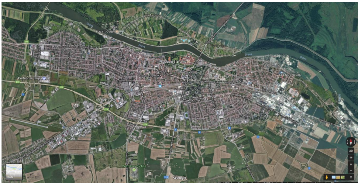
Slika 6. Katastarsko područje Grada Osijeka