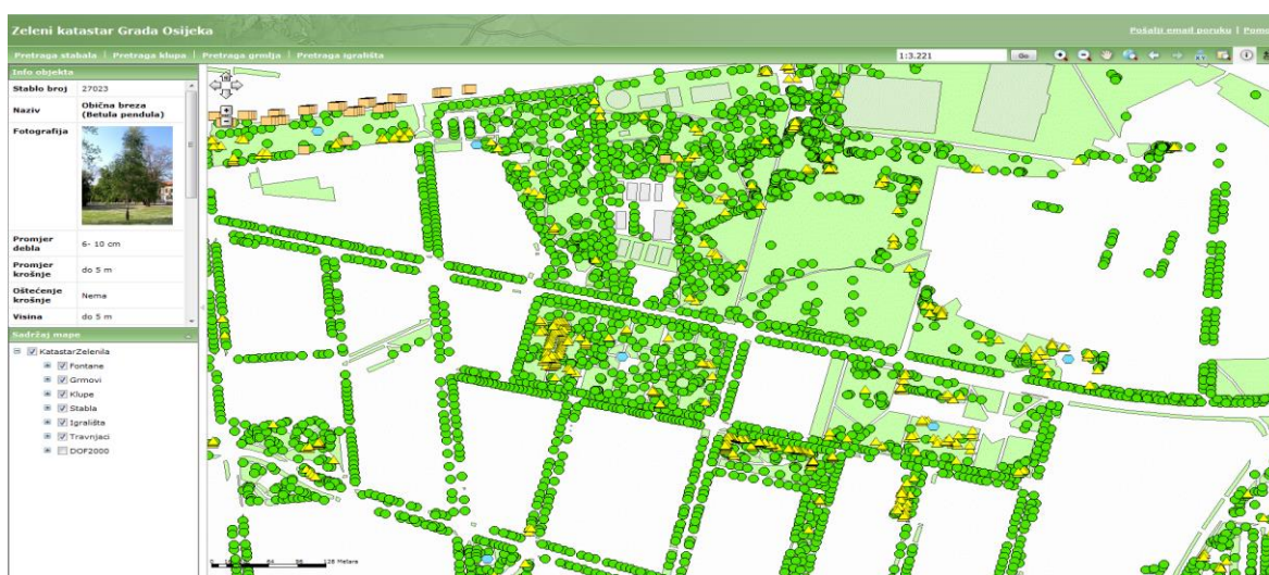
Slika 13. Zeleni katastar Grada Osijeka

Ovaj način rada omogućava kontrolu radova na zelenim površinama, promjene na istima, planiranje i provođenje infrastrukturnih radova, kontroliranje i evidentiranje druge vrste objekata i komunalne opreme. Tijekom sezonskih radova moguće je kontrolirati radove na zelenilu i upućivati na propuste, pritužbe građana i zahtjeve. U suradnji s gradskim poduzećima i koordinirati sadnju i potrebu za sadnicama i sl.