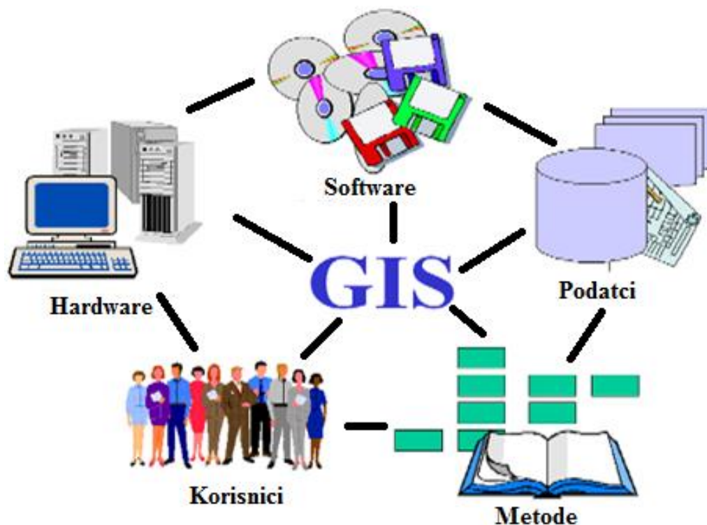
Slika 3. Elementi GIS-a