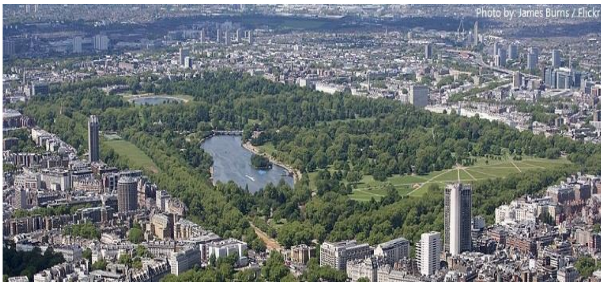
Slika 2. Hyde Park u Londonu

Javna gradska zelenila za rekreaciju i edukaciju sastavni su dijelovi strukture grada. Uređenje javnih zelenih površina postaje važan faktor prepoznatljive slike grada, te ima važnu ulogu u urbanom planiranju. Javlja se tendencija stvaranja zelenih jezgri gradova. Engleska je prva u Europi 1845. godine donijela Zakon o podizanju javnog urbanog zelenila. Tako da je danas jedan od glavnih ciljeva oblikovanja parkova razbijanje monotonije suvremene arhitekture u velikim gradskim naseljima, da služi kao podsjetnik čovjeku da je dio prirode, da zadovolji potrebu za ostvarenjem kontakta sa prirodom. Jedni od najpoznatijih suvremenih javnih parkova su Hyde Park u Londonu (slika 2.) i Central Park u New Yorku (URL1).