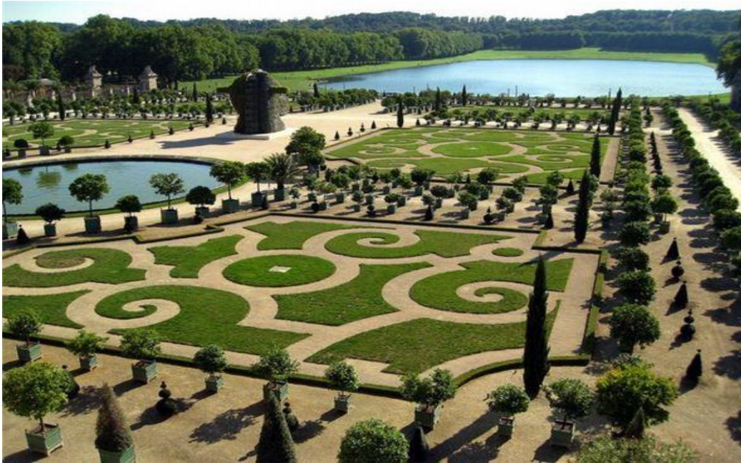
Slika 1. Vrtovi dvorca Versailles

Francuski barokni pejzaži (XVI. - XVIII. st.) dio su velike pejzažne kompozicije sa strogim formama i geometrijskim oblicima. Vrt se stapa s pejzažom, nebom, odsjajima u vodi i alejama koje vode u daljinu. Oblikovani su za velike događaje i raskošne ceremonije. Cijeli vrt zauzima velike površine do nekoliko stotina hektara. U Versaillesu se pokazuje da je pejzažna umjetnost odraz vrlo složenih društveno-političkih prilika i statusni simbol za iskazivanje moći pojedinca. Dijela André Le Nôtre, koji je projektirao Versailles (slika 1.), postala su model cijelom razdoblju (URL1).