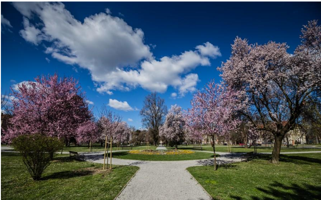
Slika 5. Park Kralja Petra Krešimira IV u Osijeku

Modeli obrade podataka su usklađeni sa prikazom rezultata i internom namjenom. Najvažniji podaci koji se prikazuju su dendrološki sastav na lokaciji, brojnost vegetacije po tipovima objekata (drveće, grupacije biljaka i travnjaci), pozicije na kojima se može obavljati sadnja drveća, prosječne ocjene kondicije (zdravstvenog stanja) i dekorativnosti za sve vrste i za svaku pojedinačno, osnovni uzroci stanja u kojem se nalaze biljke, a naročito vrste drveća koje su definirane po brojnosti kao glavne drvoredne vrste, stanje u kojem se nalaze travnjaci i dr. (URL2).