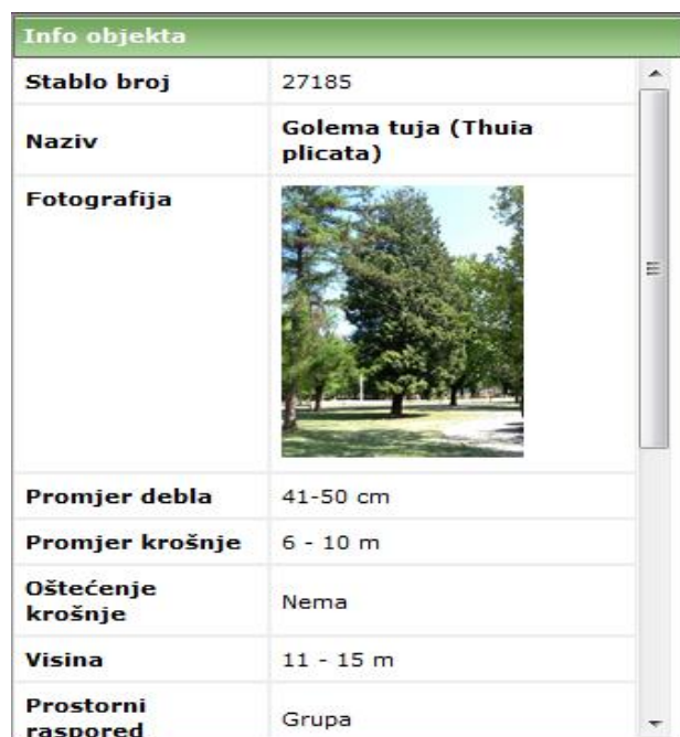
Slika 12. Primjer unošenja atributa stabla

Po potrebi se može dodati još atributa ako se ocijeni da je to potrebno radi efikasnijeg planiranja radova i slično (slika 12.). Fotografirati se može pojedinačno svako stablo, ili određene cjeline (pogled na ulicu, park i sl.) a zbog potrebe detaljnije arhive podataka kao i mogućnosti vizualnog uvida i usporedbi stanja izvršenih zahvata na zelenim površinama u određenom vremenskom razdoblju.