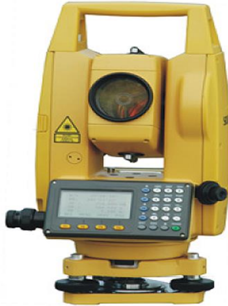
Slika 11. Totalna stanica

Snimanje točaka od interesa vrši se trigonometrijskom metodom upotrebom Totalnih mjernih stanica (slika 11.) ili GPS metodom upotrebom GPS RTK sustava. Prihvatljivija je trigonometrijska metoda jer GPS sustav otežano radi u okruženju gustog raslinja.