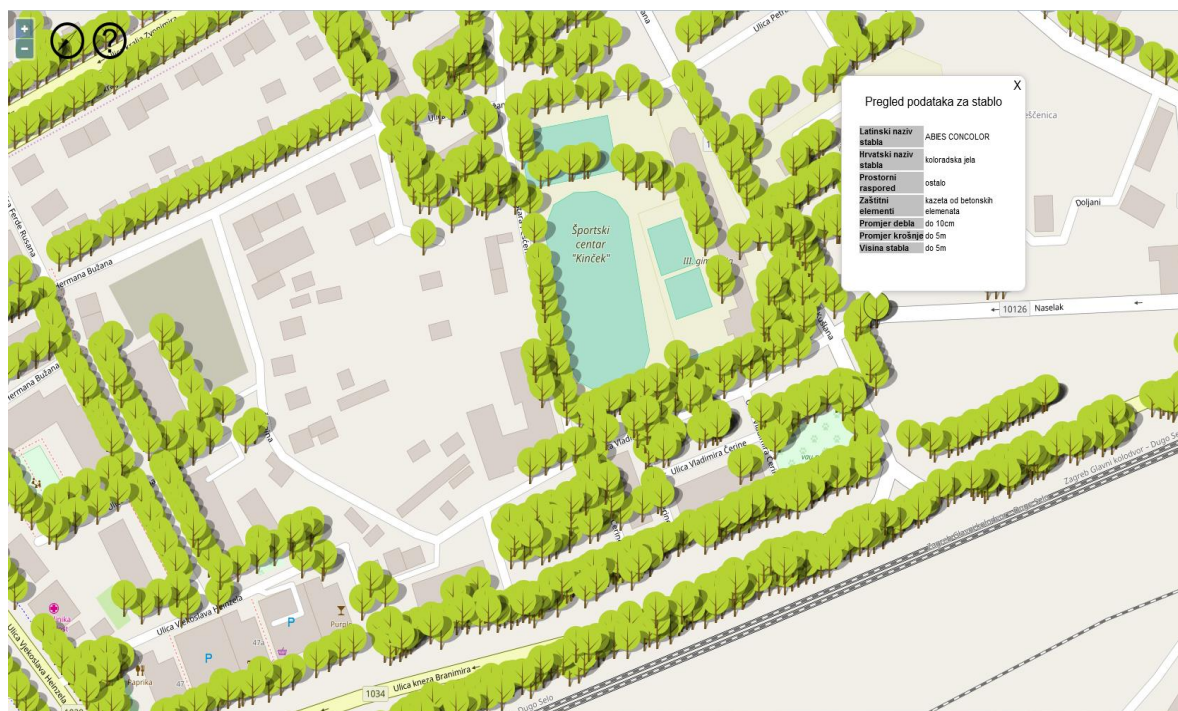
Slika 14. Zeleni Katastar Grada Zagreba

Atributi za svaki pojedini entitet podijeljeni su u atributne tablice. Podaci u atributnim tablicama određeni su prema konceptualnom modelu u dogovoru sa strukom. Završetkom primarnog unosa utvrđen je prostorni razmještaj te brojčano i atributno stanje „sadržaja“. Time je omogućeno korištenje podataka u različite svrhe sukladne interesima struke i na korist svih stanovnika. Time počinje druga faza rada koja se odnosi na ažuriranje, odnosno praćenje promjena stanja zelenila na terenu i njihovo usklađivanje sa stanjem na bazi. Ažuriranje počinje sa 2008. i traje do danas, gdje se svakodnevno ažuriraju podatci u podružnici Zrinjevac. kao što je prikazano na slici 14. (Ždravac, 2016.).