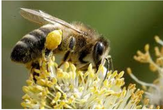
Slika 3. Apis mellifera caucasica