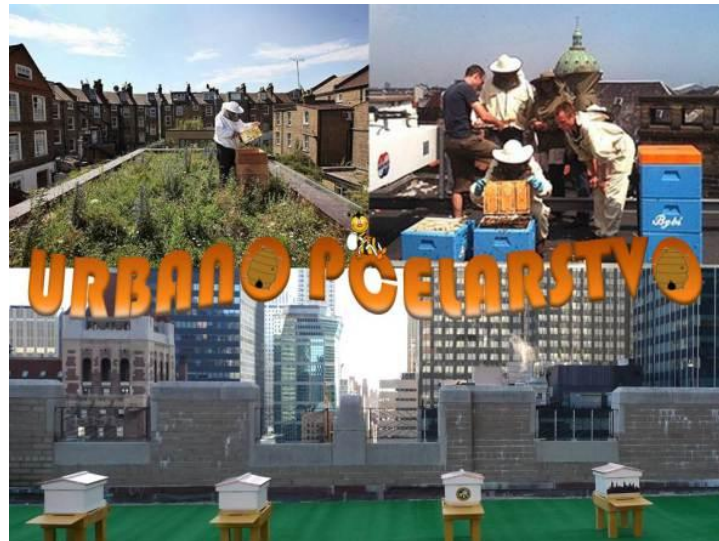
Slika 11. Košnice na krovovima zgrada

sok. Ovo potonje je od posebnog značaja za grad i njegovo zelenilo jer pčela skupljajući biljne izlučevine uklanja izvrsnu podlogu za razvoj brojnih gljivica, bakterija i ostalih patogena koji uništavaju zelenilo. Zelenilo na području gdje obitavaju pčele većeg je volumena i povećane je sposobnosti apsorpcije CO 2 i ostalih stakleničkih plinova što direktno doprinosi unapređenju kakvoće zraka.