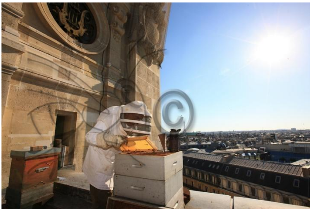
Slika 12. Opera kuća Opéra Garnier u