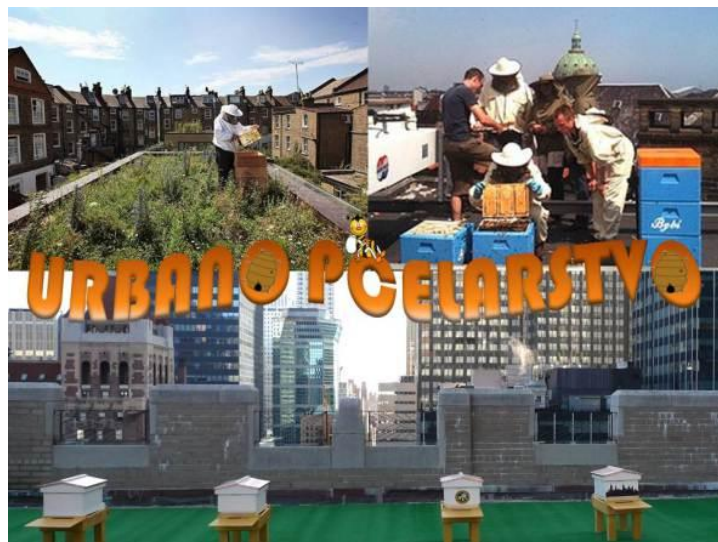
Slika 11. Košnice na krovovima zgrada

sok. Ovo potonje je od posebnog značaja za grad i njegovo zelenilo jer pčela skupljajući biljne izlučevine uklanja izvrsnu podlogu za razvoj brojnih gljivica, bakterija i ostalih patogena koji uništavaju zelenilo. Zelenilo na području gdje obitavaju pčele većeg je volumena i povećane je sposobnosti apsorpcije CO 2 i ostalih stakleničkih plinova što direktno doprinosi unapređenju kakvoće zraka.