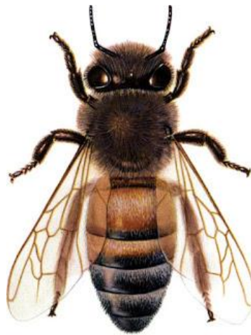
Slika 4. Apis mellifera ligustica Spin.