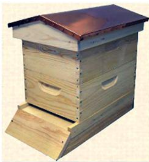
Slika 8. Dadan-Blatova (DB) košnica

košnice, medišta, zbjeglišta i poklopca. Vanjske mjere su 500*520 mm i visina 310 mm. U njemu je smješteno obično 12 okvira vanjskih dimenzija 440*300 mm. Na plodište se postavljaju nastavci, koje nazivamo medištima, istih dimenzija, ali im je visina upola manja. Zbog dubine okvira i stvaranja veće medne kape pčele uspješno preživljavaju zimu i razvijaju se u jednom nastavku. Nedostatak ovih košnica je veličina okvira medišta i plodišta.