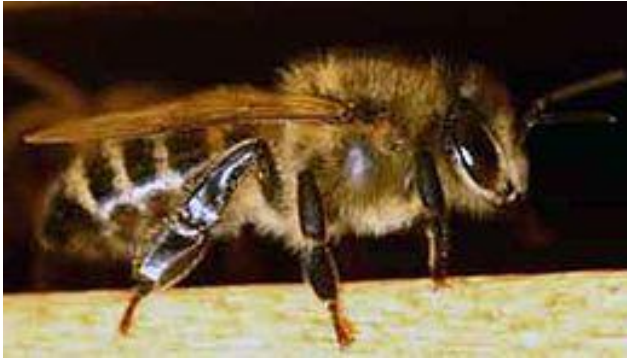
Slika 5. Apis mellifera carnica