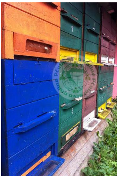
Slika 9. Alberti-Žnideršičeva košnica (AŽ)