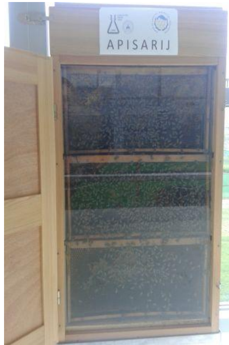
Slika 13. Apisarij- Poljoprivredni fakultet Osijek