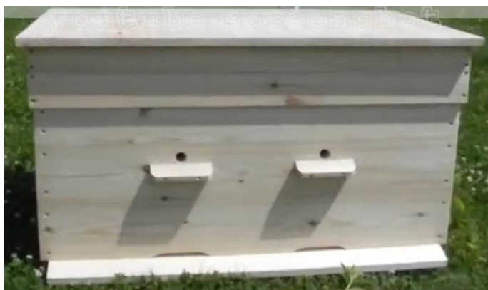
Slika 10. Pološka