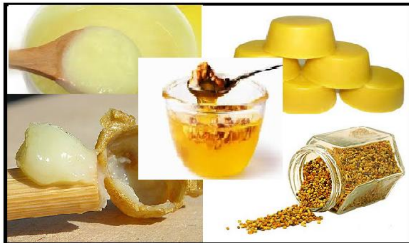
Slika 6. Pčelinji proizvodi

3.4.5. Vosak je proizvod voskovnih, voštanih žlijezda pčela. Vosak miriše po biljci s koje se prikupio. Vosak je žute boje, a nijansa mu ovisi o omjeru tvari, propolisa i peluda u vosku. Pčelinji vosak sastoji se od masnih kiselina, etera, viših alkohola i ugljikohidrata visoke molekularne težine. Uporaba voska je višestruka. Velike količine koriste se za izradu svijeća, a koristi se u kozmetici i farmaciji, u tekstilnoj prehrambenoj i elektroindustriji, kožarstvu, zubarstvu, slikarstvu i u konzervatorske svrhe.