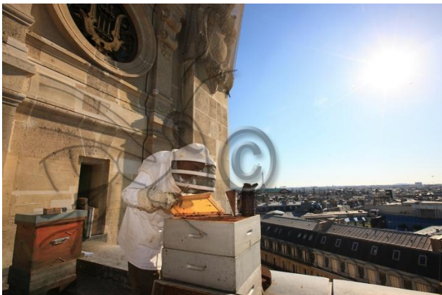
Slika 12. Operna kuća Opéra Garnier u