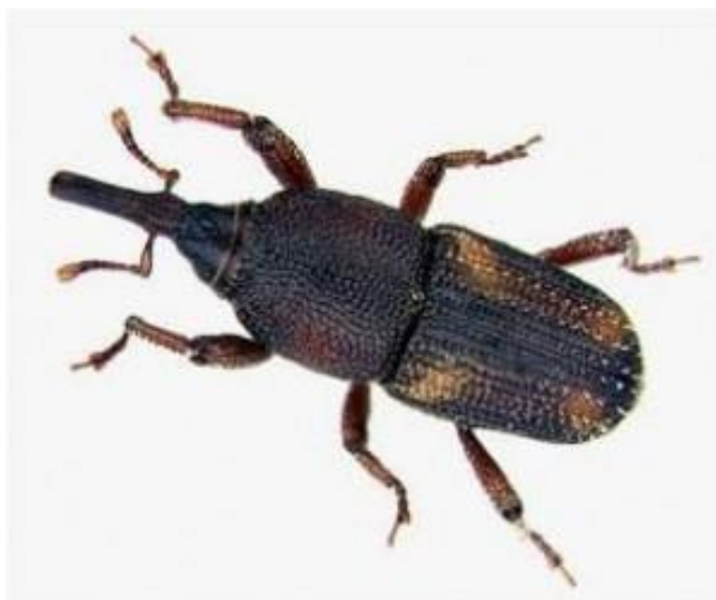
Slika 1. Rižin žižak ( Sitophilus oryzae L.)