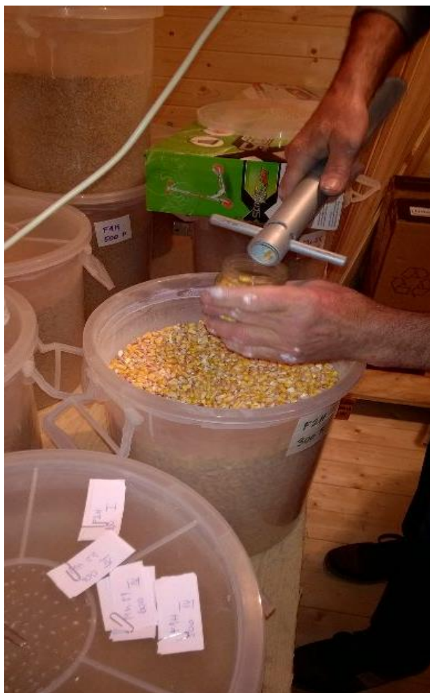
Slika 7. Izuzimanje poduzoraka 100 g zrna kukuruza pomoću sonde