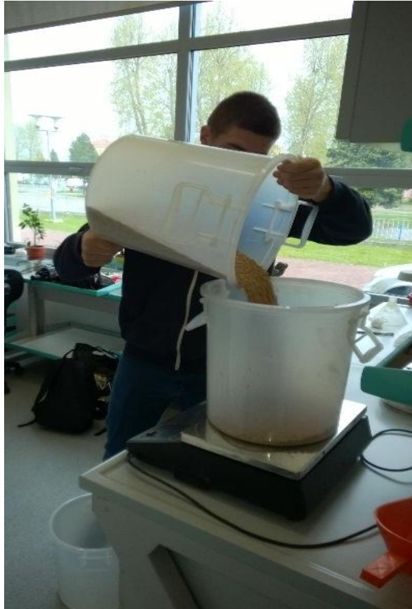
Slika 6. Odvaga uzorka 10 kg zrna kukuruza