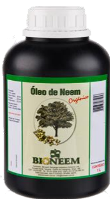
Slika 5: Komercijalni proizvod BioNeem®