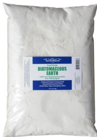
Slika 3. Komercijalni pripravak na bazi dijatomejske zemlje

Dijatomejska zemlja se može koristiti za zaštitu domaćih životinja od nametnika kao što su buhe kod pasa ili malofaga kod kokoši. Izrazito je insekticidna i za žohare. DZ se može upotrijebiti i u vrtu za zaštitu biljaka od nametnika, ali u tom slučaju će osim nametnika uginuti i korisni kukci. DZ jest najdjelotvornije prirodno prašivo koje se upotrebljava kao insekticid. Dijelovi dijatoma ili dijatomi zalijepe se na tijelo kukca i fizikalnim silama, ponajviše sorpcijom, a ponekad i abrazijom, oštećuju voštani sloj na tijelu koji štiti kukca od gubitka vlage iz njegova tijela. Kukci gube vlagu iz tijela kroz oštećena mjesta te nakon nekog vremena radi isušivanja ugibaju. Isto tako, DZ ima i odbijajuća svojstva za kukce, što također ima pozitivnih utjecaja pri zaštiti uskladištenih proizvoda. (Korunić, 2010.).