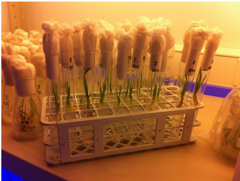
Slika 7. Eksplantati ljutike pod bijelim svjetlom

Rukovanje s eksplantatima prilikom uvođenja u kulturu provedeno je korištenjem sterilnog laboratorijskog pribora te se odvijalo u sterilnim uvjetima. Uvuđenje u kulturu se odvija na način da se pincetom svaki eksplantat uroni u hranjivu otopinu koja se nalazi u epruveti, bitno je plemenikom dezinficirati pincetu prilikom svakog novog eksplantata kako bi se smanjio postotak kontaminacije te se iz istog razloga na epruvetu stavlja i čep. (Slika 6, slika 7.).