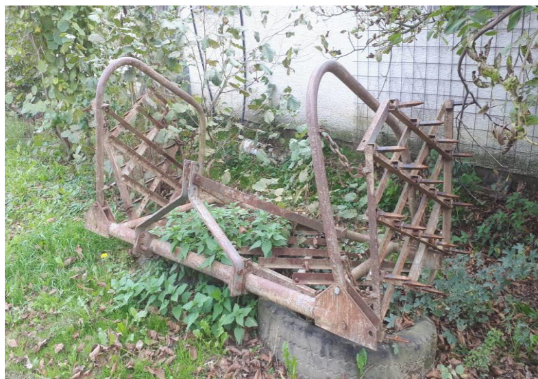
Slika 4. Drljača 4 metra širine