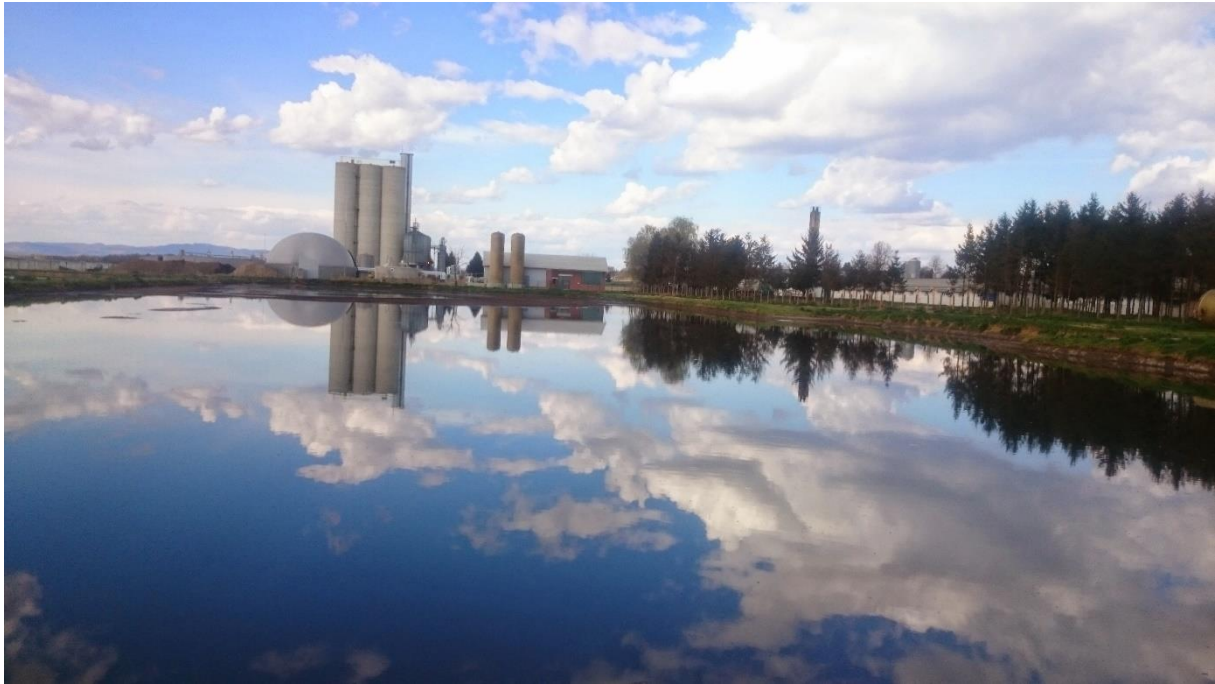
Slika 8. Laguna sa tekućim digestatom- Bioplinsko postrojenje Gradec