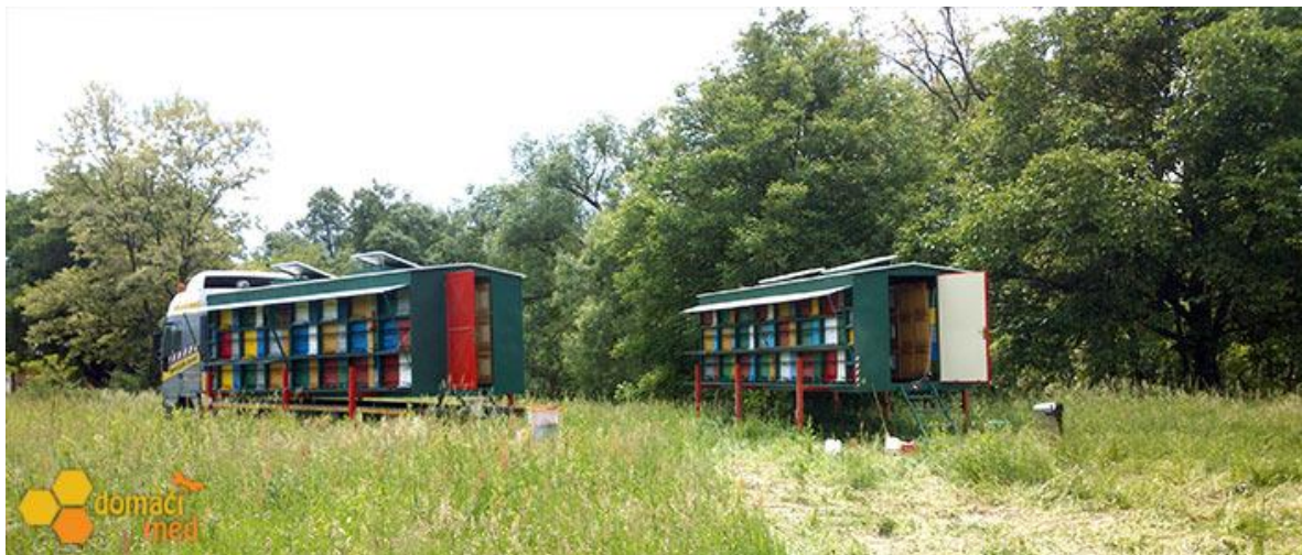
Slika 9. Pčelinjak OPG-a Krizmanić

Obiteljsko poljoprivredno gospodarstvo „Pčelarstvo Krizmanić“, pčelarstvom se bavi od 1986. godine. U početku su pčelarili s 14 košnica da bi tijekom godina došli do 180 košnica, u pravilu se koriste „AŽ“ košnicama. U radu sa i oko pčela uključena je čitava obitelj Krizmanić. Njihov glavni proizvod je više vrsta monofloernih i multifloernih medova vrhunske kvalitete: bagremov med, kestenov med, livadni med i lipov med, kao i med uljane repice te suncokretov med.