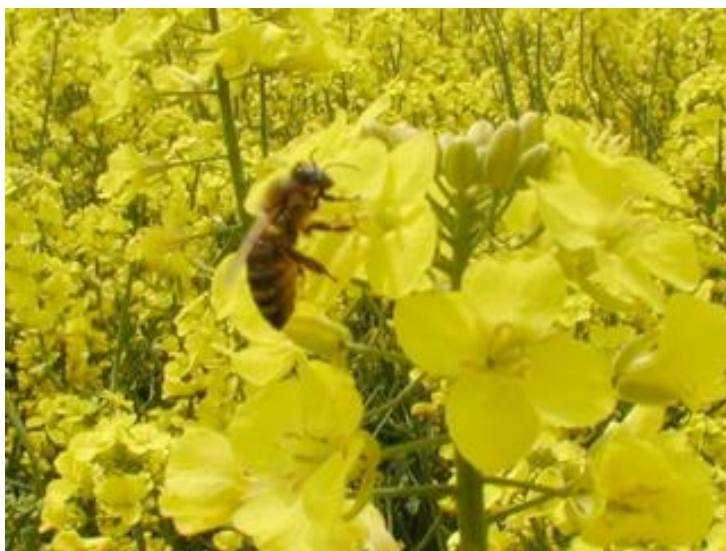
Slika 6. Pčela na cvijetu uljane repice