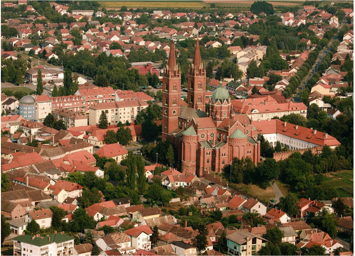
Slika 2. Grad Đakovo