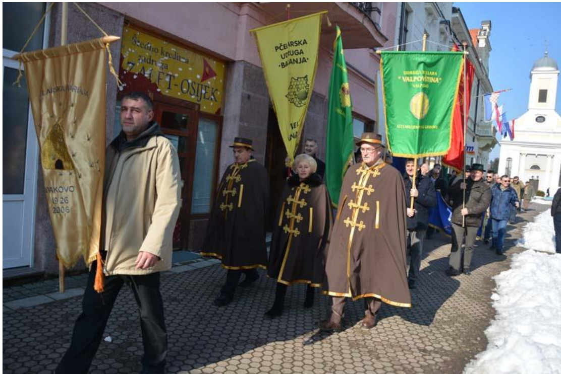
Slika 8. Mimohod pčelara đakovačkim korzom