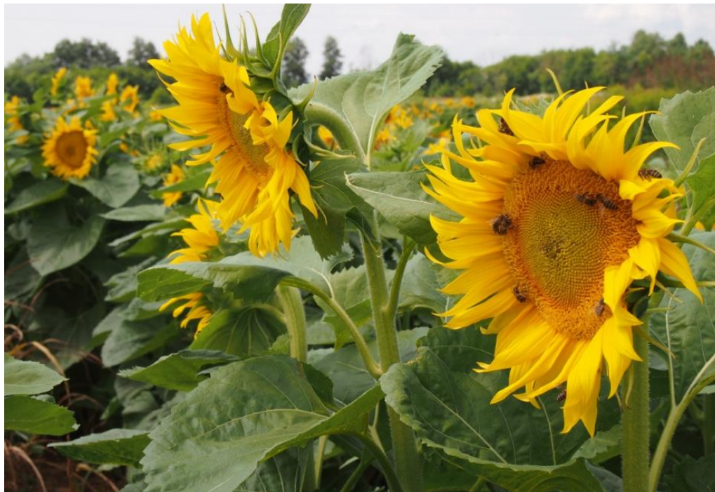
Slika 5. Pčele na cvijetu suncokreta

Suncokret ( Helianthus annuus ) – Cvatnja suncokreta počinje krajem lipnja i početkom srpnja, a najviše luči nektar kad je u punom cvatu. Spada među najmedonosnije biljke. Lučenje nektara ovisi od vlažnosti tla, kao i od vlažnosti i temperature zraka. Za pčelarstvo je suncokret značajan i zbog toga što cvjeta u vrijeme kada uglavnom nema drugog medonosnog bilja.