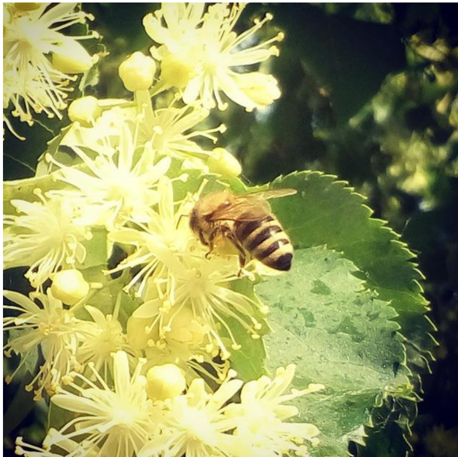
Slika 4. Pčela na cvijetu lipe

Lipa (rod Tilia ) – lipe cvjetaju od lipnja do srpnja. Jaka pčelinja zajednica pri dobrom medenju može dnevno donijeti 5 do 6 kg meda. Ako medenje potraje, postižu se prinosi do 20 do 30 kg, pa čak i više meda. Lipov med spada u najkvalitetnije sorte medove, iako ga neki potrošači ne vole zbog vrlo jakog, ali ugodnog mirisa. Svjetle je boje, sa žutim preljevom, a kada kristalizira ima žućkastu boju. Pored nektara, pčele s lipe prikupljaju i medljiku. Taj med od medljike nije pogodan za zimovanje pčela, a ako se brzo ne izvrca, za nekoliko dana toliko kristalizira da ga je vrlo teško izvrcati.