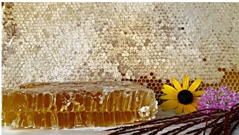
Slika 10. Med u saću

Na ovom OPG-u proizvodi se med s prirodnim, organskim dodacima poput cejlonskog cimeta, svježeg đumbira, ali i oni za kojim će rado posegnuti ljubitelji čokolade, organskim kakaom i čokoladom koja sadrži 80% kaka. U sklopu njihovih proizvoda nalazi se i med u saću, vosak, tinktura propolisa kao i njegov prah, pelud te matična mliječ.