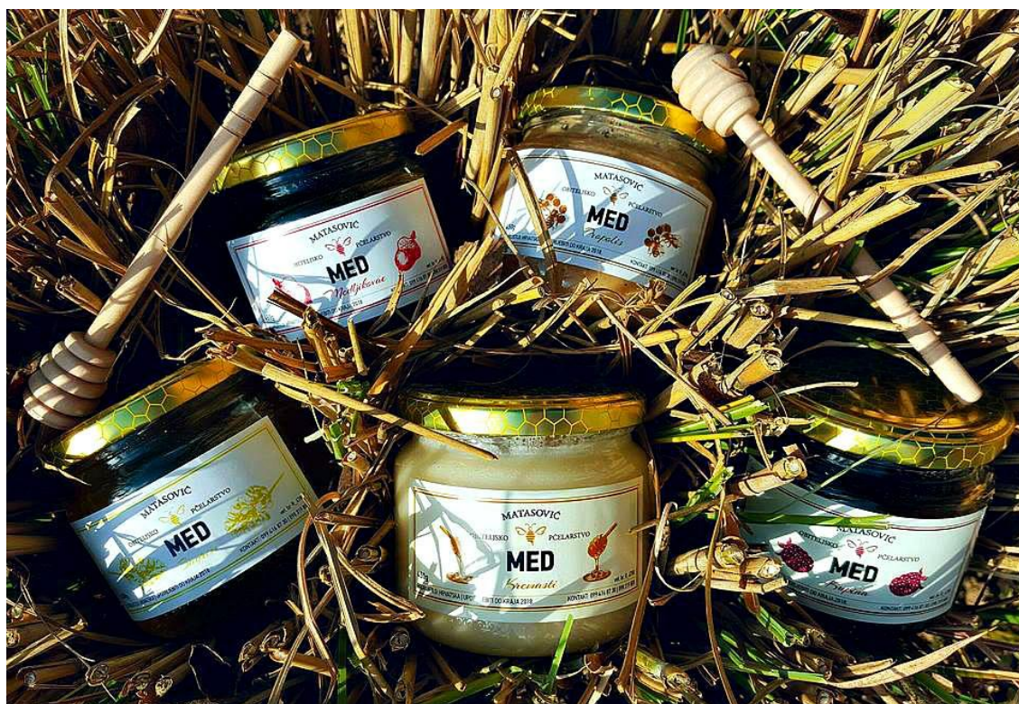
Slika 11. Razne vrste meda obitelji Matasović

Cjelokupni asortiman obitelji Matasović dijeli se na med i ostale pčelinje proizvode. Uz bagremov, cvjetni, kremasti, kupinov, medljikovac, sunokretov i med uljane repice, proizvode i med s dodacima kao što su med s dodatkom cimeta, čokolade i kaka, đumbira te med s prahom propolisa. Od ostalih pčelinjih proizvoda imaju med u saću, tinkturu i prah propolisa te vosak.