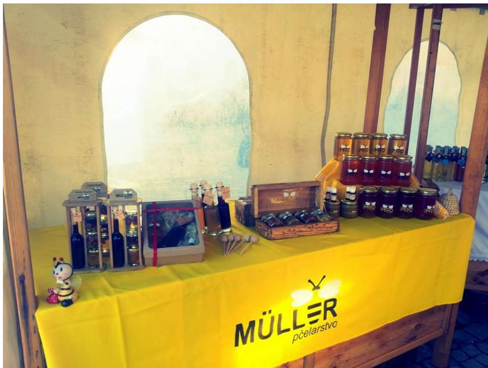
Slika 12. Štand sa pčelinjim proizvodima obitelji Müller

Na 7. Miholjačkom sajmu 2013. godine dobili su priznanje za kreativnost u uređivanju izložbenog prostora i najbolje uređeni štand.