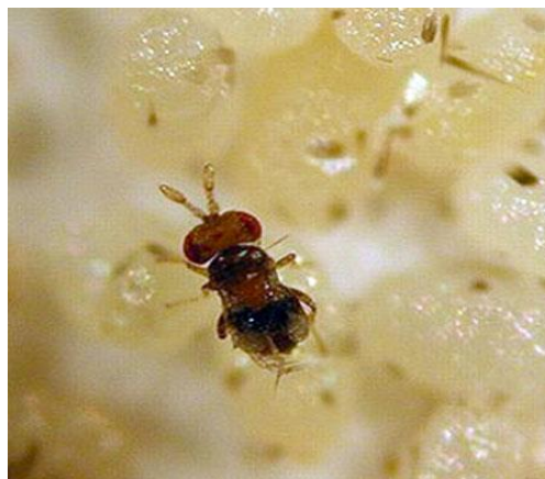
Slika 24. Rod Trichogramma