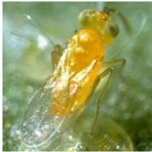
Slika 27. Eretmocerus eremicus