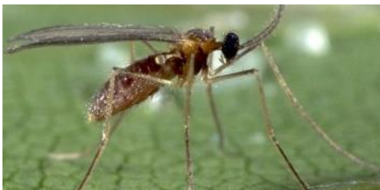
Slika 18. Aphidoletes aphidimyza