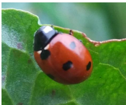
Slika 1. Coccinella septempunctata L.

(2013.) ustanovili su da prisutnost božjih ovčica na listovima duhana uzrokuje značajno smanjenje i naseljavanje lisnih uši. Ostavljajući tragove na lišću, ove božje ovčice luče organske spojeve koji izazivaju izbjegavanje pojave lisnih uši na tim mjestima jer uši koriste mirisne signale za otkrivanje prisutnosti božjih ovčica i tako mijenjaju svoje ponašanje u skladu s tim. Ukoliko su prisutne na biljkama, mogu značajno smanjiti populacije lisnih uši.