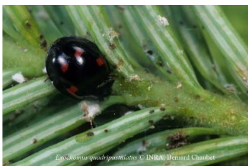
Slika 3. Exochomus quadripustulatus L.

Exochomus quadripustulatus L. (Slika 3.) su crne božje ovčice s dvije narančaste pruge na svakom pokrildu, duge oko 4-5 mm. Prirodni su neprijatelji štitastih uši kao i vrsta Chilocorus bipustulatus L. (Maceljski, 2002.).