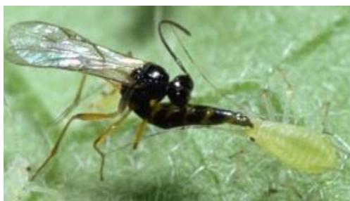
Slika 31. Aphidius ervi