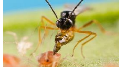
Slika 30. Aphidius matricariae