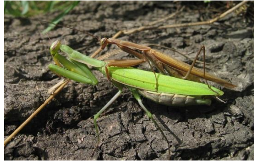
Slika 20. Zelena i smeđa bogomoljka