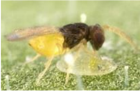
Slika 25. Encarsia formosa