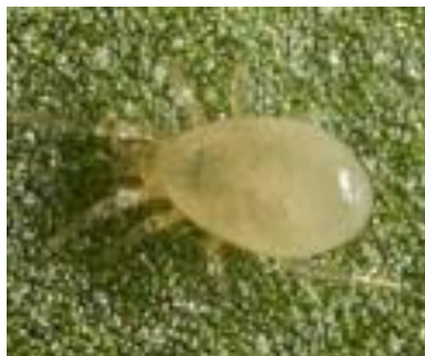
Slika 21. Amblyseius swirskii

Predatorske grinje prirodni su neprijatelji mnogih štetnih kukaca u voćnjacima, uskladištenim prostorima, zatvorenim prostorima, a posebice se hrane fitofagnim grinjama i to voćnim crvenim paucima i drugim štetnim vrstama grinja kojima uspješno reguliraju brojnost populacije. Imaju od 4 do 7 generacija godišnje, ali i više ukoliko se hrane s više vrsta štetnika. Pojavljuju se u crvenkastim, bjelkastim i drugim bojama, sa kruškolikim tijelom i dugim nogama zbog kojih su vrlo pokretne (Maceljski, 2002.). Usni ustroj im je prilagođen za bodenje i sisanje, pa tako grabežljive grinje roda Amblyseius mogu suzbiti kalifornijskog i duhanovog tripsa (Bažok i sur., 2014.), a vrste A. barkeri i A. cucumeris mogu suzbiti kalifornijskog tripsa i običnog crvenog pauka u zatvorenom prostoru gdje svakog dana isišu od 2 do 5 tripsa (Maceljski, 2002.). Vrsta A. swirskii (Slika 21.) suzbija cvjetnog štitastog moljca, duhanova štitastog moljca, ličinke kalifornijskog tripsa, koprivinu grinju. Vrsta A. barkeri koristi se za suzbijanje tripsa u cvijeću i povrću, jagodnih grinja i grinja u proizvodnji amarilisa (Bažok i sur., 2014.).