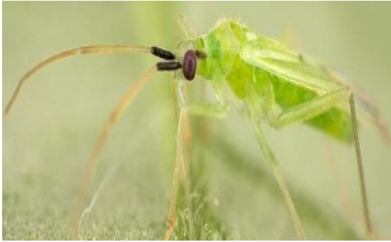
Slika 13. Macrolophus caliginosus