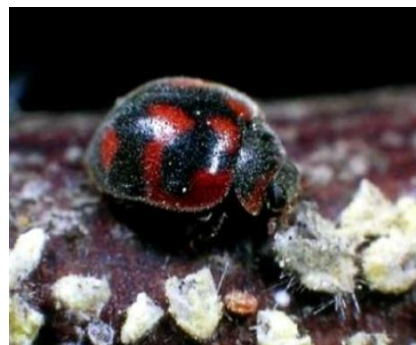
Slika 5. Rodolia cardinalis Muls.