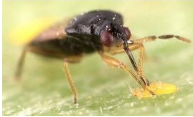
Slika 16. Orius leavigatus