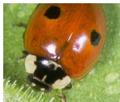
Slika 2. Adalia bipunctata L.