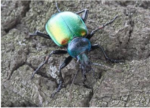
Slika 9. Calosoma sycophanta