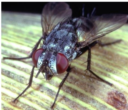
Slika 23. Lydella thompsoni

Bombyliidae – Dlakave muhe zujalice također parazitiraju ličinke, jaja i kukuljice raznih štetnika, a najpoznatije vrste dolaze iz roda Anthrax (Maceljski, 2002.).