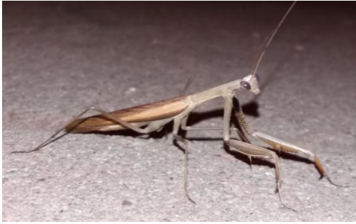
Slika 19. Mantis religiosa