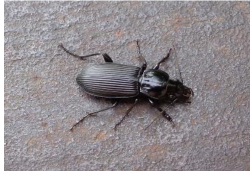
Slika 10. Pterostichus melanarius