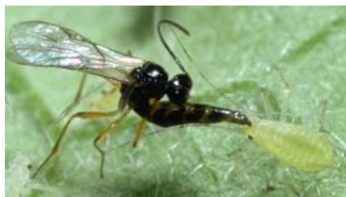
Slika 31. Aphidius ervi