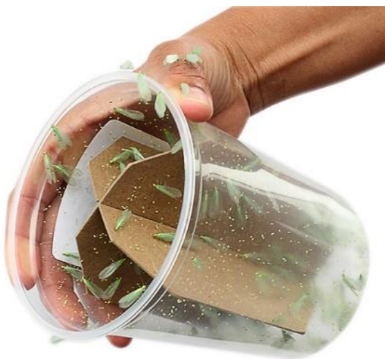
Slika 17. Pakiranje odraslih jedinki Chrysopa carnea

Chrysopa carnea Steph. je najčešća vrsta koja se uzgaja u laboratorijima diljem svijeta, pa se tako ličinke najčešće uzgajaju na jajima i gusjenicama žitnog moljca, krumpirova ili brašnenog moljca i mogu se kupiti veća ili manja pakiranja jaja, ličinki ili imaga (Slika 17.) radi biološkog suzbijanja štetnih kukaca, napose lisnih uši (Maceljski, 2002.). Isti autor opisuje kako jedna ličinka može pojesti oko 30 do 50 crvenih pauka za sat vremena, dok za cijelog života pojede 200 do 500 zelenih breskvinih lisnih uši, te navodi kako se na 1 hektar treba ispustiti oko 10 000 do 15 000 zlatooka. Postoje i vrste C. septempunctata , C. formasa , Cuntochrysa baetica , vrste iz roda Hemerobius i Mallada .