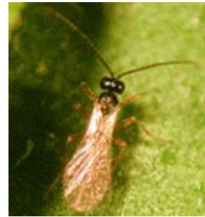
Slika 28. Dacnusa sibirica