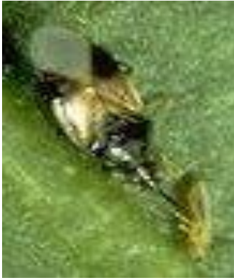
Slika 15. Orius insidiosus