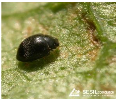
Slika 4. Stethorus punctillum Weize

Stethorus punctillum Weize (Slika 4.) su crne, male, neugledne božje ovčice koje vrlo djelotvorno uništavaju fitofagne grinje, a posebno crvene pauke bez kojih ne mogu vršiti reprodukciju (Maceljski, 2002.). Ukoliko nema štetnika Tetranychus urticae kojeg preferira, napada vrstu Panonychus ulmi .