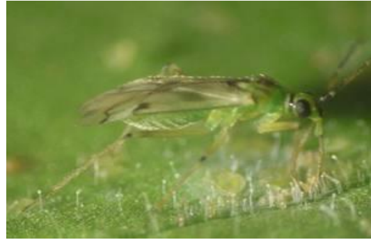
Slika 14. Nesidiocoris tenuis