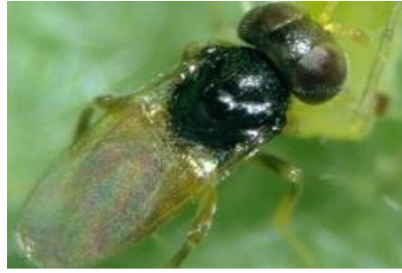
Slika 26. Aphelinus abdominalis