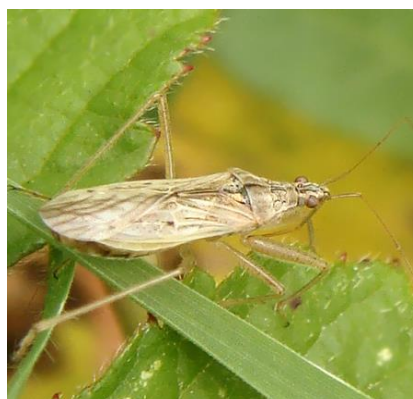
Slika 12. Nabis pseudoferus