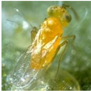
Slika 27. Eretmocerus eremicus