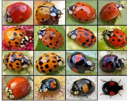
Slika 8. Razni pojavni oblici Harmonia axyridis Pallas