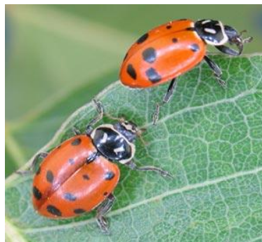
Slika 7. Hippodamia convergens G.-M.