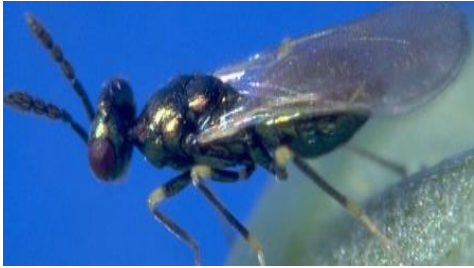
Slika 29. Diglyphus isaea