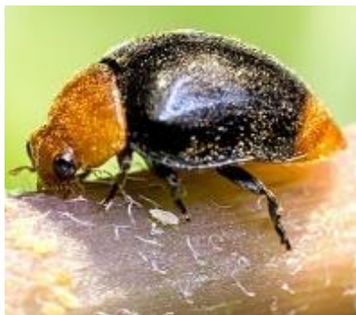
Slika 6. Cryptolaemus montrouzieri Muls.

Hippodamia convergens G.M. (Slika 7.) je božja ovčica koja se koristi i uvozi za biološko suzbijanje lisnih uši i duhanova resičara u SAD-u, Njemačkoj i dr. Ličinka može pojesti do 150 ličinki resičara dnevno, a imago do 300 ličinki resičara dnevno (Maceljčki, 2002.).