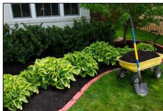
Slika 24. Ukrasno malčiranje; (Izvor: www.google.hr/search?q=dekorativno+malčiranje , 3.6.2017.)