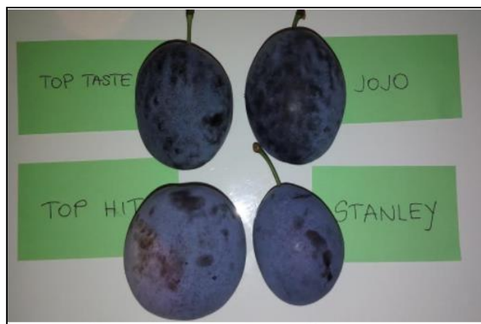
Slika 33. Sorte plave šljive uzgajane na OPG-u Miličić iz Antunovca

U uzgoju šljiva ovo gospodarstvo nastoji pratiti nove tehnologije i suvremene načine uzgoja, a u kontekstu ovoga rada valja istaknuti postupke zatravnjivanja, zelene gnojidbe, koji se na ovom gospodarstvu primjenjuju od 2014. godine. Kako se vlasnik imanja Miličić orijentirao prvenstveno na proizvodnju šljiva, želja mu je stalno unaprjeđivati svoju proizvodnju, pa se, u cilju stjecanja novih i korisnih iskustava, rado upoznaje s novim dostignućima na ovom području poljoprivredne proizvodnje.