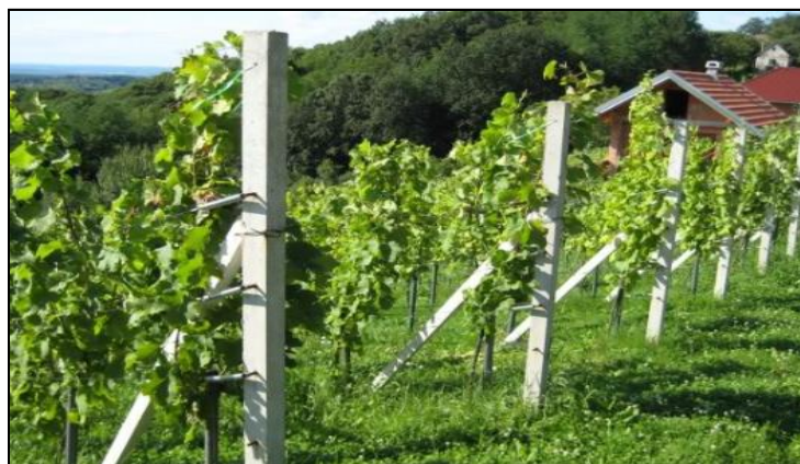
Slika 32. Zatravljeni vinograd

Za zatravljivanje vinograda siju se jednogodišnje, jare ili ozime vrste, vrste koje kličaju, rastu i ugibaju u tijeku jedne godine, ili višegodišnje vrste koje žive tri ili više godina. Te vrste pripadaju u pravilu porodici trava ili porodici lepirnjača. Uz njih se često siju i neke krmne kulture, kao one iz porodice kupusnjača, repe ili facelija. Ponekad se u vinogradu ostavi da prirodna populacija biljaka prekrije tlo, pa se redovitom košnjom stvara prikladan zeleni pokrov. Jednogodišnje se biljke koriste za zatravljivanje radi poboljšanja plodnosti tla u vinogradu, čija struktura i sadržaj organske tvari u tlu nisu zadovoljavajući da bi se moglo obaviti trajno zatravljivanje. Ovo se može smatrati svojevrsnom meliorativnom mjerom kojom se tijekom nekoliko vegetacija, sjetvom i zaoravanjem vrsta utječe na povećanje sadržaja organske tvari u tlu. Kada tlo postigne zadovoljavajuću plodnost, vinograd se može trajno zatraviti i tako očuvati postignuto stanje plodnosti.