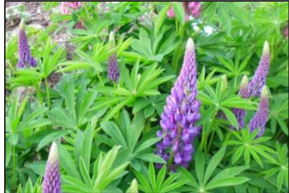
Slika 3. Lupina