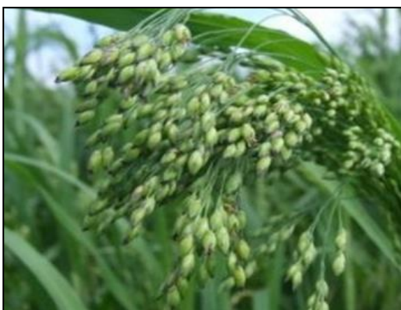
Slika 12. Proso