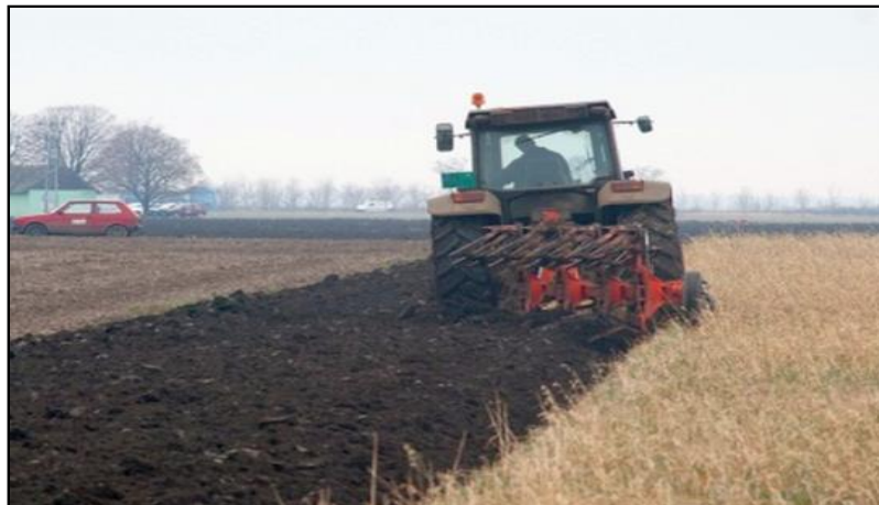
Slika 8. Zaoravanje biljnih ostataka pokrovnog usjeva zobi

Zaoravanje ovih biljaka korisno je kako na teškim, tako i na pjeskovitim tlima (Slika 8), a naročitu važnost ima na onim zemljištima koja se dulje vrijeme gnoje isključivo mineralnim gnojivima. Kako pokrovne biljke imaju dobro razvijeno korijenje, ono će popraviti strukturu tla i vodnog režima, te omogućiti stvaranje organske tvari u tlu.