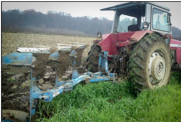
Slika 14. Uništavanje pokrovnog usjeva zaoravanjem

Dva do tri tjedna prije sjetve glavnog usjeva pokrovni se usjevi uništavaju. Uništavanje se može obaviti herbicidima ili mehanizacijom. Uništavanje pokrovnog usjeva zaoravanjem i poljoprivrednim valjkom prikazuju slike 14 i 15: