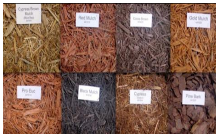
Slika 22. Različite vrste i boje dostupnog malča