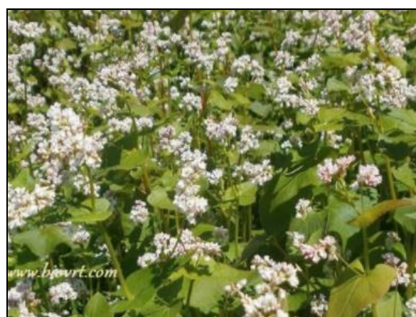
Slika 13. Heljda