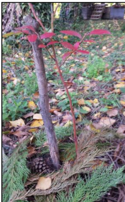
Slika 19. Sjeckane grančice kao malč

veže više vode i omiljeno je stanište za razne vrste štetnika. Biljke kao što su borovnica, vrijesak, azaleja, rododendron i druge, koje vole kiselu pH reakciju tla, dobro je malčirati iglicama četinjača. Kako bi se poboljšala struktura teških, zbijenih tala, za malčiranje izvrsno mogu poslužiti sjeckane grančice (Slika 19). One razrahljuju tlo i donose potreban kisik, što olakšava i otjecanje vode koju donose obilne padaline. Budući grančice za svoje razlaganje trebaju veće količine dušika, veći će se učinak postići ako se kombiniraju s travom ili s nekim od dušičnih gnojiva – stajskim, kokošnjim i sl.