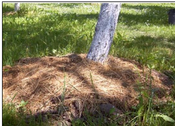
Slika 29. Organsko malčiranje voćaka u vruće dane

Malč ublažava variranje temperature tla, tj. temperaturne razlike između dana i noći, te ljeta i zime. Zato je malčiranje vrlo korisno na toplijim južnijim položajima i u kontinentalnim zonama gdje su temperaturne razlike vrlo visoke i gdje se tlo duboko smrzava. Ispod malča tlo je po danu hladnije, a po noći i zimi znatno toplije nego što je to pri ostalim sustavima odr-