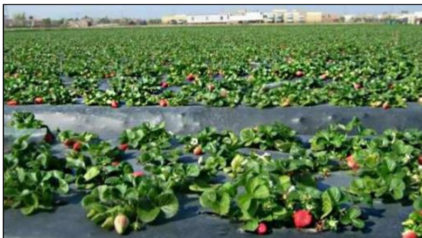
Slika 30. Nasad jagoda pod folijom

Upotreba folija za malčiranje najbolje je zastupljena u nas u uzgoju jagoda (Slika 30). Uzgoj pod folijama brzo suzbija rast korova, a kako se korov najintenzivnije pojavljuje tijekom lipnja, srpnja i kolovoza, dobro je da nasadi jagoda u to vrijeme budu stalno prekriveni folijama.