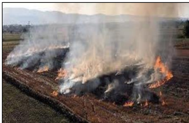
Slika 20. Spaljivanje posliježetvenih ostataka

Poslije žetve strnih žitarica na poljima ostaju posliježetveni ostaci. Poljoprivrednici ponekad spaljuju posliježetvene ostatke (Slika 20), no to je najlošiji način postupanja s ostacima. Spaljivanje čak i nije uvijek uspješno, a pored toga je i skupo i traži puno rada. Zaboravlja se da su posliježetveni ostaci bogati organskom tvari, koja bi se mogla iskoristiti za obogaćivanje tla, a spaljivanjem se potpuno gubi. Suvremena organska poljoprivreda koristi posliježetvene ostatke kao malč.