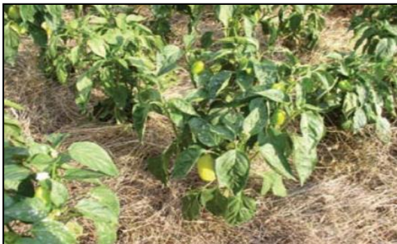
Slika 18. Malčiranje slamom u povrtnjaku

ona je sklona brzom truljenju, stoga ju treba prije nanošenja ostaviti da se osuši (Benyovski Šoštarić, 2010.).