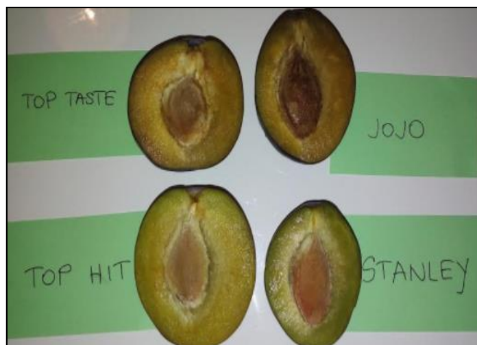
Slika 34. Sorte plave šljive uzgajane na OPG-u Miličić iz Antunovca

Održavanje zemljišta u voćnjaku zasigurno zauzima važno mjesto u cjelokupnom procesu uzgoja šljiva. Slavonija je područje u kojem prevladava nedostatak oborina u tijeku vegetacijskog razdoblja biljaka. Kako se u područjima s takvim klimatskim obilježjem primjenjuje uglavnom jalovi ugar kao način održavanja tla u voćnjaku, u OPG-u Miličić započelo se s primjenom tog načina održavanja zemljišta. Jalovi ugar našao je primjenu na ovom OPG-u iz još jednog razloga: naime, voditelj OPG-a upoznat je s činjenicom da jalovi ugar manifestira svoje prednosti samo uz redovit unos organskih gnojiva u tlo.