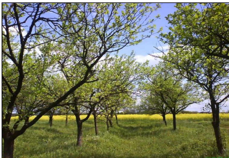
Slika 26. Potpuno zatravljivanje tla u voćnjaku

Neki uzgajivači primjenjuju takav sustav održavanja voćnjaka u kojem se međuredni prostor zasije travom, a prostor između stabala ostavlja čistim, bez trave, što se postiže obradom pomoću bočnih freza. Košnja trave izvodi se 6 – 8 puta godišnje, odnosno u vrijeme kada trava narasta do visine 10 – 15 cm. Obavlja se rotacijskim kosačicama ili malčerima. Pokošena trava ostaje na mjestu ili se njome popunjava redni prostor oko stabala. Prednost ovog načina obrade jest u tome što omogućuje stabilniji vodozračni režim zemljišta, a praktična se strana sastoji u mogućnosti primjene mehanizacije tijekom cijele godine. Nedostaci se sastoje u troškovima formiranja travnog pokrivača sjetvom trave, te u naseljavanju raznih štetnika, glodavaca, koji vole obitavati u travnatom prostoru.