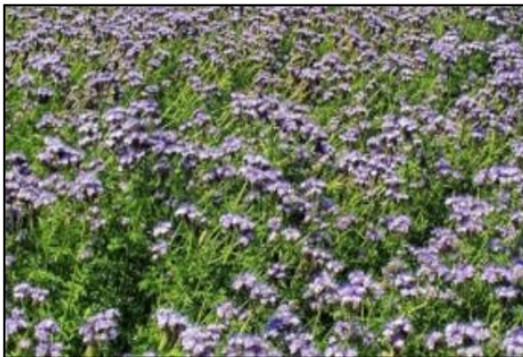
Slika 6. Facelija