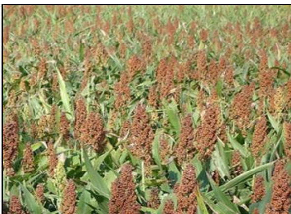
Slika 10. Stočni sirak

Najčešće upotrebljavane pokrovne usjeve prikazuju slike 10 – 13: