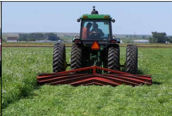
Slika 15. Uništavanje pokrovnog usjeva poljoprivrednim valjkom