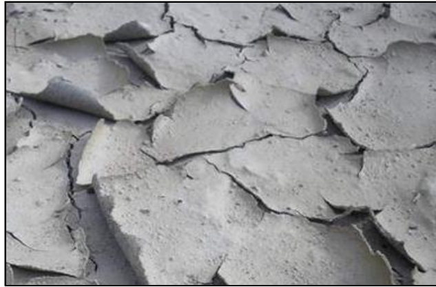
Slika 17. Izgled površine tla uslijed naglog isušivanja površinskog sloja, (Izvor: Bugarčić, 2013.)

Temperatura tla zaštićenog pokrovom od malča bit će ujednačena i time povoljna za rast i razvoj biljaka.