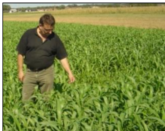
Slika 11. Sudanska trava; (izvor: www.google.hr/search?q=sudanska+Trava ; 31.5.2017.)