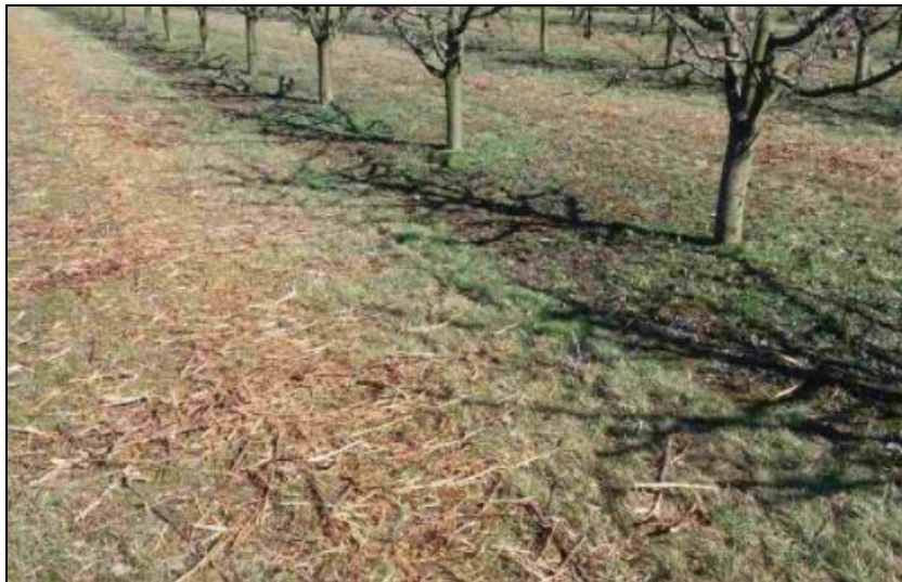
Slika 37. Malčiranje granja poslije rezidbe

pravilan rast ploda. Iako su Fertine na OPG-u upotrebljavane i ranije, u posljednje dvije godine primijećeno je povećanje čvrstoće mesa ploda, intenzivnija boja šljiva i znatno duže trajanje svježine šljivinih plodova.