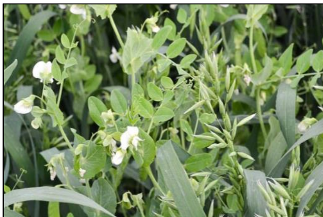
Slika 9. Mješavina trava i lepirnjača kao združeni pokrovni usjev

U primjeni pokrovnih usjeva korisno je upotrebljavati više vrsta biljaka, tj. njihovu smjesu, ili tzv. združene usjeve (Slika 9), jer je tada pokrovnost veća i učinkovitije sprječavanje erozije tla. Ako združeni usjevi imaju komplementarne potrebe, bolje iskorištavaju vodu, hraniva, svjetlost nego jedan čisti usjev. Primjerice, lepirnjače mogu osigurati dušik i za druge biljke u