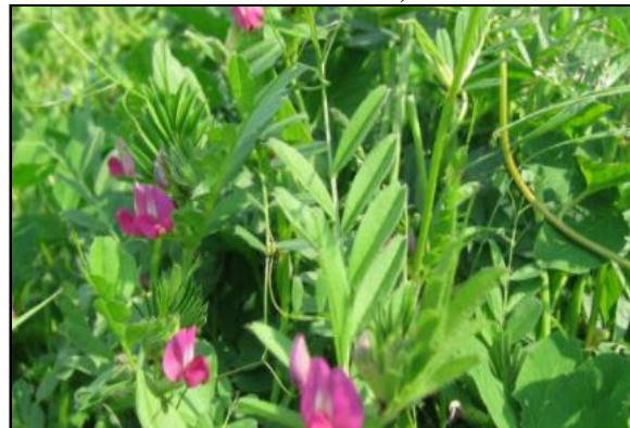
Slika 5. Grahorica