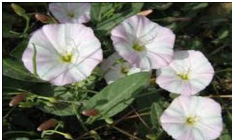
Slika 16. Slak

kojoj odgovara takvo tlo (Slika 16). Slak se redovito susreće na površinama na kojima se redovito provodi oranje.