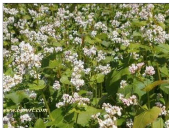
Slika 13. Heljda