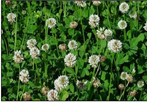
Slika 2. Bijela djetelina