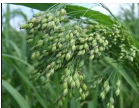
Slika 12. Proso; (Izvor: www.agroklub.com/sortna-lista/zitarice/proso-122 , 31.5.2017.)