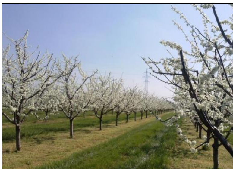
Slika 35. Siderati između redova stabala šljiva na OPG-u Miličić

Održavanje zemljišta u voćnjaku zasigurno zauzima važno mjesto u cjelokupnom procesu uzgoja šljiva. Slavonija je područje u kojem prevladava nedostatak oborina u tijeku vegetacijskog razdoblja biljaka. Kako se u područjima s takvim klimatskim obilježjem primjenjuje uglavnom jalovi ugar kao način održavanja tla u voćnjaku, u OPG-u Miličić započelo se s primjenom tog načina održavanja zemljišta. Jalovi ugar našao je primjenu na ovom OPG-u iz još jednog razloga: naime, voditelj OPG-a upoznat je s činjenicom da jalovi ugar manifestira svoje prednosti samo uz redovit unos organskih gnojiva u tlo.