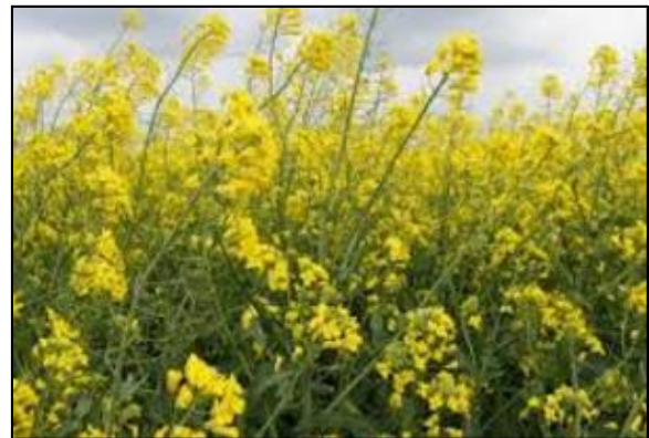
Slika 7. Repica; (Izvor: www.google.hr/search?q=repica&source , 30.5.2017.)