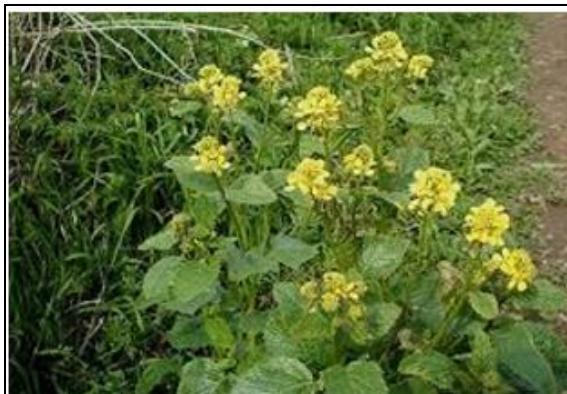
Slika 4. Gorušica