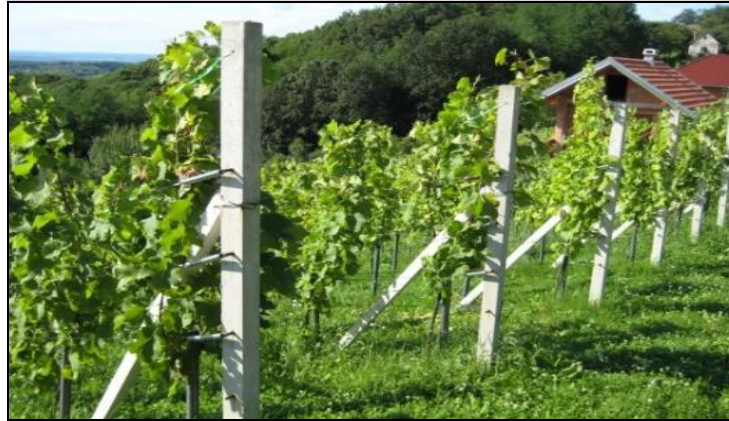
Slika 32. Zatravljeni vinograd

Za zatravljivanje vinograda siju se jednogodišnje, jare ili ozime vrste, vrste koje kličaju, rastu i ugibaju u tijeku jedne godine, ili višegodišnje vrste koje žive tri ili više godina. Te vrste pripadaju u pravilu porodici trava ili porodici lepirnjača. Uz njih se često siju i neke krmne kulture, kao one iz porodice kupusnjača, repe ili facelija. Ponekad se u vinogradu ostavi da prirodna populacija biljaka prekrije tlo, pa se redovitom košnjom stvara prikladan zeleni pokrov. Jednogodišnje se biljke koriste za zatravljivanje radi poboljšanja plodnosti tla u vinogradu, čija struktura i sadržaj organske tvari u tlu nisu zadovoljavajući da bi se moglo obaviti trajno zatravljivanje. Ovo se može smatrati svojevrsnom meliorativnom mjerom kojom se tijekom nekoliko vegetacija, sjetvom i zaoravanjem vrsta utječe na povećanje sadržaja organske tvari u tlu. Kada tlo postigne zadovoljavajuću plodnost, vinograd se može trajno zatraviti i tako očuvati postignuto stanje plodnosti.