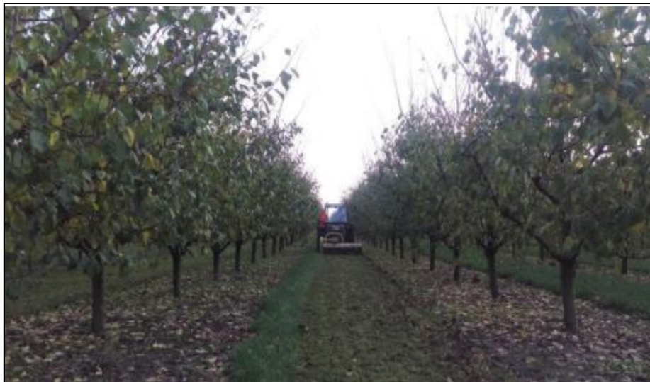
Slika 36. Košnja trave između redova stabala šljiva

Slika 36 prikazuje košnju trave između redova stabala u voćnjaku.