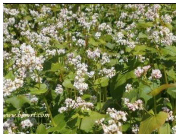
Slika 13. Heljda