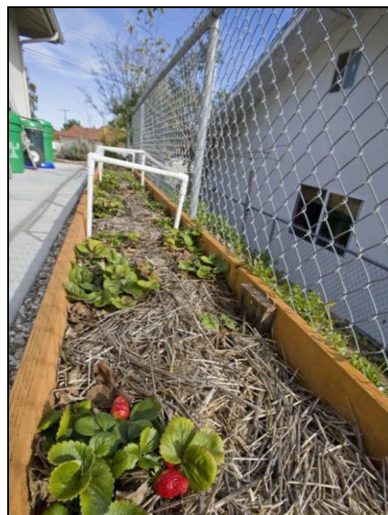
Slika 31. Malčiranje jagoda slamom

Za nanošenje malča na velikim površinama obično se koristi stroj koji siječe i raspršuje slamu preko zasada ( www.agroTV.net/zastitite-jagode-od-golomrazice-malciranjem ).