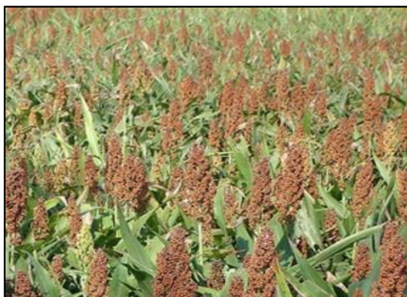
Slika 10. Stočni sirak

Najčešće upotrebljavane pokrovne usjeve prikazuju slike 10 – 13: