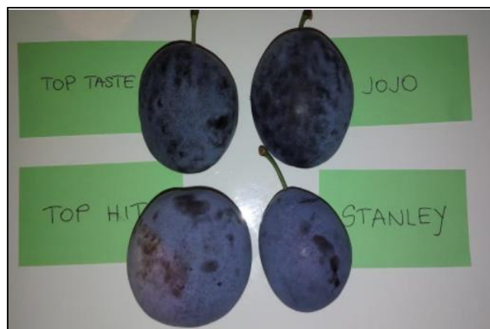
Slika 33. Sorte plave šljive uzgajane na OPG-u Miličić iz Antunovca

U uzgoju šljiva ovo gospodarstvo nastoji pratiti nove tehnologije i suvremene načine uzgoja, a u kontekstu ovoga rada valja istaknuti postupke zatravnjivanja, zelene gnojidbe, koji se na ovom gospodarstvu primjenjuju od 2014. godine. Kako se vlasnik imanja Miličić orijentirao prvenstveno na proizvodnju šljiva, želja mu je stalno unaprjeđivati svoju proizvodnju, pa se, u cilju stjecanja novih i korisnih iskustava, rado upoznaje s novim dostignućima na ovom području poljoprivredne proizvodnje.