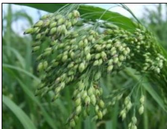
Slika 12. Proso