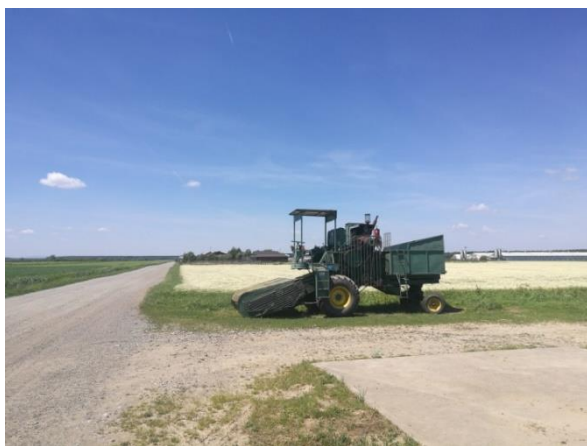
Slika 2. Kombajn ili samohodni berač za žetvu kamilice

U ovom poglavlju je prikazan tehnološki proces žetve i dorade kamilice na OPG-u „Matricaria“ obitelji Tomičić, specijaliziranom za uzgoj kamilice, koje se nalazi uz cestu Đakovo – Osijek, 10 km sjeverno od Đakova, na ulazu u selo Široko Polje. Kamilica se proizvodi na ukupno 50 ha površine (Slika 3), a prosječan prinos je oko 300 kg/ha svježeg cvata.