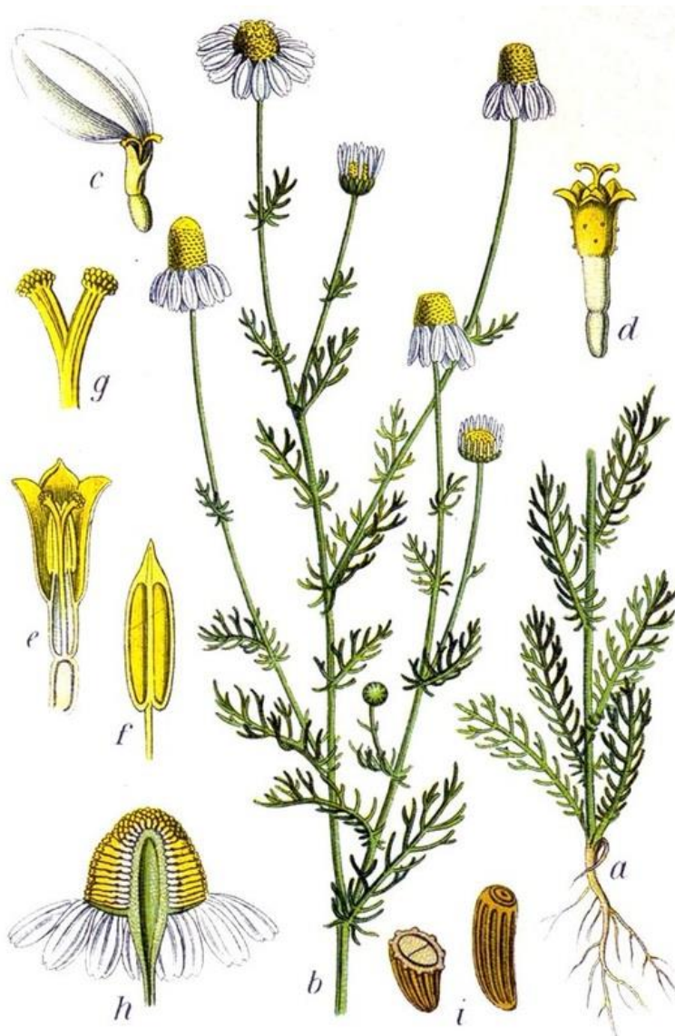
Slika 1. Biljka, cvijet i plod kamilice

Uspješno se uzgaja na svim tlima, osim na vrlo rastresitom vapnenačkom tlu. Na pseudogleju, teškom i nepropusnom tlu postižu se dobri prinosi visokokvalitetnog cvijeta. Sjetva kamilice je ekonomski opravdana na tlima na kojima slabo uspijevaju gotovo sve druge kulture. Kamilica se uzgaja zbog mnoštva ljekovitih spojeva, a najvažniji dio njih se nalazi u eteričnom ulju kamilice (Kolak, 1997.).