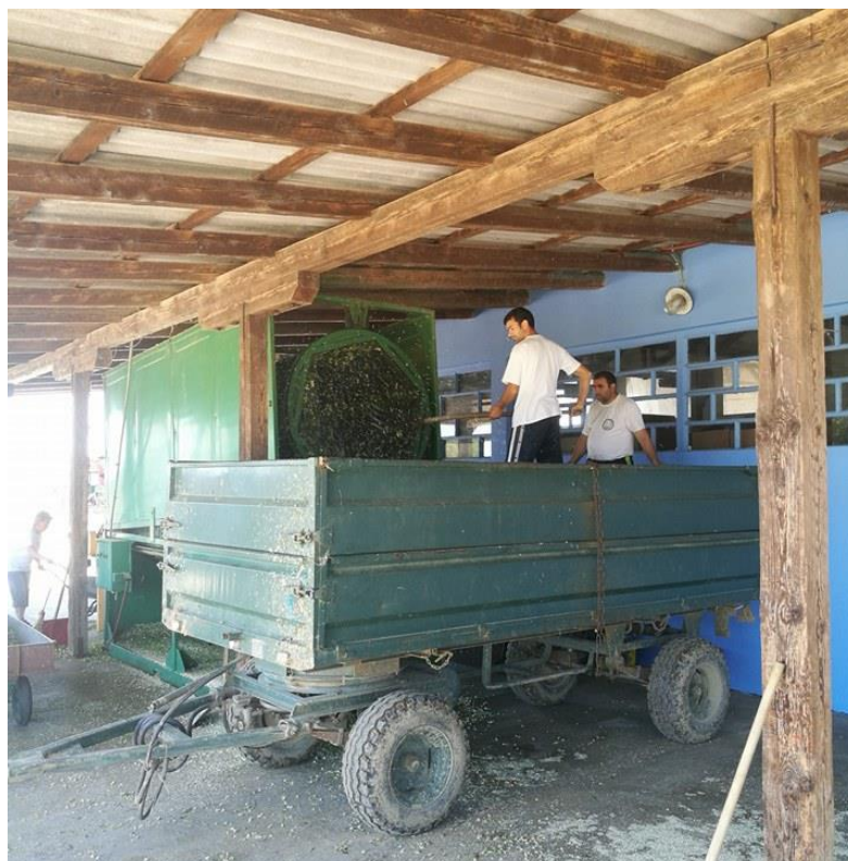
Slika 5. Utovar ubrane mase u separator