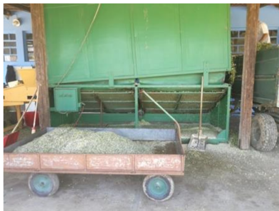
Slika 9. Frakcija A (2.klasa) (Foto original)