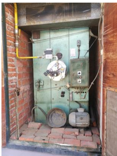
Slika 10. Upravljačka ploča sušnice

Sušenje se vrši u sušarama za duhan (Slika 10 i 11). U ovom slučaju riječ je o pet trokanalnih podnih sušara. Pod je građen od perforiranih limenih dasaka. Površina mu je 32 m 2 . Zidovi su visoki 4 m, a na stropu je otvor za zrak. Ispod poda su tri betonirana kanala, međusobno odijeljena dvama betonskim zidovima visine 0,4 m. Prostor između dna kanala i limenog poda je također visine 0,4 metra. U taj međuprostor ventilator pokretan elektromotorom upuhuje okolni zrak. Ukoliko je ložište uključeno taj zrak se zagrijava do temperature određene termostatom kojeg regulira čovjek. Tada zrak ima nisku relativnu vlagu i visoki kapacitet za primanje vode. Zagrijani se zrak pravilno raspoređuje u trima kanalima i zatim kreće prema otvoru za zrak na stropu sušare (Katić, 1997.).