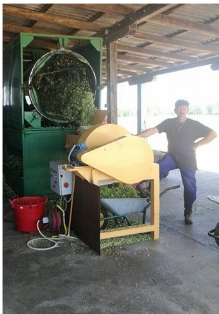
Slika 8. Frakcija C (otpad) (Foto original)

Pri tome 40–50% glavica propada kroz otvore po cijeloj dužini bubnja. Rotirajuće cijevi smještene ispod bubnja provode glavice na limeni pod, odakle ih radnici transportiraju na sušenje (frakcija B – 1. klasa; slika 7). Latice i vrlo sitne glavice propadaju između cijevi i predstavljaju otpad koji se može, ali i ne mora baciti (frakcija C; slika 7.). Kod separatora bez rotirajućih cijevi dolazi do dodatnih postupaka u kasnijoj doradi. Glavnina ubrane mase sa preko 50 % glavica izlazi iz bubnja i zatim se transportira na sušenje (frakcija A – 2. klasa; slika 8.).