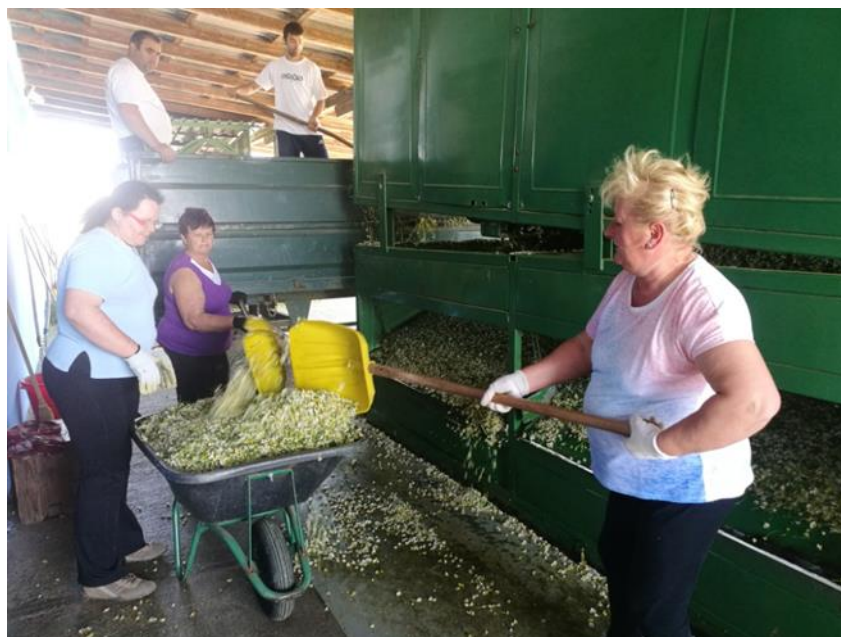
Slika 7. Transport 1.klase na sušenje (Foto original)

Bubanj ima perforirane stijenke – otvori su 2 cm u promjeru – te blagi pad (8 %). Zbog pada i rotacije bubnja, masa prolazi kroz bubanj od ulaza prema izlazu.