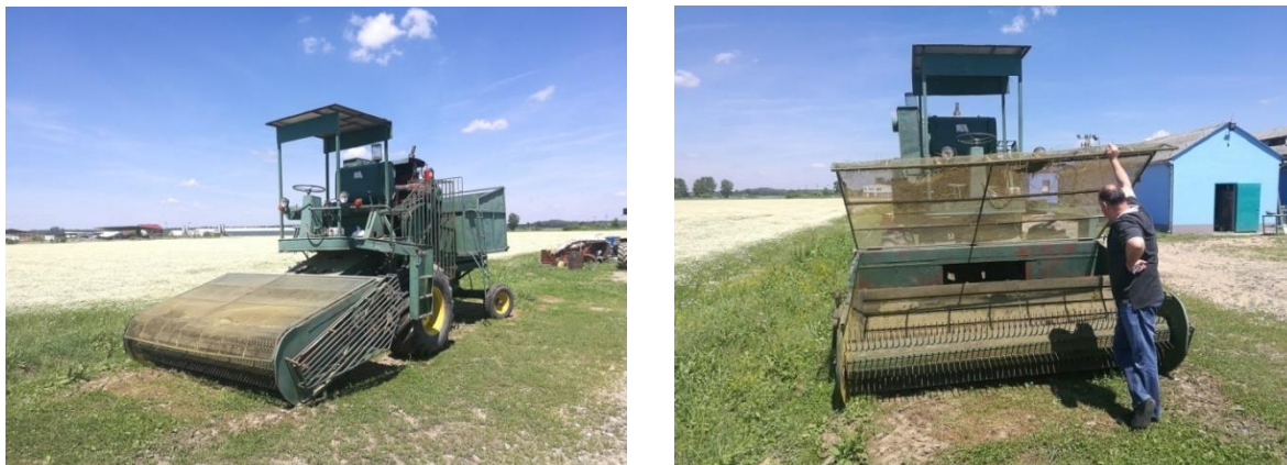
Slika 4. Samohodni berač kamilice (detaljan prikaz) ( Foto original )

Žetva kamilice se obavlja beračem kamilice ili kombajnom tj. samohodnim strojem koji je sličan žitnom kombajnu (Slika 4). Postoje i berači vučeni traktorom, a na manjoj površini u obzir može doći i ručna berba. Ona se vrši rukama ili posebnim češljevima, a prednost joj je što se tako ubiru isključivo glavice, bez imalo zelene mase, dok su mane sporost u radu i troškovi ljudskog rada.