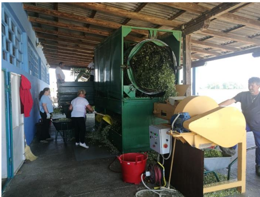
Slika 6. Separator (Foto original)