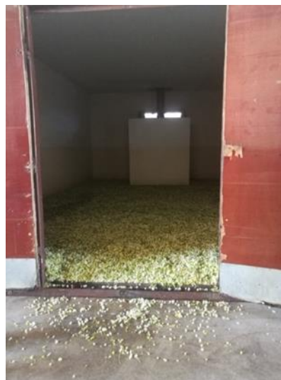
Slika 11. Sušnica