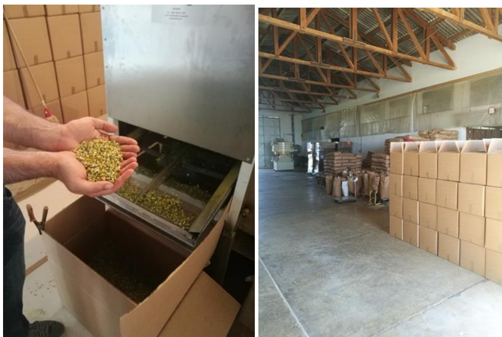
Slika 12. i 13. Pakiranje 1. klase