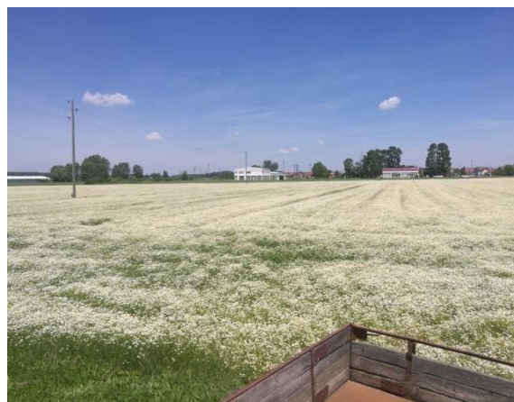
Slika 3. Proizvodne površine

Osim toga, tu je i osvrt na druge varijante žetve i dorade temeljene na literaturnim izvorima i spoznajama iz prakse drugih proizvođača.