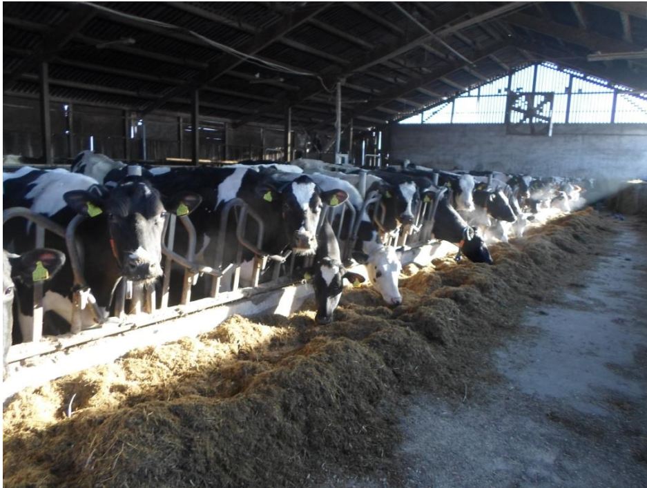
Slika 2. Unutrašnjost lauf staje.

Najveći prostor čine boksovi koji su međusobno odvojeni visećim pregradama i blatni hodnik. Svaka krava ima svoj boks u kojem se nalazi za vrijeme odmora. Krave se slobodno kreću blatnim hodnikom, same odlaze do hrane i vode, te u izmuzište. Na jednom dijelu nalazi se rešetkasti pod, tako da se izmet i otpadne vode automatski u podzemni kanal, te u sabirnu jamu. Drugi dio je puni pod koji se dva puta dnevno čisti traktorom. Temelji staje su betonski, zidovi od opeke, te krov pokriven salomit pločama.