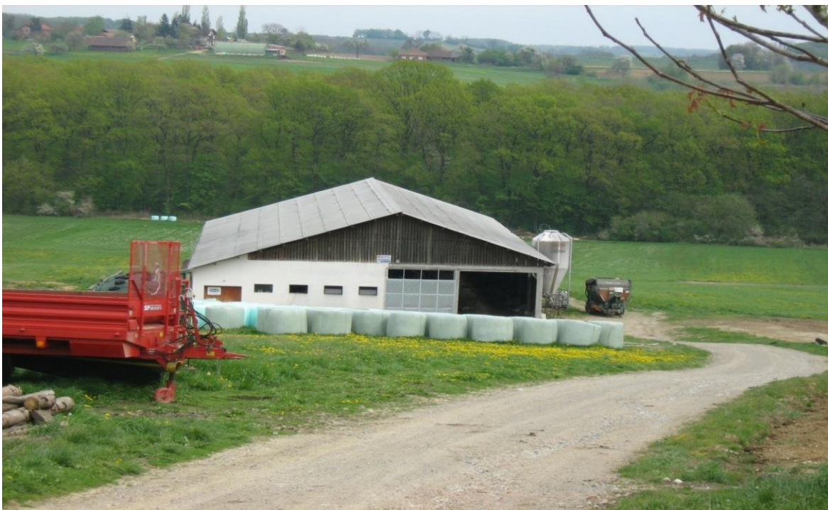
Slika 1. Lauf staja za mliječne krave

2002. godine počinje izgradnja suvremene lauf staje za mliječne krave. Farma je kapaciteta 50 muznih krava, površine 655 m 2 .