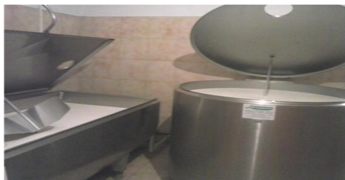
Slika 5. Laktofrizi na OPG