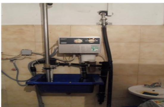
Slika 4. Postrojenje za pranje izmuzišta

Higijena je besprijekorna, što se na poslijetku odražava na kvaliteti mlijeka. Sva potrebna oprema prilikom mužnje pere se i dezinficira automatski dva puta dnevno. Nakon što cisterna odveze mlijeko laktofrizi se peru i dezinficiraju. Laktofrizi su kapaciteta 2400 litara.