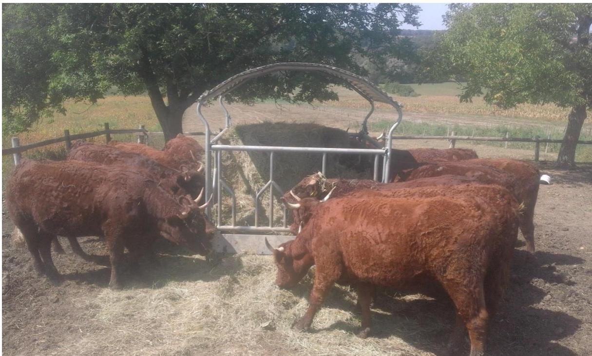
Slika 6. Salers goveda

Junice su osjemenjene prirodnim pripustom i nalaze se u sustavu krava tele na površini od 3 ha pašnjaka. Zbog male površine pašnjaka junicama se kao dopuna obroku daje livadno sijeno u hranilicu.