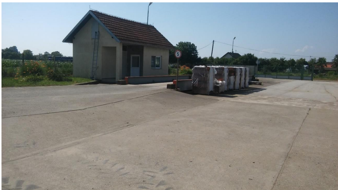
Slika 3. 50-tonsaka vaga