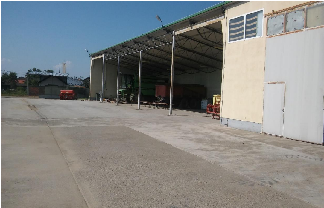
Slika 1. Dio mehanizacije u garažnom prostoru,

Svi strojevi i poljoprivredna mehanizacija relativno su novijeg datuma i u vrlo dobrom stanju, tako vlasnik farme nema značajnih problema oko nekih većih kvarova i popravaka. Uglavnom se obavlja redovito tehničko održavanje, te se strojevima i priključnim oruđem upravlja u manirima dobrog gospodarstva.