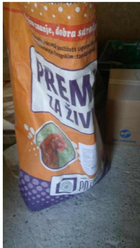
Slika 12. Premik koji se trenutno koristi na farmi