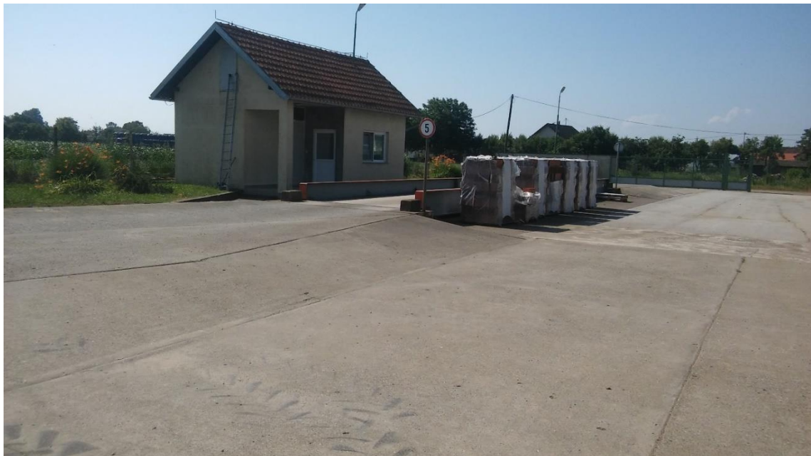
Slika 3. 50-tonsaka vaga