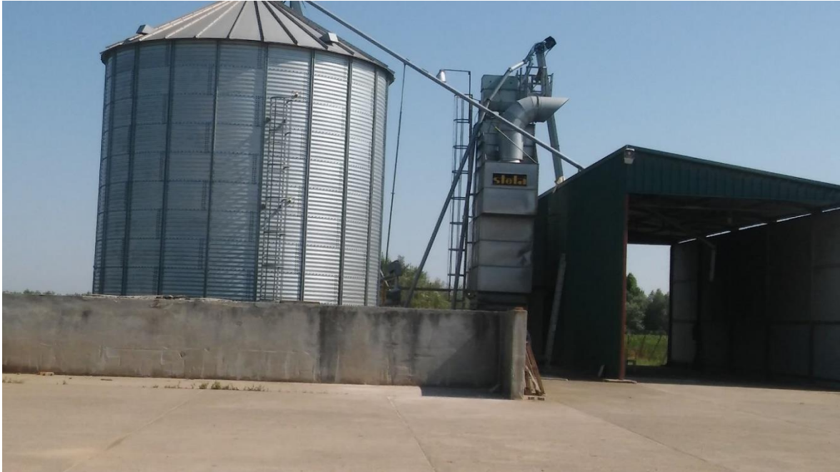
Slika 2. Silos za spremanje hrane