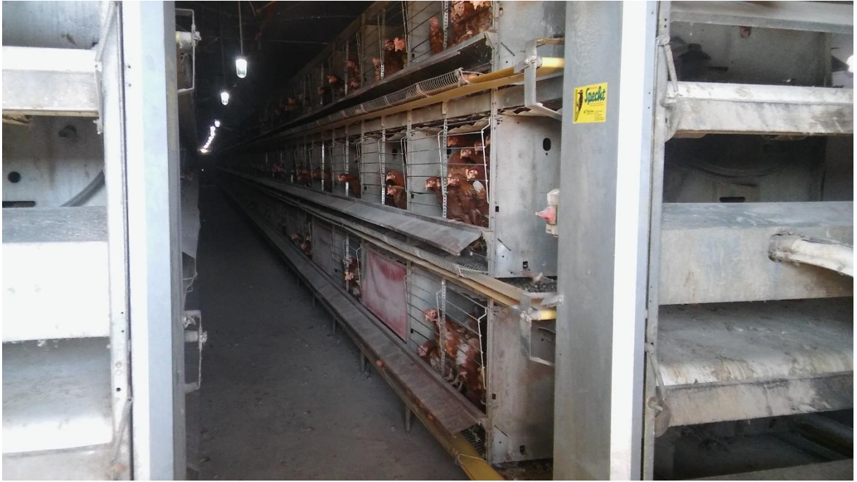
Slika 5. „Salmet“ kavezi