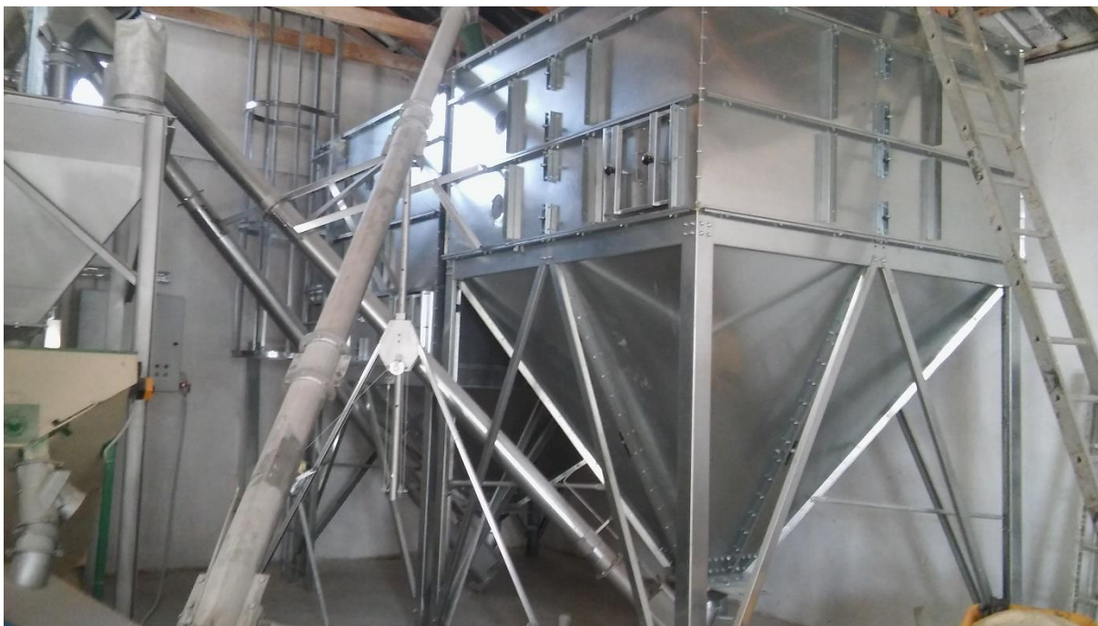
Slika 10. Mješaona stočne hrane