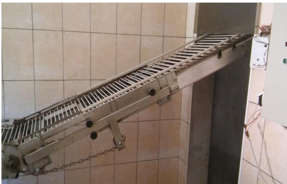
Slika 7. „Lift za jaja“

Na ovoj farmi se dnevno skupi od 4500 – 5000 jaja.