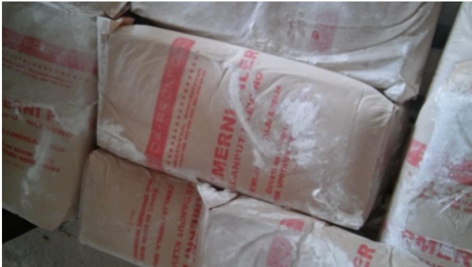
Slika 11. Dodaci stočnoj hrani