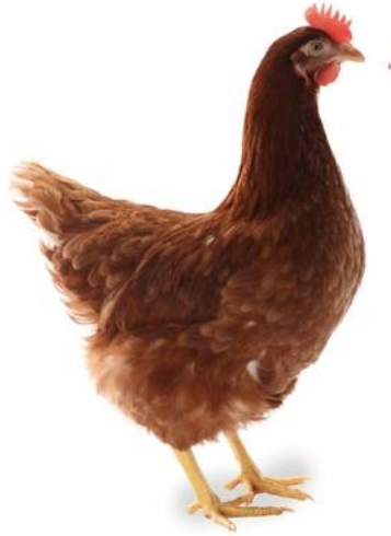
Slika 4. Hibrid Lohmann Brown