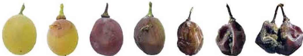
Slika 8. Faze sive plijesni na bobama.

Od mjesta infekcije gljiva napreduje u zaražnoj bobi oko 3-4 mm dnevno, a na pokožici se mijenja boja u segmentima, a dok na kraju čitava bobu ne poprime svijetlosmeđu boju, (Maceljski i sur., 2006.). Nakon kraćeg ili duljeg vremena na bobama se pojavljuje paučinasta prevlaka sive boje. U povoljnim uvjetima vlažne i pro hladne jeseni bolest se brzo širi od jedne bobu na drugu i tako zahvati veći dio grozda ili cijeli grozd. Protrese li se zaraženi grozd, odvajaju se brojne konidije u obliku sivkaste prašine, (Maceljski i sur., 2006.). U nekim sortama, kao što su: rajnski rizling, moslavac i silvanac, u jesen se uz napade na bobu razvija i napad na peteljčice bobu, zbog čega bobu otpadaju s grozda. Bobu koje padnu na tlo izgubljene su jer strunu za dan-dva pa su štete time veće.