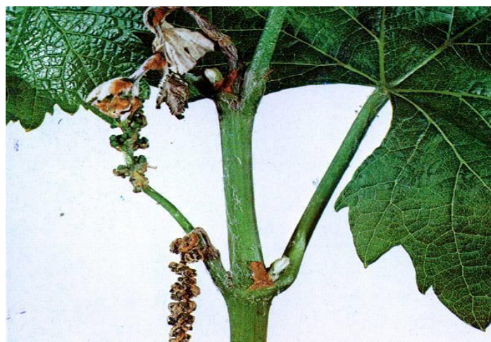
Slika 7. Simptomi botrytisa na mladicama vinove loze.

Na zelenim s mladicama javlja vodenasta, meka i smeđa trulež. Trulež dovodi do pucanja i odumiranja, a u jesen se mogu pojaviti crne mrlje veličine od 1 do 5 mm zbog ranih mrazova.