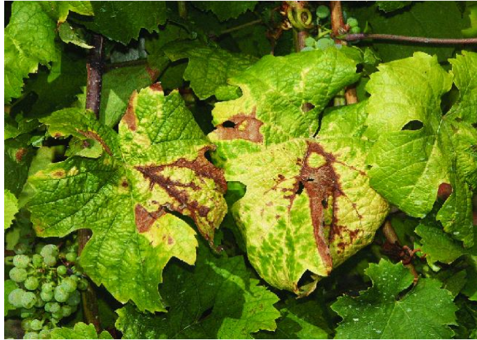
Slika 6. Simptomi botrytisa na listovima.