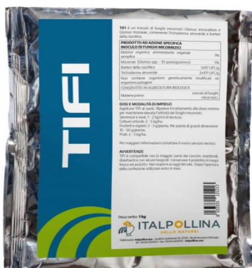
Slika 1. Prikaz TIFI Mikropraha Trichoderma

sjemena i formiraju zaštitni sloj na tretiranom sjemenu, te takvo sjeme puno bolje podnosi nepovoljne uvjete. Biološko tretiranje sjemena prahom koji je pripremljen na bazi gljivice roda Trichoderma može reducirati određenu količinu prethodno apliciranih bioloških agensa koji su aplicirani na sjeme. Osim tretiranja samog sjemena efikasnim se pokazivalo i tretiranje korijena. Najefikasnija primjena pripravaka na bazi vrsta roda Trichoderma , kada je u pitanju zaštita usjeva od bolesti, upravo je apliciranje u samo tlo. Nakon što se aplicira u samo tlo, gljivice roda Trichoderma velikom brzinom koloniziraju tlo, te samim time ovaj postupak nije potrebno ponavljati često.