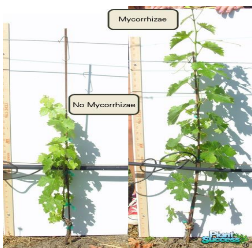
Slika 4. Razlika u razvoju između mikorizirane i nemikorizirane sadnice vinove loze.