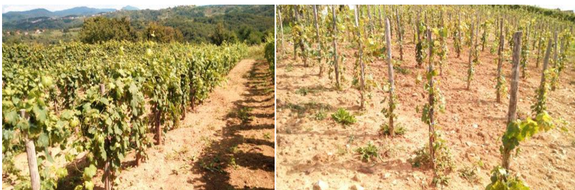
Slika 3. Razlika u razvoju između mikoriziranog i nemikoriziranog nasada vinove loze