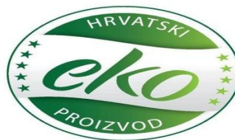
Slika 9. Europski znak za eko proizvod i hrvatski znak za eko proizvod.