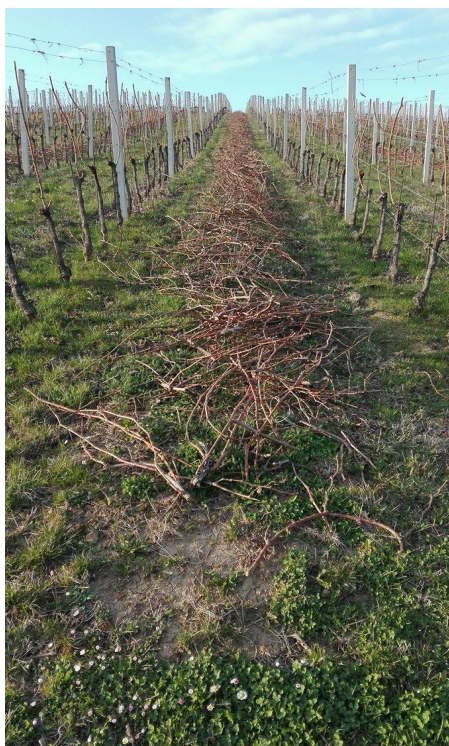
Slika 9. Rezidba