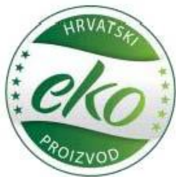
Slika 9. Hrvatski znak za eko proizvod