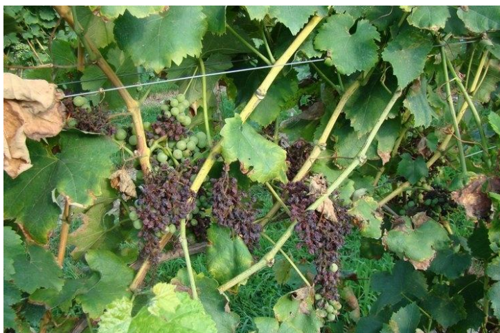
Slika 3. Simptomi plamenjače