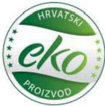
Slika 9. Hrvatski znak za eko proizvod