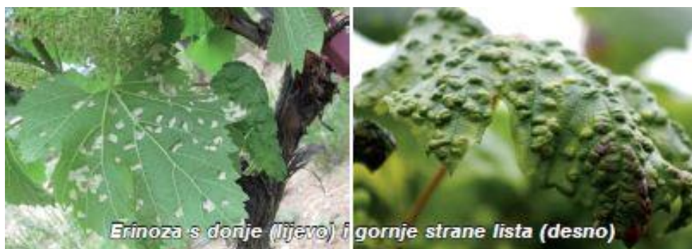
Slika 7. Simptomi erinoze