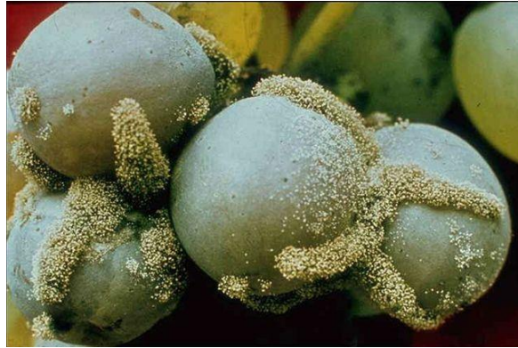
Slika 4. Simptom sive plijesni na bobicama