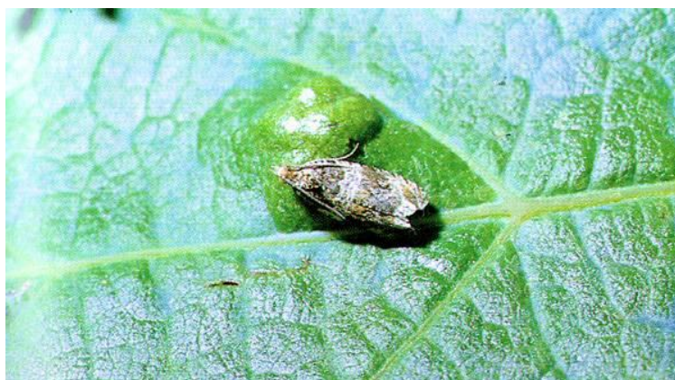
Slika 6. Pepeljasti grozdov moljac

Pepeljasti moljac je povremeni - periodički štetnik kod nas. Naglo se javlja, godinu - dvije, a rjeđe tri, i naglo, sam od sebe, iščezava. Jačina napada i veličina štete zavisi od meteoroloških prilika. U pojedinim godinama i 50-70% berbe biva uništeno od ovog štetnika (Brmež i sur., 2010.).