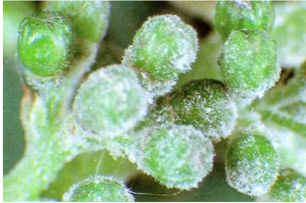
Slika 2. Simptom pepelnice na bobicama