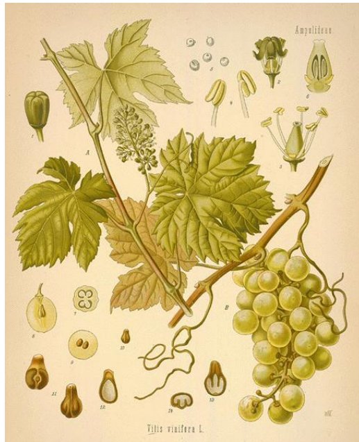
Slika 1. Vegetativni i generativni organi vinove loze