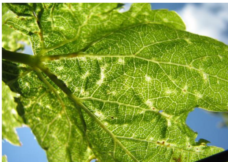
Slika 8. Simptomi akarinoze

Calepitrimerus vitis duga je 0,2 mm, a prezimljuje ispod kore i ljuske pupa. Oštećuje zeleni pup i izboje, a zadržavaju se i na lišću (zvjezdolika mjesta uboda). Izboji atrofiraju, internodiji se skraćuju, a grozdovi zakržljaju. Aktivna je od travnja do listopada, a glavne štete pričinja u rano proljeće. Veće štete čini u hladnija proljeća.