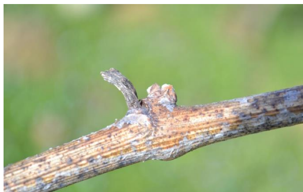
Slika 5. Crna pjegavost na odrvenjeloj mladici

Na odrvenjeloj rozgvi tijekom zime dolazi do “izbjeljivanja” vanjskog dijela kore, a do proljeća na njoj se pojavljuju crne točkice – plodišta sa sporama. Spore raznose vjetar i kiša. Na zaraženom trsu lisni pupovi se ne otvaraju istovremeno, a neki uopće ne prolistaju, što utječe na prinos (Brmež i sur., 2010.).