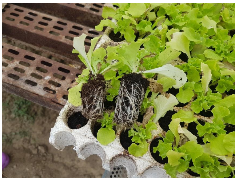
Slika 5. Proizvodnja rasada u saćima od stiropora.

Rasad se može proizvoditi i u plastičnim saćima ili u saćima od stiropora (Slika 5). Na taj način omogućavamo veliku uštedu u potrošnji supstrata. (Parađiković 2002.).