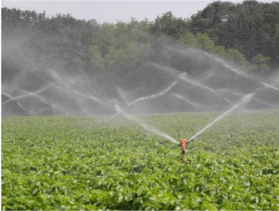
Slika 7. Navodnjavanje kišenjem