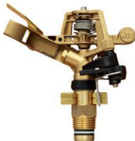
Slika 8. Rasprskivač

Rasprskivači ne mogu proizvesti potpuno ravnomjernu raspodjelu vode po cijeloj kišenoj površini. Da bi se postigla ujednačenija raspodjela vode, rasprskivači moraju biti postavljeni dovoljno blizu jedan drugome da bi se njihovi oblici raspodjele preklapali, jer često veća količina vode pada u blizini rasprskivača, a smanjuje se prema rubovima. Fiksno postavljeni rasprskivači se obično postavljaju po trokutnoj, pravokutnoj ili kvadratnoj mreži. (Lešić i sur. 2002.).