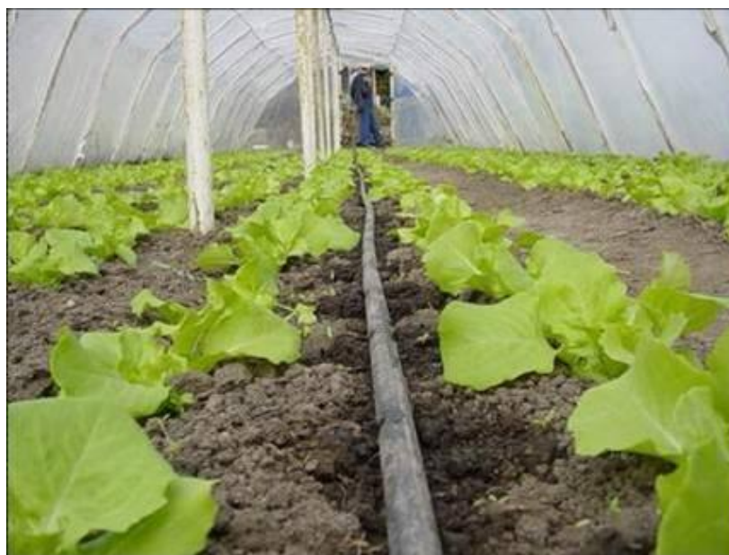
Slika 9. Primjena lokaliziranog navodnjavanja „kap po kap“

Karakterizira ga kapaljka kao mjesto na kojem se reducira radni tlak iz cijevi i u obliku kapljice ispušta vodu na ili u tlo (Slika 9). Razlikujemo dvije vrste navodnjavanja kapanjem: površinsko (cijevi i kapaljke su postavljene iznad površine tla) i potpovršinsko (ukopane u tlo).