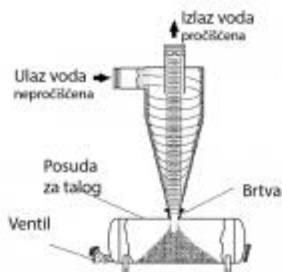
Slika 10. Hidrociklički filtar

Dobrim kapaljkama se smatraju one kapaljke koje osiguravaju mali ujednačeni tok vode ili kapanje s konstantnim istekom, koji znatno ne varira na površini pod sustavom. Proizvedeno je više tipova kapaljki, a karakteristike su im da su pouzdane, da osiguravaju ujednačen istek i da nisu skupe (Slika 11). Neki od osnovnih tipova kapaljki su: kapaljke s laminarnim tokom vode (mikrocijevi), kapaljke s turbulentnim tokom (labirinti), kompenzirajuće kapaljke ili kapaljke s izjednačavanjem tlaka, samoispirajuće kapaljke. S obzirom na mjesto instaliranja kapaljki na lateralnim cijevima razlikujemo: kapaljke ugrađene u cijev, na njih, i kapaljke dodane ili postavljene na cijev. (Lešič i sur. 2002.).