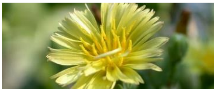
Slika 3. Cvat salate

Lišće je sjedeće, nazubljeno, ovalno ili okruglo, ovisno o sorti. Cvjetno stablo je razgranato a na vrhu grana nalaze se glavičaste cvati sa žutim cvjetovima (Slika 3). Jednosjemni plod je roška (adhenij) s papusom (Slika 4). Salata je većinom samooplodna ali ju posjećuju i kukci pa može doći i do stranooplodnje. Sjeme za sjetvu je sitno, a klijavost zadržava 4 do 5 godina. (Parađiković, 2002.), (Lešić i sur. 2002.), http://pinova.hr/hr_HR/baza-znanja/povrcarstvo/salata/morfoloska-svojstva-salate (14.03.2018, 16:57).