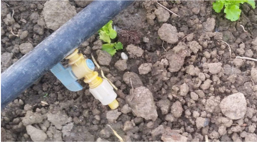
Slika 11. Kapaljka