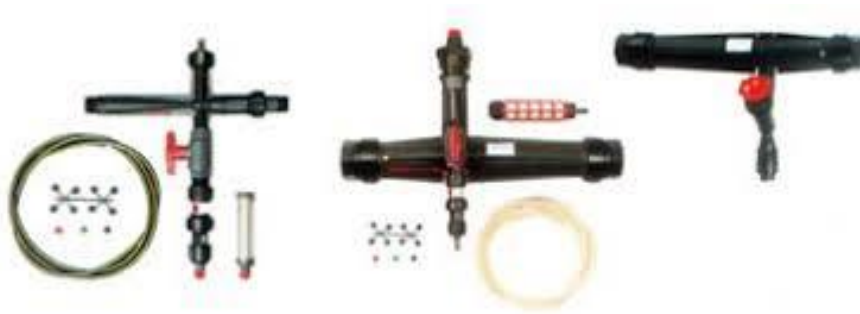
Slika 12. Različiti tipovi injektora