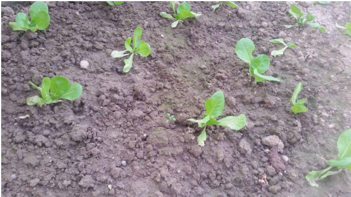
Slika 13. Salata nakon presađivanja u platenik (8. listopada 2017.)