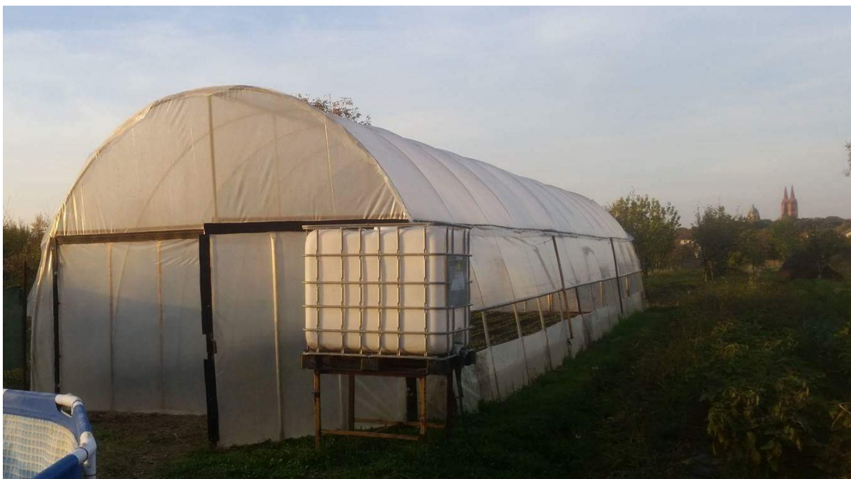
Slika 6. Uzgoj salate u plasteniku – OPG Grubeša Ankica - Đakovo.

Salata se lako i uspješno uzgaja u staklenicima i plastenicima (Slika 6). U negrijanim zaštićenim prostorima, razdoblje od njezine sadnje do berbe se znatno produžuje i zimi može iznositi više od 100 dana, što znači da tokom cijele zime možemo proizvesti samo jedan turnus salate. U zatvorenim prostorima koje grijemo moguće je salatu proizvoditi kontinuirano. U takvim prostorima salati je potrebno 40 do 50 dana. (Parađiković 2002.), https://www.savjetodavna.org/Savjeti/Proizvodnja%20salate%20u%20zasticenom%20prostoru.pdf (16.3.2018.,19:15)