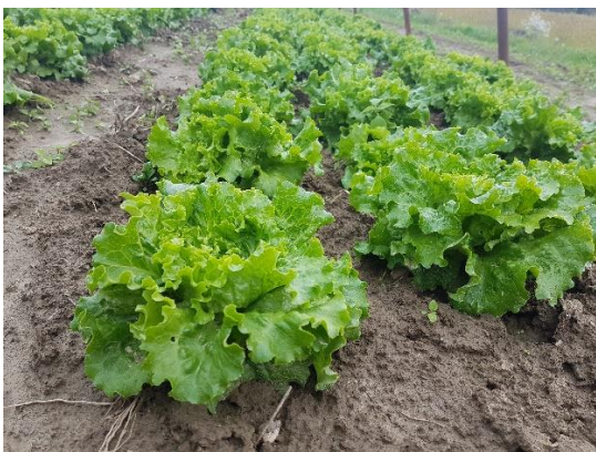
Slika 1. Salata kristalka

Razlikujemo dva tipa: kristalke (Slika 1) i puterice (Slika 2). Razlikuju se po tome što kristalke imaju jače nazubljene rubove listova, dok puterice imaju nježne listove, ravnog lisnog obruba. (Parađiković, 2002.).