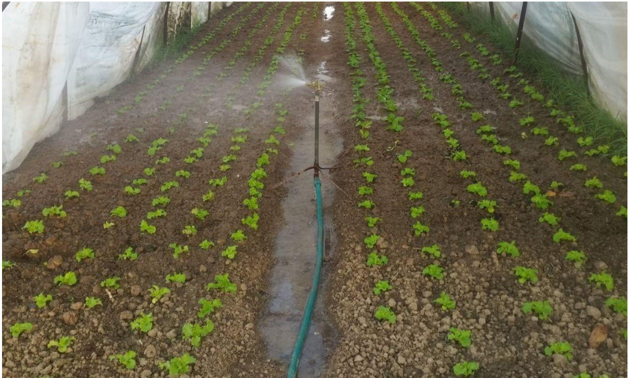
Slika 14. Navodnjavanje salate sustavom kišenja.