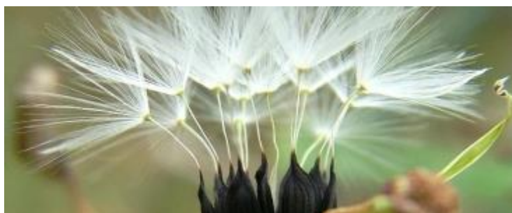
Slika 4. Plod salate, roška sa papusom