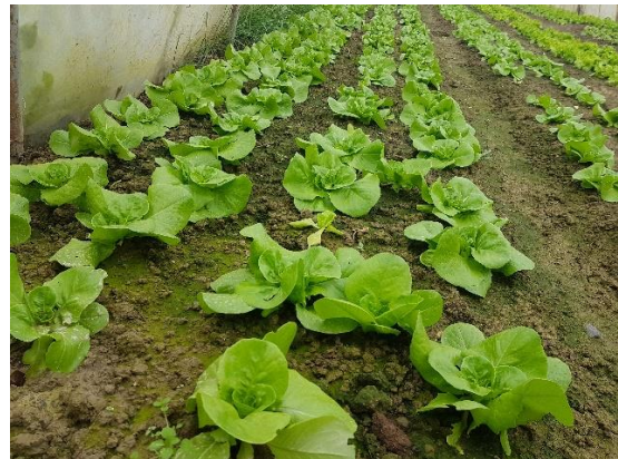
Slika 2. Salata puterica