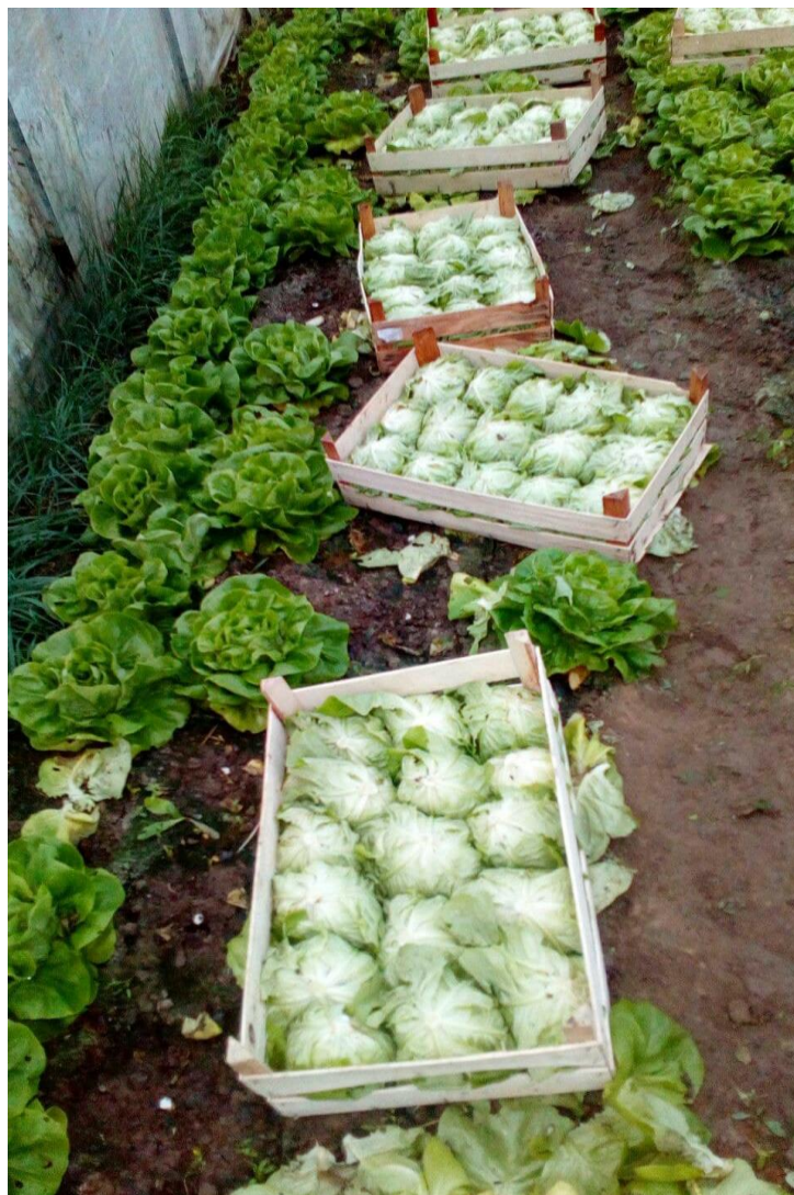
Slika 15. Berba salate (22. prosinac 2017.)

Poslije salate tlo se „odmara“ do proljetne sjetve rajčice.