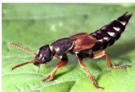
Slika 6. Kusokrilac, D. coriaria.