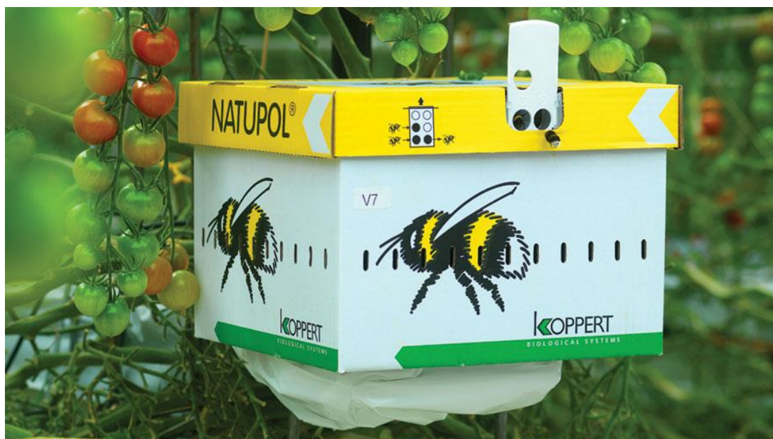
Slika 2. Natupol bumbarške košnice tvrtke Koppert (Foto:

Nizozemska tvrtka Koppert također u ponudi ima košnice bumbara pod nazivom "Natupol", a imaju distributera za Hrvatsku pa ih je moguće jednostavno nabaviti i kod nas (Natupol, 2018.).