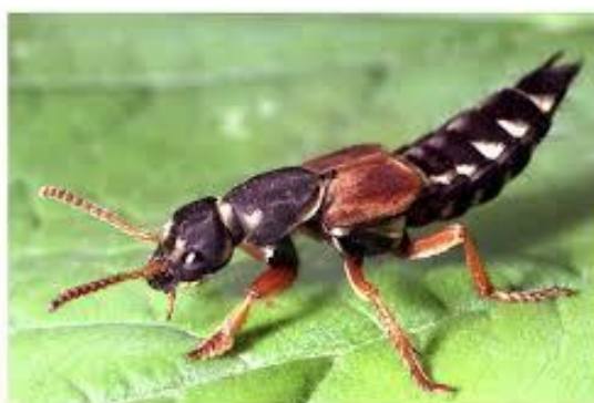
Slika 6. Kusokrilac, D. coriaria.