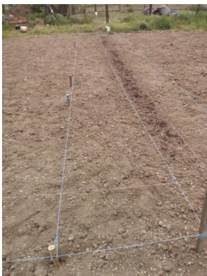
Slika 21. Priprema pokusne parcele (fotografija: Ilić, S., 2018.)