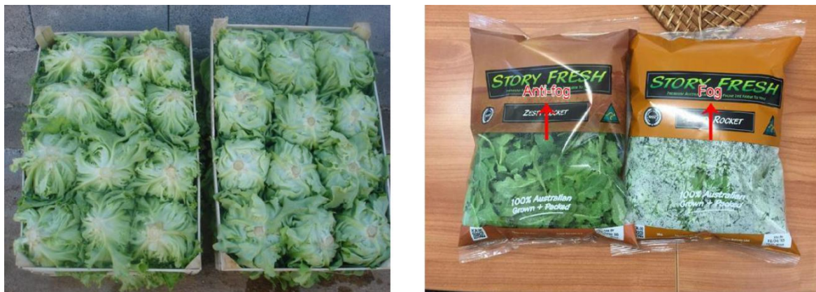
Slika 15. Pakiranje salate u drvene sanduke (lijevo) i u vrećice za prodajne centre (desno)