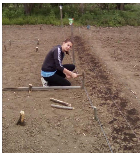
Slika 22. Priprema pokusne parcele

Presadnice obje sorte salate (slika 23.) presađene su 7. svibnja 2018. godine na pokusnu parcelu (slika 25.) veličine 121 \text{ m}^2 . Veličina osnovne parcele čimbenika a (navodnjavanje) bila je 9 \text{ m}^2 , a čimbenika b (sorta salate) bila je 3 \text{ m}^2 . Razmak biljaka unutar reda bio je 30 cm, a razmak između redova bio je 40 cm (slika 24.). Kako ne bi došlo do preklapanja tretmana navodnjavanja u istraživanju određen je razmak između parcela od 1 m.