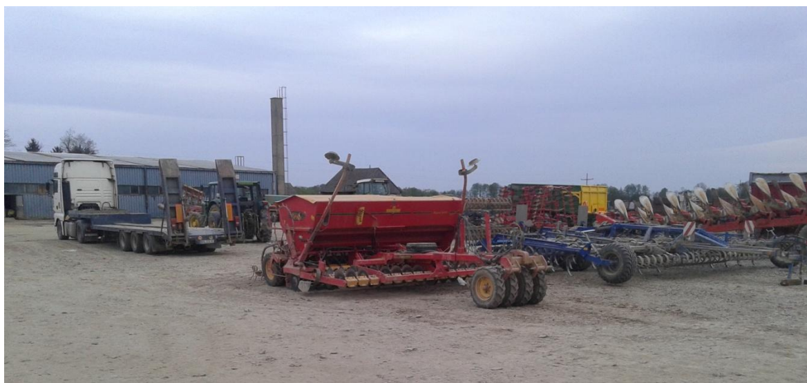
Slika 22. Sijačica „Vaderstadt“ 4m