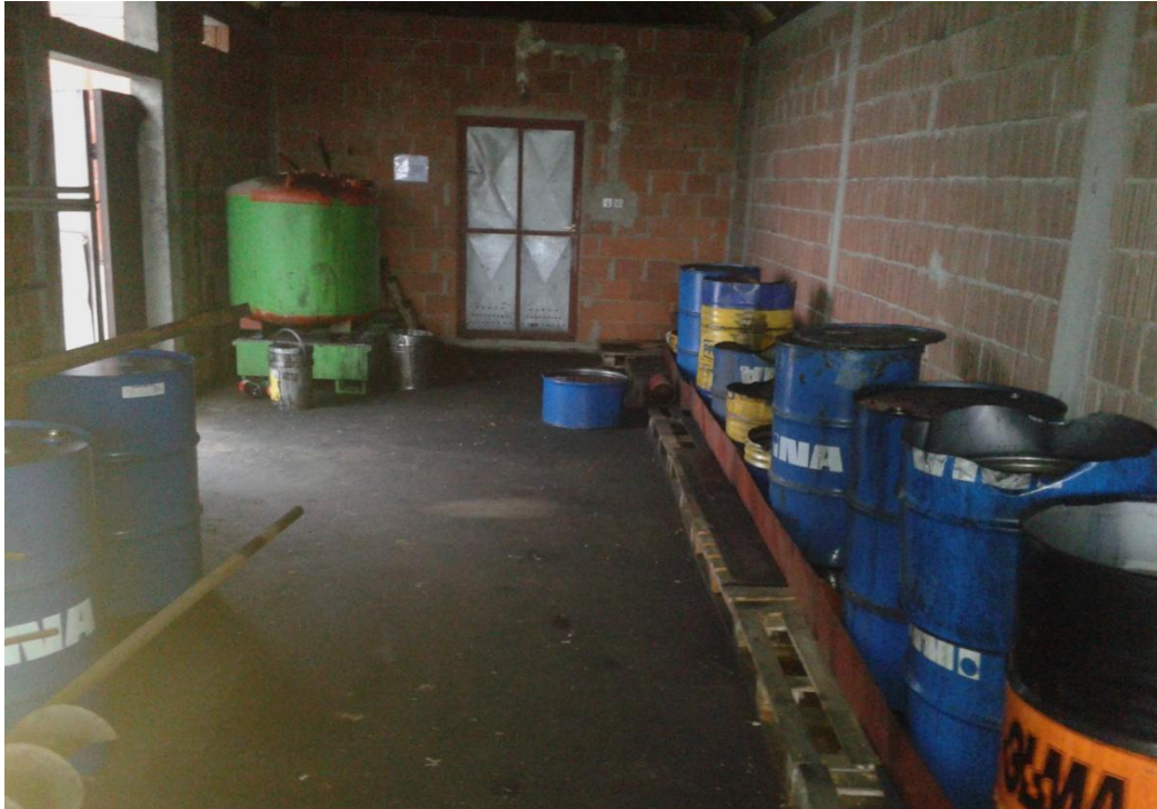
Slika 35. Bačve za zauljne krpe i pročistače