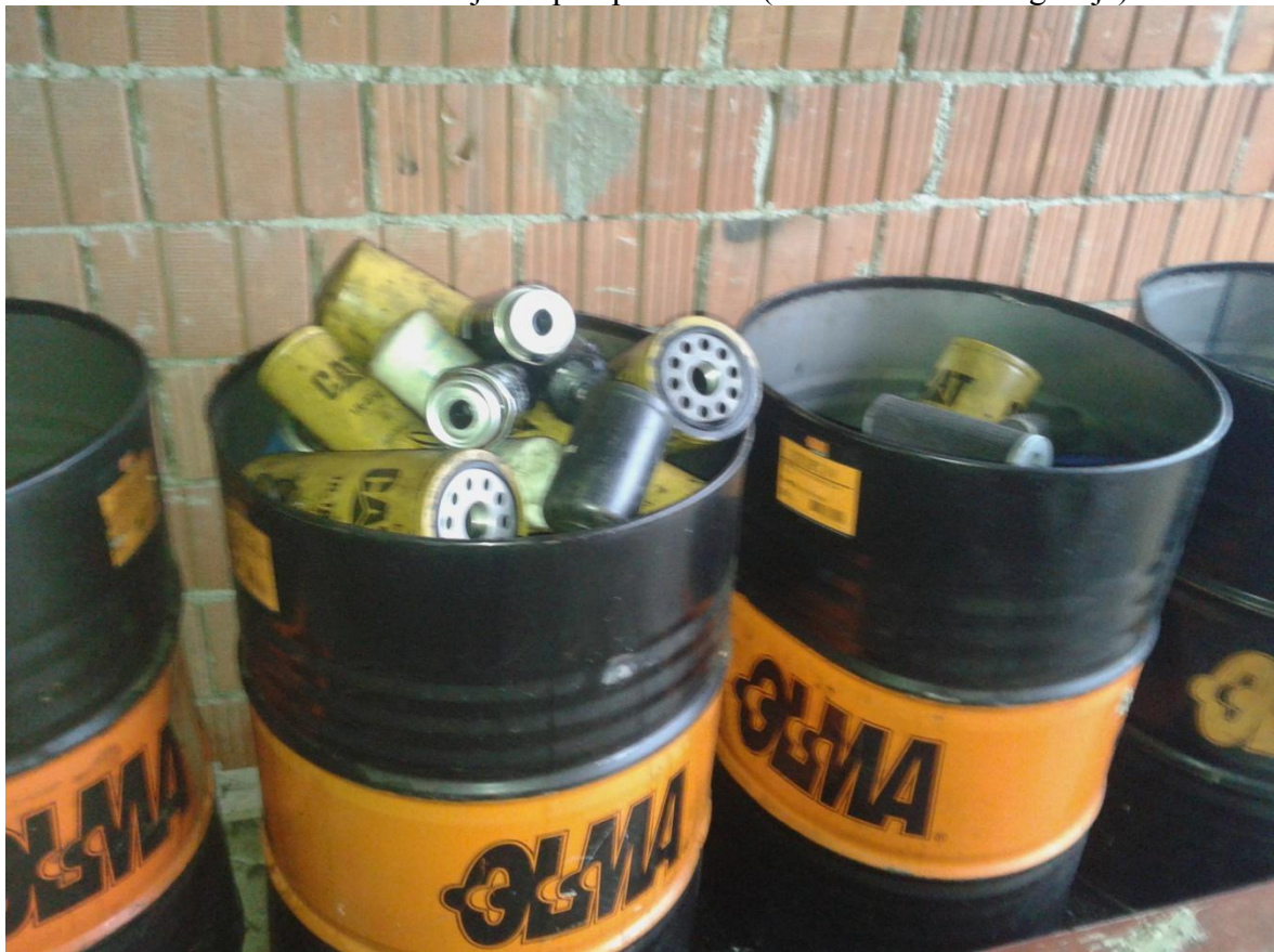
Slika 36. Rabljeni pročistači za ulje