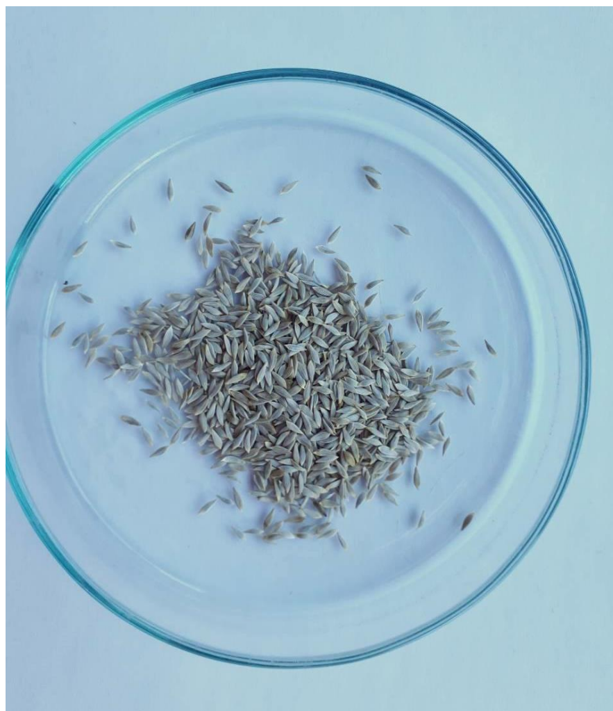
Slika 2. Sjeme salate korišteno u pokusu

Vodeni ekstrakti pripremljeni su od suhe biljne mase stabljike i lista strjeličaste grbice prema metodi Norsworthy (2003.). Ukopno 50 g sušene biljne mase stabljike odnosno lista potopljeno je u 1000 ml destilirane vode te su tako pripremljene smjese koje su stajale 24 sata na temperaturi od 22 ( \pm 2) °C. Smjese su zatim procijeđene kroz muslinsko platno kako bi se uklonile grube čestice. Nakon toga filtriranjem kroz filter papir dobiveni su ekstrakti stabljike i lista u koncentraciji od 5%. Ekstrakti su čuvani u staklenim bočicama u hladnjaku na temperaturi od 4°C do početka pokusa.