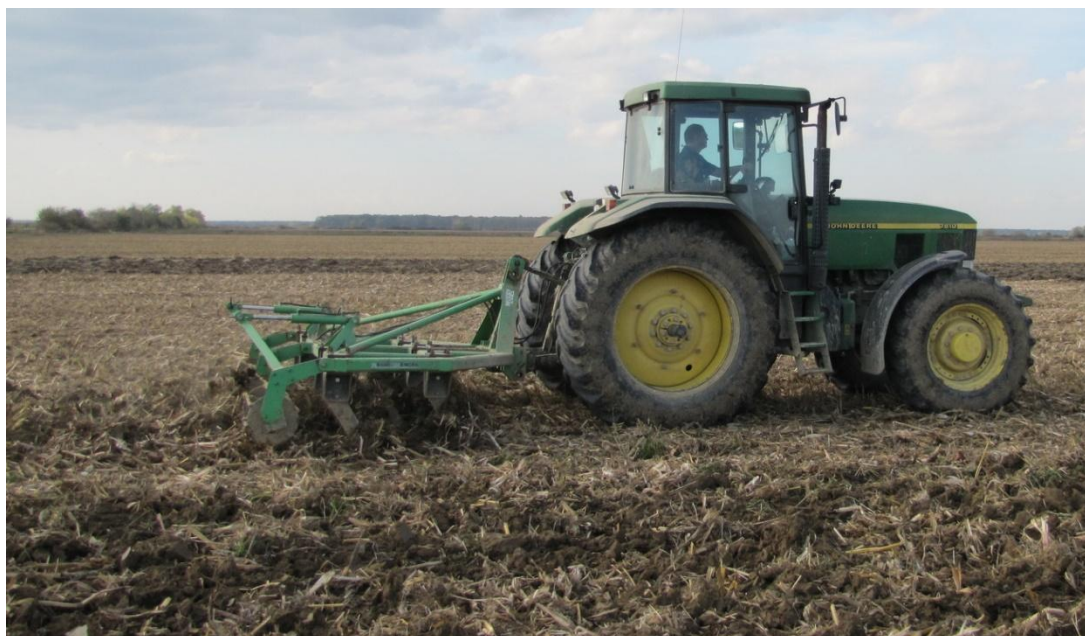
Slika 3. Podrivanje na dubini od 45 do 50 cm

2. SS – podrivanje – konzervacijska obrada tla (podrivanje do dubine 45-50 cm), (Slika 3.)