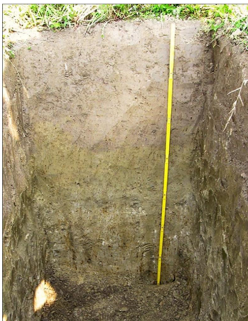
Slika 1. Profil tla na istraživanom lokalitetu

Istraživanjima je obuhvaćeno pet sustava obrade tla i tri razine gnojidbe dušikom. Sustavi obrade tla bili su slijedeći: