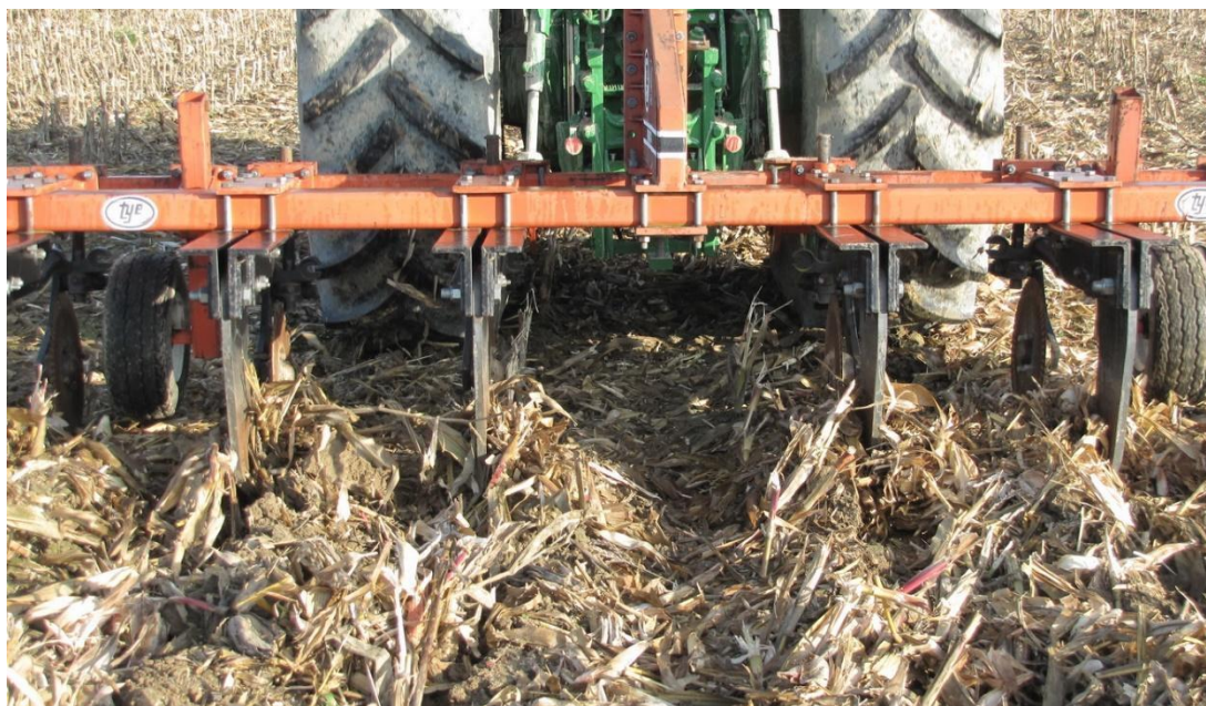
Slika 4. Rahljenje na dubini od 30 do 35 cm

3. CH – rahljenje – konzervacijska obrada (rahljenje do dubine 30-35 cm), (Slika 4.)