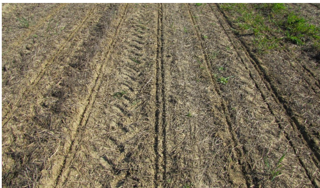
Slika 6. Direktna sjetva kukuruza u žetvene ostatke (Autor: D. Jug)

5. NT – direktna sjetva – konzervacijska obrada (bez ijednog zahvata obrade tla), (Slika 6.)