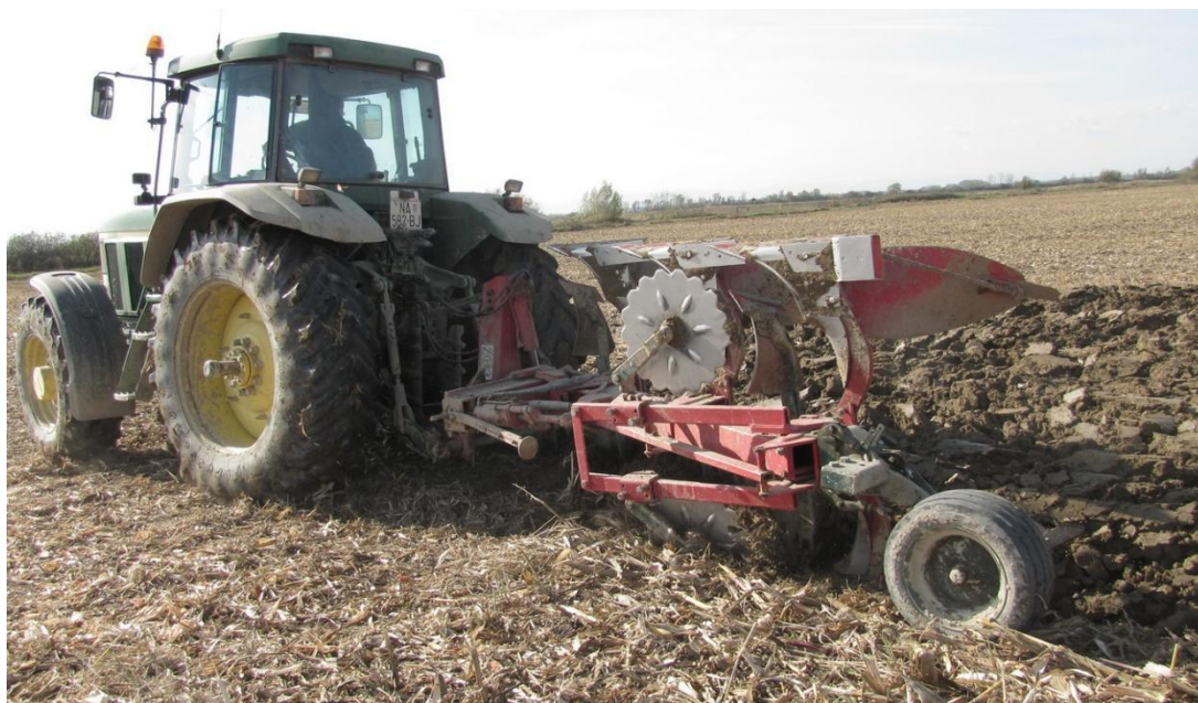
Slika 2. Konvencionalna obrada oranjem na 30 m dubine (Autor: D. Jug)

1. CT – konvencionalna obrada tla (oranje na 30 cm dubine), (Slika 2.)