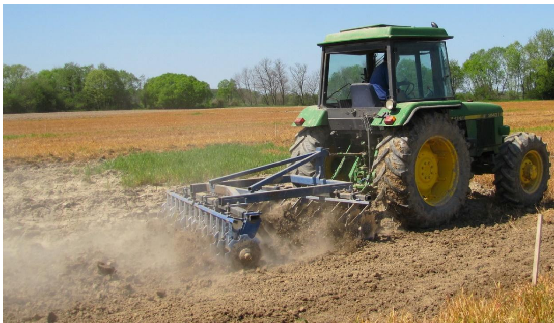
Slika 5. Tanjuranje na dubini 15-20 cm

4. DH - tanjuranje – konzervacijska obrada (tanjuranje do dubine 15 - 20 cm), (Slika 5.)