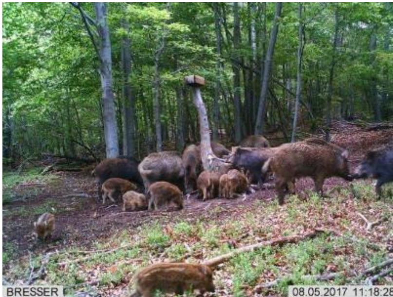
Slika 12. Divlje svinje, Sus scrofa

Potok Brzaju povremeno nastanjuje vidra ( Lutra lutra ).