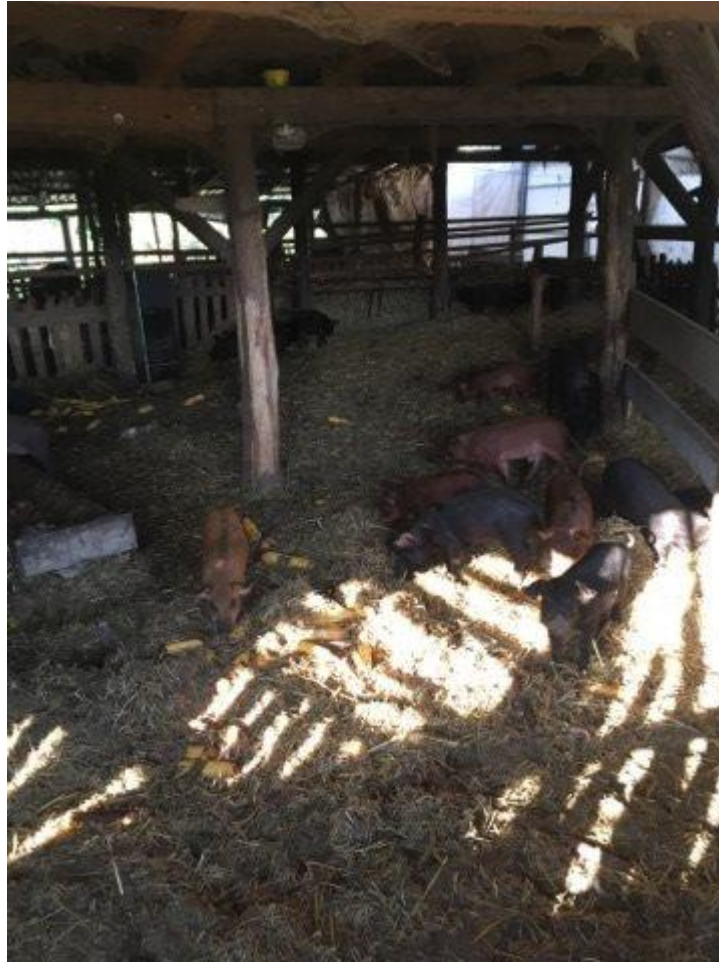
Slika 4. Svinje u objektu na gospodarstvu