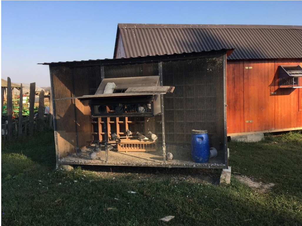
Slika 11. Objekt sa golubovima