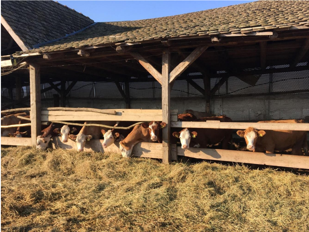
Slika 9. Krave