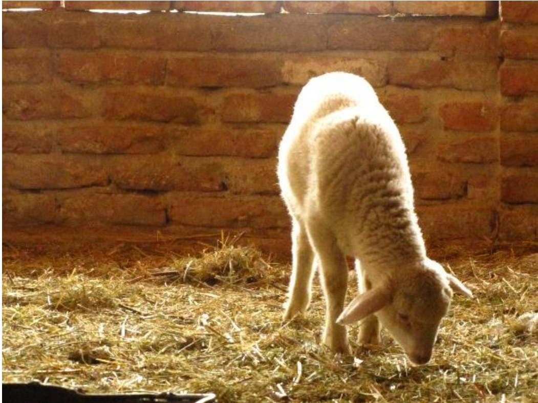
Slika 10. Ovca na gospodarstvu