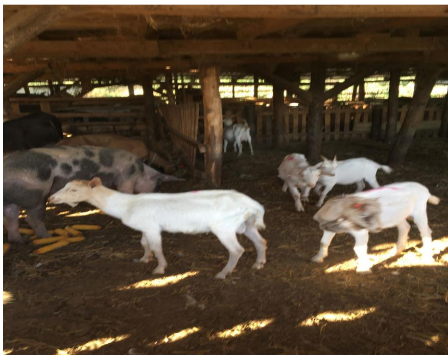
Slika 8. Svinje i koze zajedno u objektu

Sve se pasmine svinja ( crna slavonska, durok i mangulica ) nalaze zajedno u proizvodnim objektima. U jednom se dijelu objekta dio svinja i koza nalazi zajedno. Svaka kategorija svinja u velikom objektu ima svoj pregrađeni dio. Glavninu hranidbe za svinje čini lucerna, te grašak, a u zimskim mjesecima sjenaža lucerne. Za vrijeme visokog graviditeta i početka laktacije, kada životinje imaju najveće potrebe za hranom, dohranjuju se kukuruzom nabavljenim iz ekološkog uzgoja. Nema točno određeno do koje se tjelesne mase svinje tove. U zimskim mjesecima kada je sezona klanja svinja na selu tada se i na ovom gospodarstvu kolju svinje. Od svinjskoga se mesa prave mesne prerađevine ( kulen, kobasica ) koji se plasiraju na tržište te se koriste za osobne potrebe. Sav se rad vezan uz klanje životinja obavlja ručno na gospodarstvu. Mesne se prerađevine isto rade ručno na samome gospodarstvu. Prasci se također plasiraju na tržište kada imaju dovoljnu masu za pečenje. Optimalna masa za ovakvu prasad je 25 do 35 kilograma.