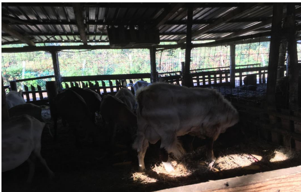
Slika 7. Burske koze

koristi sjenaža lucerne. Nakon zime, napasivanje počinje rano u proljeće. Prvih se dana na ispašu pušta 2 do 3 sata dnevno, a onda se počinje sa povećavanjem vremena napasivanja po 30 minuta. Zimski se obrok sjenaže postupno smanjuje kako se povećava vrijeme i hranidba napasivanjem. Koze se na ovome gospodarstvu ne vode na pašu u voćnjaku jer koze rado jedu granje i grmlje i da ne bi nastala šteta u voćnjaku one se napasuju na pašnjacima okolo kojih se nalazi šuma te na taj način one zadovoljavaju svoje potrebe za vlaknima. Za vrijeme visokog graviditeta i početka laktacije, kada životinje imaju najveće potrebe za hranom, dohranjuju se kukuruzom nabavljenim iz ekološkog uzgoja. S obzirom na to da se hrvatska bijela koza svrstava u kombiniranu pasminu koza, vrši se eksploatacija mlijeka na gospodarstvu. Mlijeko se iz koza izuzima ručno, a prinosi po kozi iznose 1 do 1.5 litara mlijeka dnevno. Ovo gospodarstvo na tržište plasira kozje mlijeko i kozji sir koji sami spravljaju, a kod spravljanja sireva ne upotrebljavaju se nikakvi dodatci. Muške jedinke u proizvodnji su pripadnici burske pasmine koza. Mužjaci se iskorištavaju za razmnožavanje i tove se za meso. Tov se na meso vrši do završne mase od 30 kg, ovisno o tržištu. Jarad se tovi majčinim mlijekom i ispašom dok ne bude vrijeme za klanje.