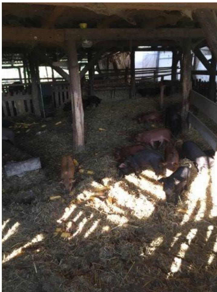
Slika 4. Svinje u objektu na gospodarstvu