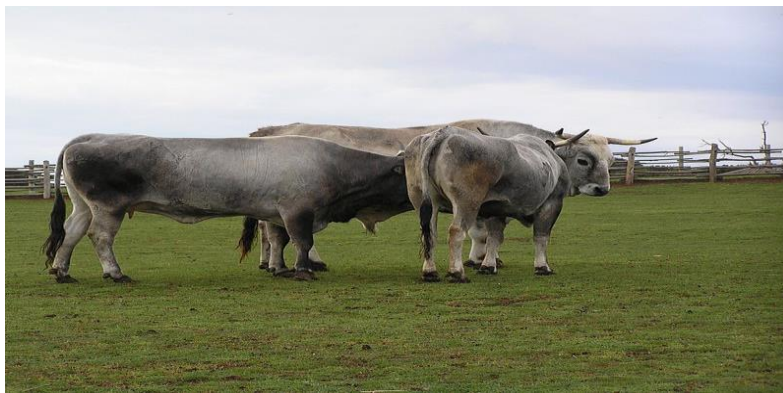
Slika 1. Istarsko govedo ( boškarin )

također mogu koristiti za vuču i obradu tla, ali kod nas je takav sustav proizvodnje rijetkost. Genotipovi koji se koriste za ekološku proizvodnju su uglavnom autohtone lokalne i domaće pasmine koje odlikuje prirodna otpornost i mogućnost konzumiranja velikih količina voluminozne hrane. Ovime se smanjuju troškovi zato što su potrebni manje zahtjevni uvjeti držanja i manji su troškovi za hranu i lijekove. Naše su domaće pasmine pogodne za ekološku proizvodnju kod svinja, crna slavonska svinja, turopoljska svinja te mangulica ; kod goveda istarsko govedo ( boškarin ) te slavonsko – srijemski podolac ; kod konja hrvatski posavac i hrvatski hladnokrvnjak; kod ovaca ; cigaja, lička pramenka te dubrovačka ruda ; kod koza istarska koza te koza hrvatica ; kod peradi kokoš hrvatica te zagorski puran.