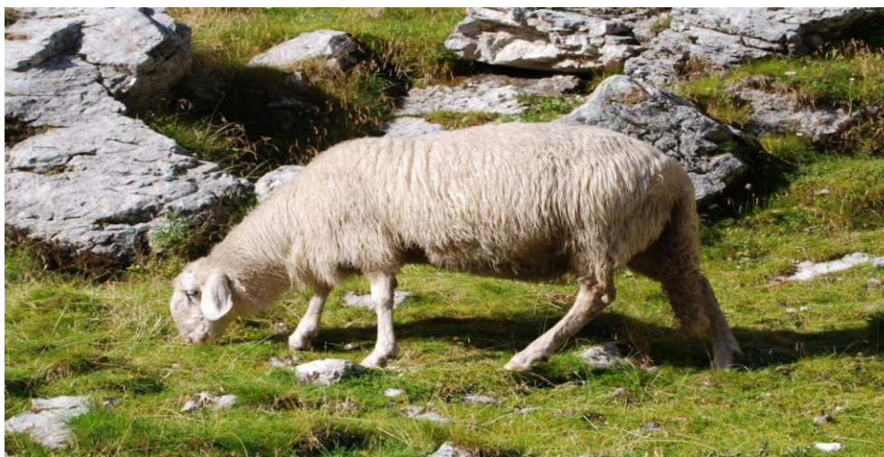
Slika 6. Solčavsko- jezerska ovca