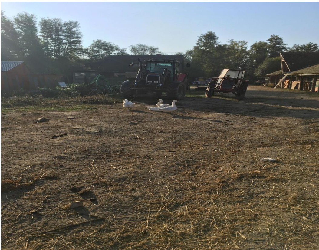
Slika 3. Mehanizacija na gospodarstvu

Na promatranom je gospodarstvu mehanizacija svedena na minimum iz razloga što se radi o ekološkom gospodarstvu. U posjedu su dva traktora te strojevi potrebni za skupljanje lucerne i njezino baliranje. Sve se životinje nalaze u velikom objektu čiji su dijelovi međusobno pregrađeni i u svakom se nalazi određena vrsta životinje, a u jednom se pregrađenom dijelu zajedno nalaze svinje i koze. Pregrade su napravljene tako kako bi mogli zadovoljiti kriterije za ekološku poljoprivredu za pojedine vrste životinja. Golubovi sa gospodarstva se nalaze u zasebnom objektu.