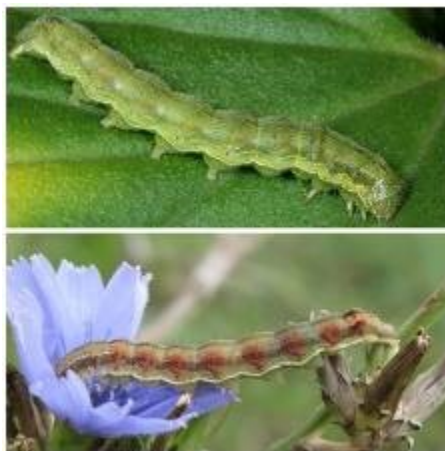
Slika 17. Gusjenice kukuruzne sovice

Kao što boja krila leptira varira, tako varira i boja gusjenice, na što utječe i biljka domaćin kojom se gusjenice hrane. Gusjenice mogu biti svijetlozelene, žute, ali i crvenastosmeđe boje (slika 17.).