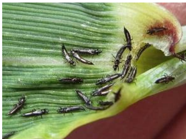
Slika 11. Haplothrips tritici - imago