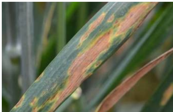
Slika 22. Septoria nodorum

Obje vrste izazivaju pjegavost lišća. Septoria nodorum uzrokuje i pjege na klasu - pljevama s kojih prelazi na zrno. Ova je jedna od značajnih i najopasnijih bolesti pšenice, može se pojaviti već u jesen, a redovito se javlja u mokrim i vlažnim proljećima. Pjege su izdužene, svjetlo smeđe boje s tamnijim rubom.