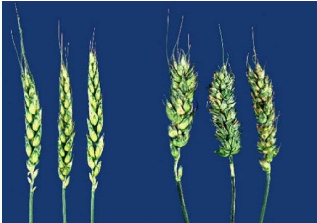
Slika 8. Zaražena pšenica (desno) i zdrava pšenica (lijevo)