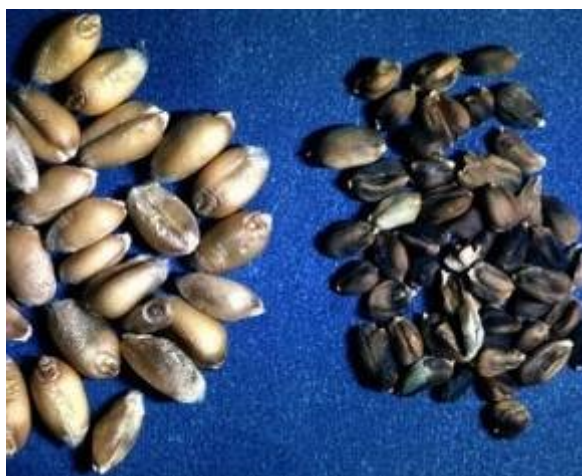
Slika 9. Zaraženo zrno (desno) i zdravo zrno (lijevo)

Zaražena zrna su manja i tamnije su boje (slika 9.).