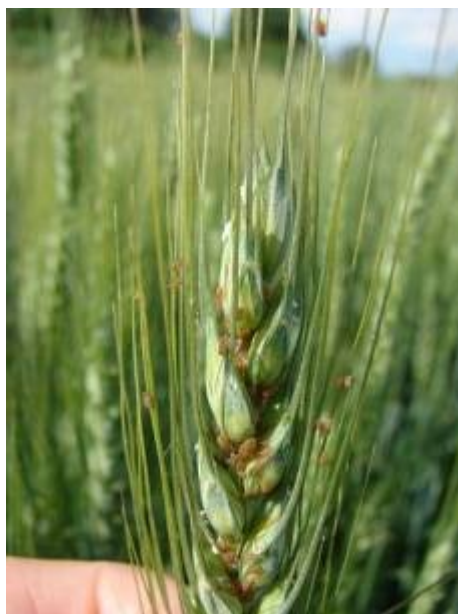
Slika 7. Lisne uši