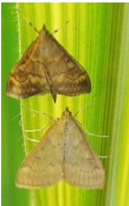
Slika 14. Ostrinia nubilalis - ženka i mužjak kukuruznog moljca