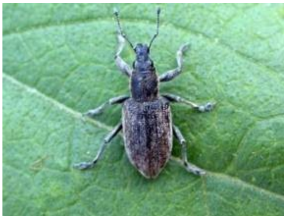
Slika 10. Tanymericus dilaticollis

lišće mladih biljaka kukuruza. Hrani se prije podne i navečer dok je za vrijeme lijepog vremena, preko dana, skrivena u pukotinama u tlu. Ne hrani se kada je vrijeme svježije te kada pada kiša.