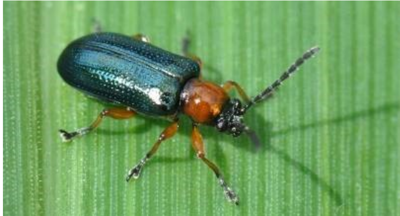
Slika 3. Oulema melanopus L. – imago