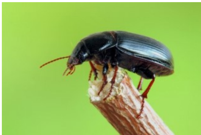
Slika 1. Zabrus tenebrioides - odrasli kukac

On je vrlo rasprostranjen te ekonomski vrlo značajan štetnik pšenice. Odrasli kukci kornjaši, crne su boje s tamnosmeđim nitastim ticalima i nogama i dugi su 15 mm (slika 1.). Tijelo im je ovalno te produženo (Ivezić, 2008.).