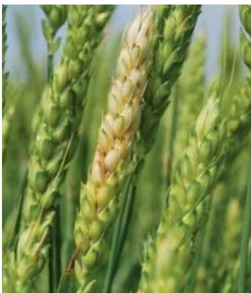
Slika 23. Pšenica zahvaćena paležom

Fusarium graminearum najopasniji je i najčešći uzročnik paleži klasa. Može zaraziti čitav klas ili dio klasa (slika 23.). Može uzrokovati velike štete na svim vrstama žita, a prvenstveno na pšenici u kukuruzu. Dijelovi koji su zaraženi gube svoju zelenu boju te postaju slamnato žuti (bijeli) i na njima se pojavljuje narančasta ili ružičasta prevlaka.