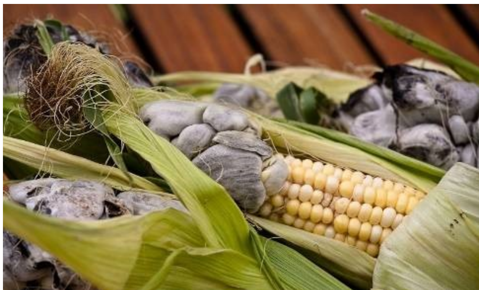
Slika 25. Ustilago maydis - na klipku kukuruza

Kod zaraženih biljaka javljaju se izrasline-tumori koji su puni spora. Izrasline su u početku svijetle boje (sivo-zelene), a kasnije dobiju tamnu sivu boju, raspuvacaju se i iz njih se oslobada crna praškasta masa spora.