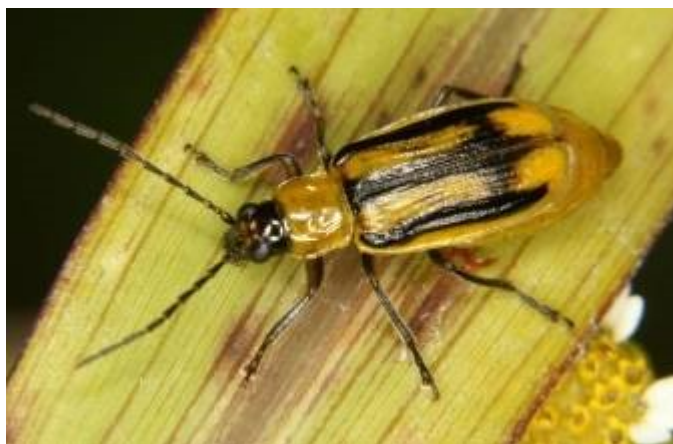
Slika 13. Diabrotica virgifera virgifera

Kukuruzna zlatica spada u jedne od ekonomski značajnih štetnika u Americi. U Europi je otkrivena 1992. godine u Srbiji i od tada se proširila po Europi u devetnaest zemalja (Ivezić, 2008.). U Hrvatskoj je prvi puta zabilježena 1995. godine u okolici Županje. Kukuruzna zlatica je kornjaš duguljastog tijela dug 5-6 mm. Pokrilje je žute boje s crnim prugama na hrptu (ženka) ili gotovo potpuno crno (mužjak). Ticala su duga i nitasta. Noge su tamne sa žutim dijelovima. Ličinka se hrani na korijenu kukuruza. Žučkastobijele je boje s tamnom glavom. Naraste do 15 mm (slika 13.).