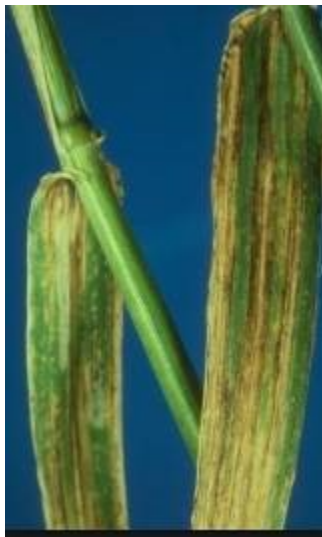
Slika 20. Prugavost lista ječma

Prenosi se isključivo sjemenom. Simptomi ove bolesti uočljivi su već na mladim biljkama - klorotične pruge između žila. Kasnije tkivo nekrotizira, a list se iskida duž žila (slika 20.).