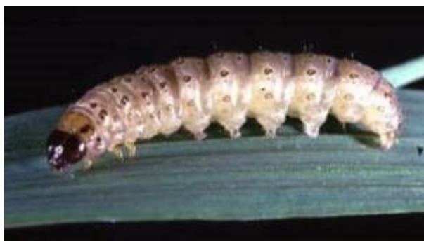
Slika 15. Gusjenica kukuruznog moljca

Gusjenica je isprva bjeličasto-ružičasta, kasnije postaje prljavo sive, katkad smeđe boje. Na hrptu svakog segmenta nalaze se četiri okruglaste pjege, a iz njih izbija po jedna dlačica. Naraste do 25 mm (slika 15.). Kukuljica je smeđa, duga 14-16 mm (Maceljski, 1999.).