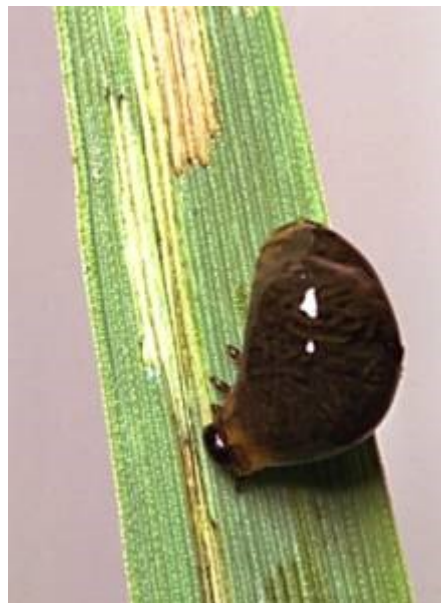
Slika 4. Oulema melanopus L. - ličinka

Ličinka je žuta i pokrivena crnom sluzi koja je nastala od izmeta te time podsjeća na balavog puža (Ivezić, 2008.) (slika 4.).