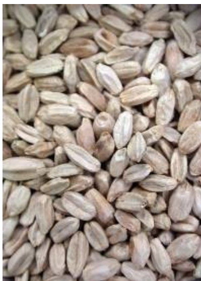
Slika 24. Sjeme zaraženo Fusarium graminearum

Štete se manifestiraju smanjenim prinosom jer klasovi imaju manji broj zrna ili su napadnuta zrna štura, a smanjuje se i klijavost. Zrna su još i smežurana i sitnija što je vidljivo na slici 24.