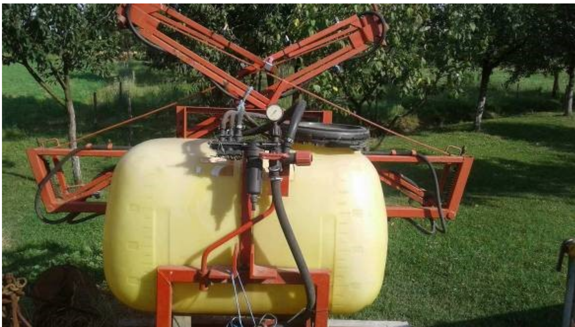
Slika 26. Prskalica MIO RAU sa spremnikom od 400l

Jara zob tretirana je protiv žute hrđe fungicidom Amistar extra. Preporučena doza je 0,6-0,8 \text{ l/ha} , 1,68 \times 0,6 = 1,00 \text{ l} . Tretirana je protiv žitnog balca insekticidom Direkt. Doza kojom je tretirano 0,1-0,12 \text{ l/ha} , 1,68 \text{ ha} \times 0,1 \text{ l/ha} = 0,16 \text{ l} .