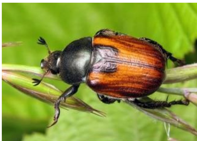
Slika 2. Anisoplia spp. – odrasli kukac

Pivci su kornjaši koji su po građi tijela najsličniji hruštevima. Dugački su oko 1 cm. Na trbušnoj strani su tamnozeleni ili crni dok su im krila smeđe boje (slika 2.). Žitni pivac može biti i potpuno crne boje (Ivezić, 2008.). Odrasli kukci pojavljuju se u vrijeme klasanja pšenice te oštećuju zrno, tako što ga jedu u fazi mliječne zriobe. Štete su veće u sušnim godinama. Kritičan broj ovog štetnika je 4-5 imaga/m 2 (Savjetodavna služba Internet).