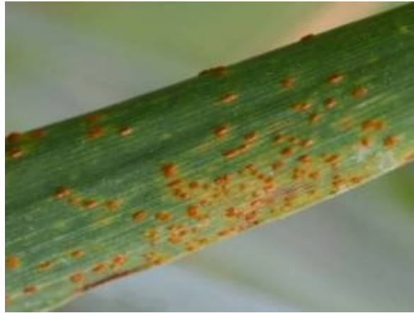
Slika 21. Puccinia recondita

Ova hrđa napada prvenstveno list pa je nazivaju i lisna hrđa. Za klijanje spora optimalne temperature su od 15 do 20 °C uz visoku vlagu zraka.