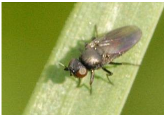
Slika 5. Oscinella frit L

Simptomi napada ovoga kukca su uvijenost centralnog lista koji kasnije žuti i suši se, brazdice u dršci klasa, oštećeni klas, zakržljali klas te vlat koja je krhka i pri jačem vjetru dolazi do loma. Postoje i mnoge druge deformacije na biljci s obzirom da se ličinke hrane sokovima biljaka (Čosić i sur., 2008.). Sprječavanje ovih štetnika je plitko zaoravanje strništa radi uništenja ličinki. Ovi nametnici također imaju i jako puno prirodnih neprijatelja koji reduciraju populaciju.