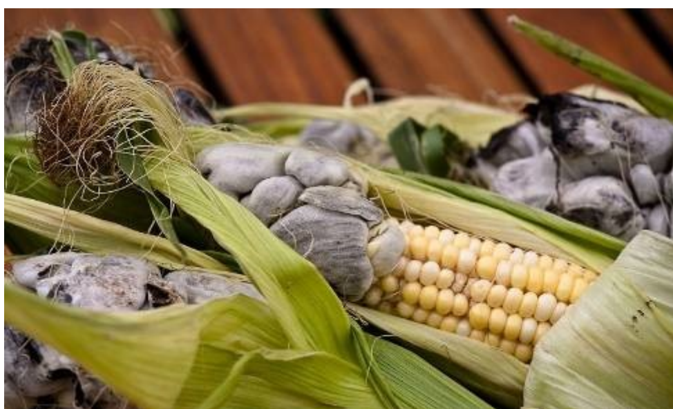
Slika 25. Ustilago maydis - na klipku kukuruza

Kod zaraženih biljaka javljaju se izrasline-tumori koji su puni spora. Izrasline su u početku svijetle boje (sivo-zelene), a kasnije dobiju tamnu sivu boju, raspuvacaju se i iz njih se oslobada crna praškasta masa spora.