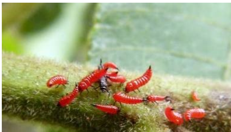
Slika 12. Haplothrips tritici - ličinke

Ličinka je crvene boje po čemu se lako prepoznaje od drugih vrsta (Ivezić, 2008) (slika 12.).