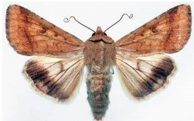
Slika 16. Helicoverpa armigera

Kukuruzna sovica je leptir koji u rasponu krila ima oko 4 cm. Za sovicu je karakteristično da joj boja krila varira od prljavo žute do tamne, s tim da je drugi par krila svjetlije boje (slika 16.).