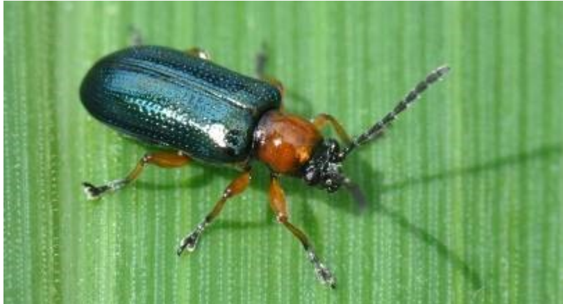
Slika 3. Oulema melanopus L. – imago