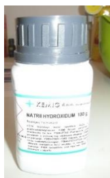
Slika 6.: Natrijev hidroksid (kaustična soda)

Radna površina mora biti čista i uredna. Nikada ne miješati NaOH u blizini hrane jer može špricnuti na veću udaljenost. Zaštitne naočale, rukavice, odjeću i obuću obavezno koristiti za cijelo vrijeme procesa izrade (do ulijevanja sapuna u kalup). Kaustičnu sodu uvijek sipati u vodu ili mlijeko, nikada obrnuto jer može doći do burne reakcije. Najbolje je otapati sodu na otvorenom. Otopinu NaOH i mlijeka ulijevati u ulja, ne obrnuto. Nakon upotrebe sav pribor i radno mjesto dobro oprati. U slučaju da otopina NaOH dospije na kožu treba ju temeljito isprati vodom i octom.