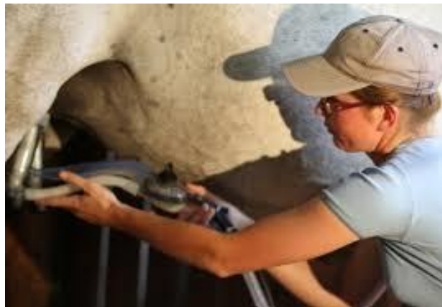
Slika 4.: Stavljanje muznih jedinica na vime kobile

Strojevi za mužnju sastoje se od pogonskog motora, podtlačna pumpa, podtlačni spremnik, regulator podtlaka, podtlačni vod, manometar, pulsator, pulzacijska cijev, muzna jedinica koju čini kolektor, sisne čaše sa sisnim gumama, kratke cijevi za mlijeko, cijev za mlijeko, oprema za prihvat mlijeka (kanta, mljekovod). Preporučena razina vakuuma u muznim uređajima je oko 42 – 45 kPa. Postupak mužnje obavlja se u dva takta (kompresija i sisanje). Preporučena frekvencija pulzacije je 120 u minuti. Omjer trajanja takta i kompresije i sisanja je 1:1, odnosno 50:50. Posuda za sabiranje mlijeka najčešće je zapremine 15 do 25 litara. Poželjno je da je izrađena od plastike ili metala, te da je pogodna za čišćenje i održavanje. Sustavi za mužnju mogu biti mobilni, djelomično mobilni ili potpuno fiksirani. Mobilni sustavi su prenosivi, djelomično mobilni imaju stacionarne dijelove za stvaranje i deponiranje vakuuma, te podtlačni vod, dok je muzna jedinica prenosiva. Fiksni sustav ima sve dijelove fiksne osim muznih jedinica, te je predviđeno da kobile dolaze u prostoriju (izmuzište) (Ivanković i sur., 2016.).