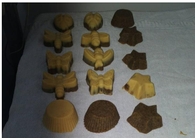
Slika 24.: Sapuni nakon 6 tjedana