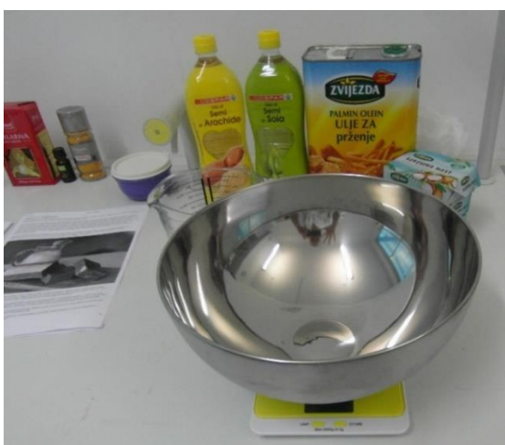
Slika 14.: Vaganje ulja