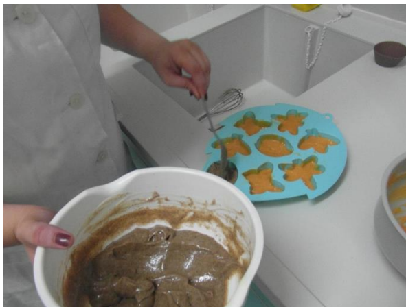
Slika 22.: Ulijevanje u kalupe