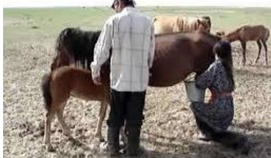
Slika 3.: Ručna mužnja na pašnjaku

Mužnja se vjerojatno počela događati nakon udomaćivanja životinja. Ručna mužnja se obavljala sve do 20. stoljeća. Mlijeko kobila predstavljalo se kao vrijednu namirnicu. Najviše se koristilo u prehrani djece i nedonoščadi, bolesnika i starije populacije. Najčešće se konzumiralo svježe ili prerađen trajni oblik (kumis). Mužnja je stimulacija vimena koja potiče sintezu i otpuštanje mlijeka. Pravilna mužnja je ona koja ne narušava zdravlje i ne stvara stres kod životinje, te ne ugrožava rast i razvoj ždrebeta (Alatrović i sur., 2017.). Posebnost mužnje kobila je ta da je moguća samo uz nazočnost ždrebeta. Oboljenje ili uginuće ugrožava laktaciju, te je potrebno brinuti za njegovo zdravlje i uhranjenost. Danas poznajemo više načina mužnje: ručna, strojna i hormonska mužnja (dodavanje oksitocina u organizam). Hormonska mužnja nije zaživjela u praksi jer narušava endogeni hormonalni balans kobile i takav način je skup.