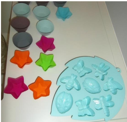
Slika 10.: Kalupi za izradu sapuna