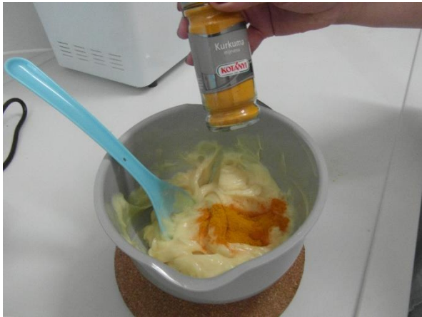
Slika 18.: Dodavanje boje (kurkuma)