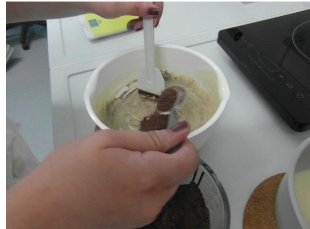
Slika 21.: Miješanje sastojaka u smjesi