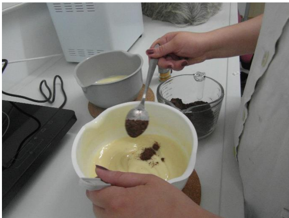
Slika 20.: Dodavanje kave i mlijeka u prahu