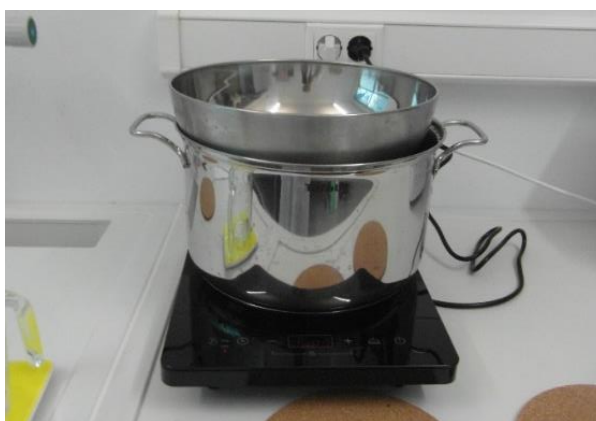
Slika 15.: Zagrijavanje ulja