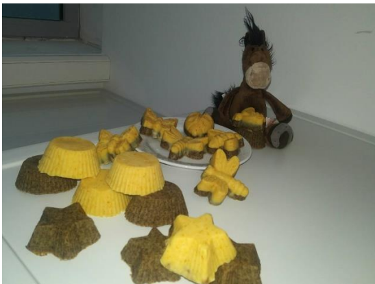
Slika 5.: Sapuni nakon 24 sata

Slična je hladnom postupku. Sama razlika je što se temperatura podiže na temperaturu od 100°C, te se zadržava do procesa saponifikacije. Pri zagrijavanju smjese treba paziti da ne dođe do prskanja jer aktivna lužina može izazvati opekotine i nagristi kožu. Zagrijavanje se prekida kada dođe do ključanja, potom se hadi, pa opet zagrijava. Postupak se ponavlja sve dok smjesa ne poprimi željenu konzistenciju sapuna. Tijekom hlađenja u smjesu se mogu dodati bojila, eterična ulja. Smjesa se potom izlijeva u kalupe. Kada očvrstne, reže se i pakira. Odmah je spreman za upotrebu, ali dobiva na kvaliteti ako određeno vrijeme odstoji (Ivanković i sur., 2016.).