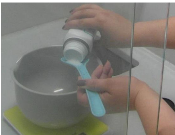
Slika 12.: Natrijev hidroksid (NaOH)