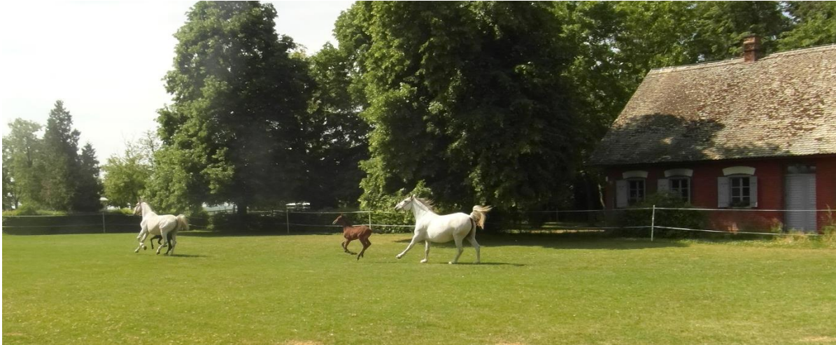
Slika 1.: Kobile lipicanske pasmine sa ždrjebadi na Ivandvoru

Potpuno razvijene dnevno proizvedu od 15 do 20 kg mlijeka, a neke dosežu i do 40 kg/dan. Toplokrvne jahače kobile proizvedu oko 2.300 kg mlijeka, Saddlebred kobilica 1.400 do 2.200 kg, Lusitano 2.020 kg, hladnokrvne kobile 2.600 kg, toplokrvne 2.100 kg, a poni kobile 1.700 kg mlijeka (Ivanković i sur., 2016.).