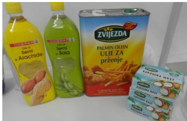
Slika 7.: Ulja pogodna za proizvodnju sapuna (Izvor: Sekulić, 2018.)