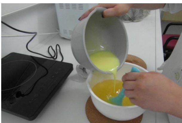
Slika 16.: Dodavanje otopljene sode u ulja