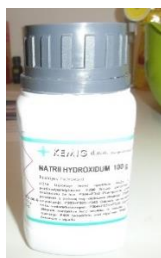
Slika 6.: Natrijev hidroksid (kaustična soda)

Radna površina mora biti čista i uredna. Nikada ne miješati NaOH u blizini hrane jer može špricnuti na veću udaljenost. Zaštitne naočale, rukavice, odjeću i obuću obavezno koristiti za cijelo vrijeme procesa izrade (do ulijevanja sapuna u kalup). Kaustičnu sodu uvijek sipati u vodu ili mlijeko, nikada obrnuto jer može doći do burne reakcije. Najbolje je otapati sodu na otvorenom. Otopinu NaOH i mlijeka ulijevati u ulja, ne obrnuto. Nakon upotrebe sav pribor i radno mjesto dobro oprati. U slučaju da otopina NaOH dospije na kožu treba ju temeljito isprati vodom i octom.