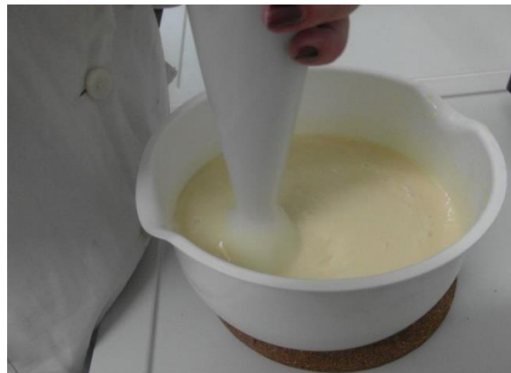
Slika 17.: Miješanje štapnim mikserom