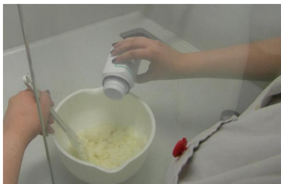
Slika 13.: Postepeno dodavanje NaOH u mljeko