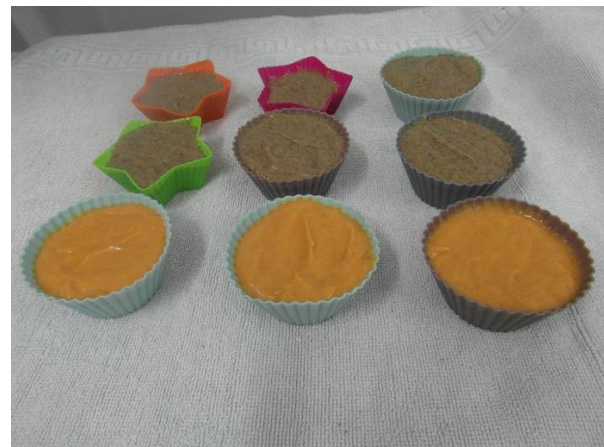
Slika 23.: Ulijevanje u kalupe