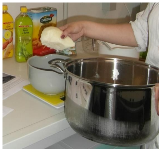
Slika 11.: Zamrznuto kobilje mlijeko