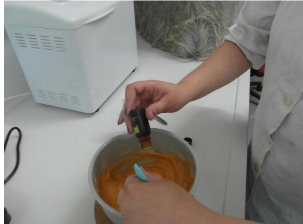
Slika 19.: Dodavanje eteričnog ulja (limun)