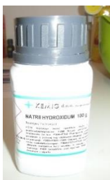
Slika 6.: Natrijev hidroksid (kaustična soda)

Radna površina mora biti čista i uredna. Nikada ne miješati NaOH u blizini hrane jer može špricnuti na veću udaljenost. Zaštitne naočale, rukavice, odjeću i obuću obavezno koristiti za cijelo vrijeme procesa izrade (do ulijevanja sapuna u kalup). Kaustičnu sodu uvijek sipati u vodu ili mlijeko, nikada obrnuto jer može doći do burne reakcije. Najbolje je otapati sodu na otvorenom. Otopinu NaOH i mlijeka ulijevati u ulja, ne obrnuto. Nakon upotrebe sav pribor i radno mjesto dobro oprati. U slučaju da otopina NaOH dospije na kožu treba ju temeljito isprati vodom i octom.