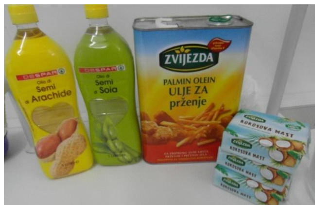
Slika 7.: Ulja pogodna za proizvodnju sapuna