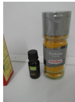
Slika 9.: Kurkuma – žuta boja

Prije nego što smo počeli sa izradom sapuna potrebno je pripremiti kalupe (slika 10.), plastične ili inox posude te pribor. Za izradu sapuna vodili smo se hladnim postupkom. Kada smo to sve pripremili možemo početi sa izradom sapuna. Prvo što smo napravili je to da smo izvagali zamrznuto mlijeko (slika 11.) te smo ga prebacili u plastičnu posudu. Zatim smo izvagali kaustičnu sodu (natrijev hidroksid; NaOH; slika 12.) iako nije bilo potrebno jer u ljekarnama dolazi u pakiranju od 100 grama. Nakon što smo izvagali sastojke počeli smo sa procesom