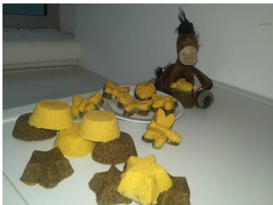
Slika 5.: Sapuni nakon 24 sata

Slična je hladnom postupku. Sama razlika je što se temperatura podiže na temperaturu od 100°C, te se zadržava do procesa saponifikacije. Pri zagrijavanju smjese treba paziti da ne dođe do prskanja jer aktivna lužina može izazvati opekotine i nagristi kožu. Zagrijavanje se prekida kada dođe do ključanja, potom se hadi, pa opet zagrijava. Postupak se ponavlja sve dok smjesa ne poprimi željenu konzistenciju sapuna. Tijekom hlađenja u smjesu se mogu dodati bojila, eterična ulja. Smjesa se potom izlijeva u kalupe. Kada očvrstne, reže se i pakira. Odmah je spreman za upotrebu, ali dobiva na kvaliteti ako određeno vrijeme odstoji (Ivanković i sur., 2016.).