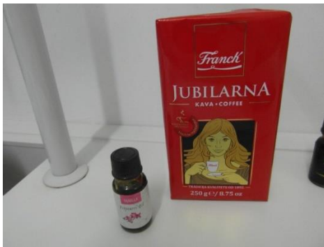
Slika 8.: Kava – smeđa boja