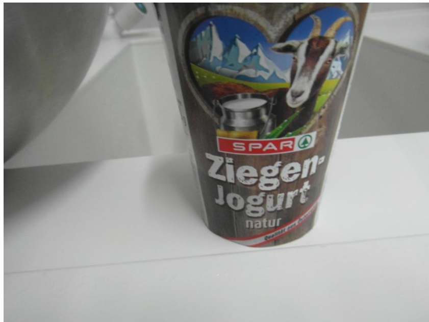
Slika 13. Kozji jogurt

Za pravljenje jogurta upotrijebila sam 1 litru kobiljeg mlijeka te 3 žlice čvrstog kozjeg jogurta (može i kiselo mlijeko)