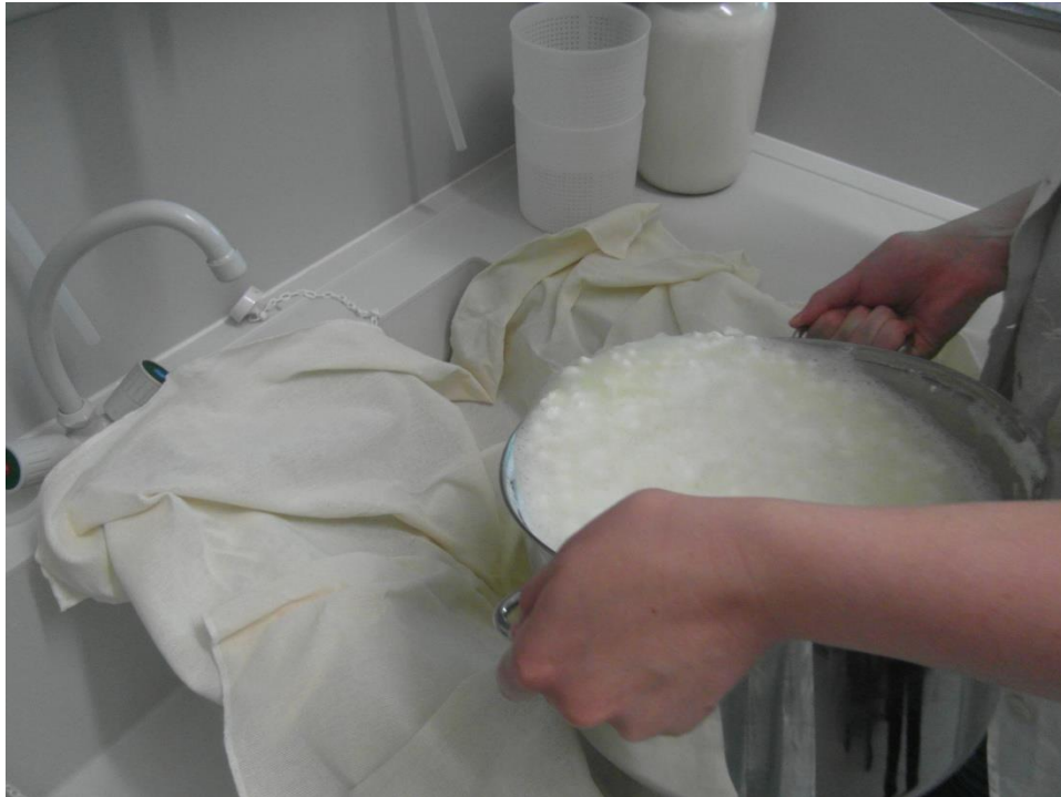
Slika 10. Procjeđivanje sira

3. Procijedite zatim sir i stavite ga u zdjelu, dodajte malo soli i kada se ohladi stavite ga u hladnjak. Sirutku po želji zasolite i pijte tijekom nekoliko dana, uz uvjet da ju držite u hladnjaku.