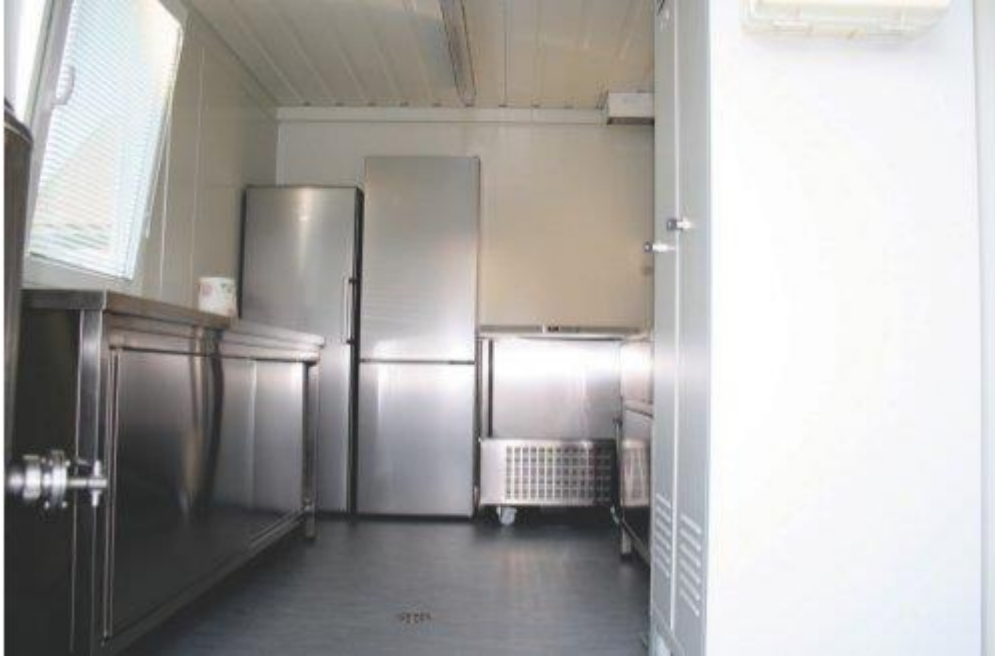
Slika 3. Jedinica za pakiranje, smrzavanje i fermentaciju kobiljeg mlijeka (Izvor: http://veterina.com.hr/wp-content/uploads/2014/05/slika03-mlijeko.jpg )