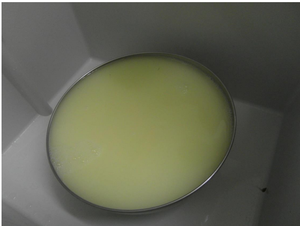
Slika 11. Sirutka