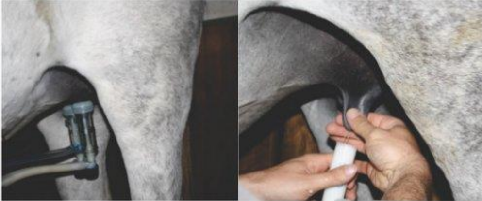
Slika 2. Mužnja kobile strojno (lijevo) i ručno (desno)

9) pridruživanje ždrijebadi kobilama (Ivanković i sur., 2014.).