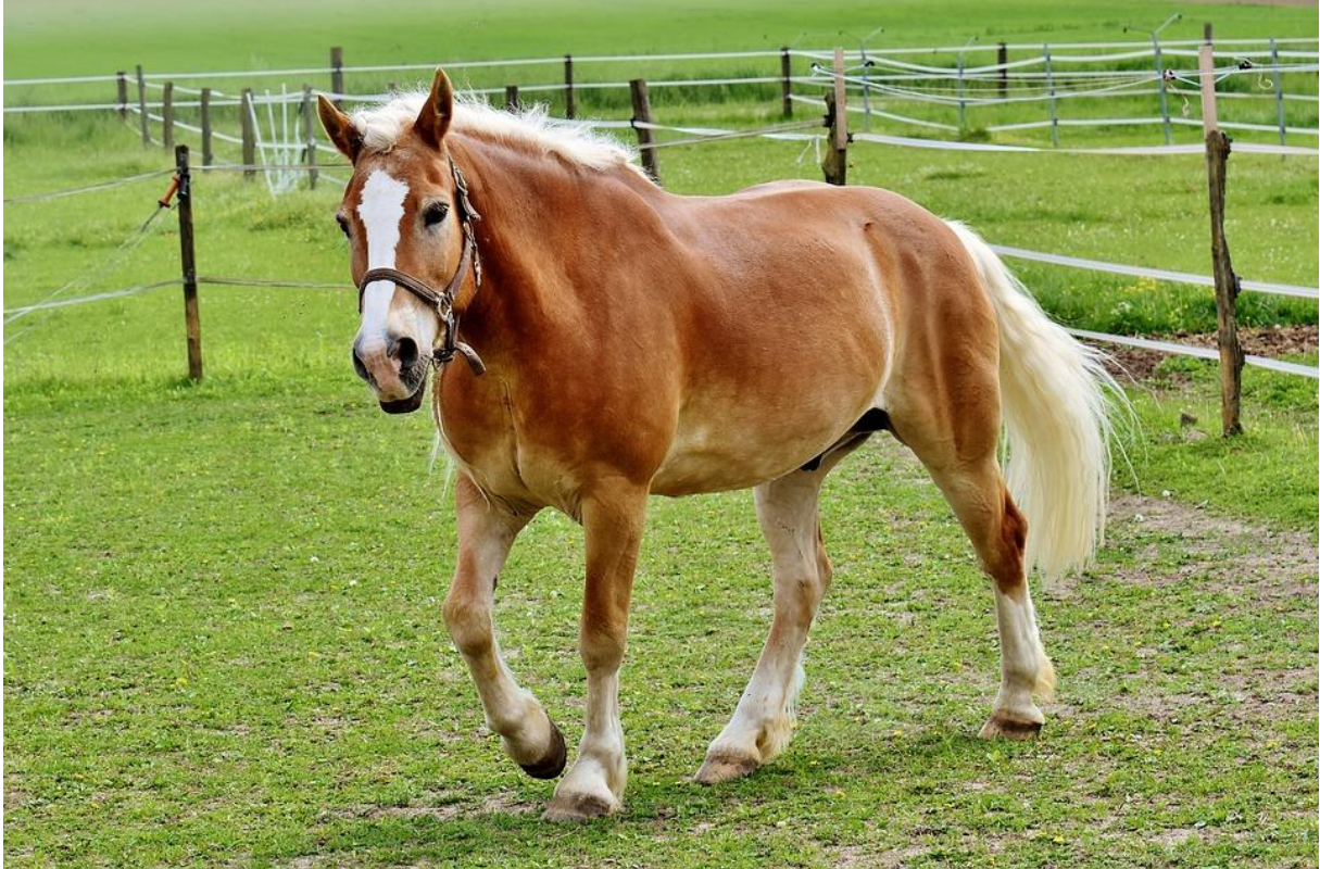
Slika 1. Haflinger