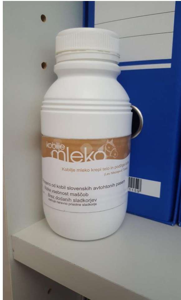
Slika 4. Pakiranje zamrznutog sirovog kobiljeg mlijeka u bočici