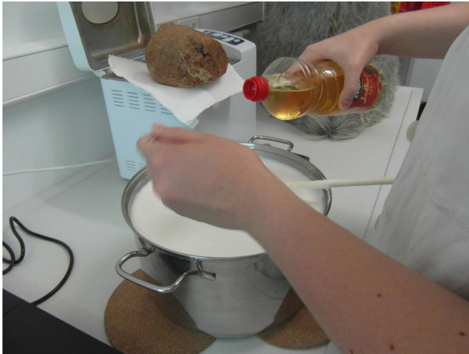
Slika 8. Dodavanje octa

2. Kad se počne stvarati gusta smjesa i od mlijeka zelenkasta tekućina, odnosno sirutka, skinite lonac s vatre, još kratko promiješajte i ostavite da se malo ohladi.