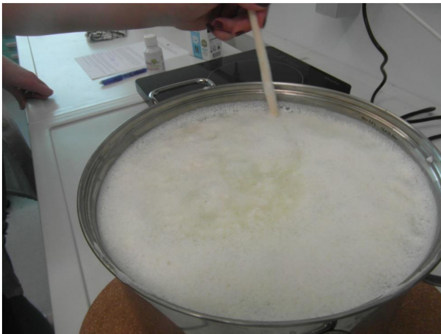
Slika 9. Stvaranje gruš i sirutke

2. Kad se počne stvarati gusta smjesa i od mlijeka zelenkasta tekućina, odnosno sirutka, skinite lonac s vatre, još kratko promiješajte i ostavite da se malo ohladi.