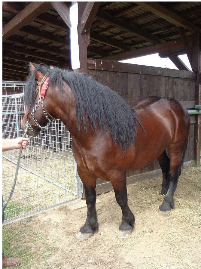
Slika 15. Hrvatski hladnokrvnjak

Ako uzmemo u obzir sve navedeno proizvodnja kobiljeg mlijeka u Hrvatskoj ima veliki potencijal jer postoji široki asortiman proizvoda od kobiljeg mlijeka koji svakako mogu naći svoje mjesto na tržištu. Hladnokrvne pasmine su bolje u smislu iskorištenja kobile jer su mliječnije, ali su i mirnijeg temperamenta pa su pogodnije za proizvodnju kobiljeg mlijeka. S druge strane, toplokrvnije pasmine su manje mliječne, stoga ih treba više promovirati u sportu, turizmu, kao i njihovo mlijeko kako bi cijena nadoknadila manje proizvedenu količinu mlijeka. U svemu ovome postoji veliki potencijal u konjogojstvu Hrvatske, ali nedostaje brend. Bilo bi idealno kad bi proizvode poput sapuna, losiona za tijelo, šampona za kosu, krema za lice, sira, jogurta, kruha, čokolade uspjeli brendirati te na taj način učiniti našu zemlju prepoznatljivom po tome. Također bi tako revitalizirali uzgoj autohtonih pasmina te očuvali genetsko i kulturno nasljeđe.