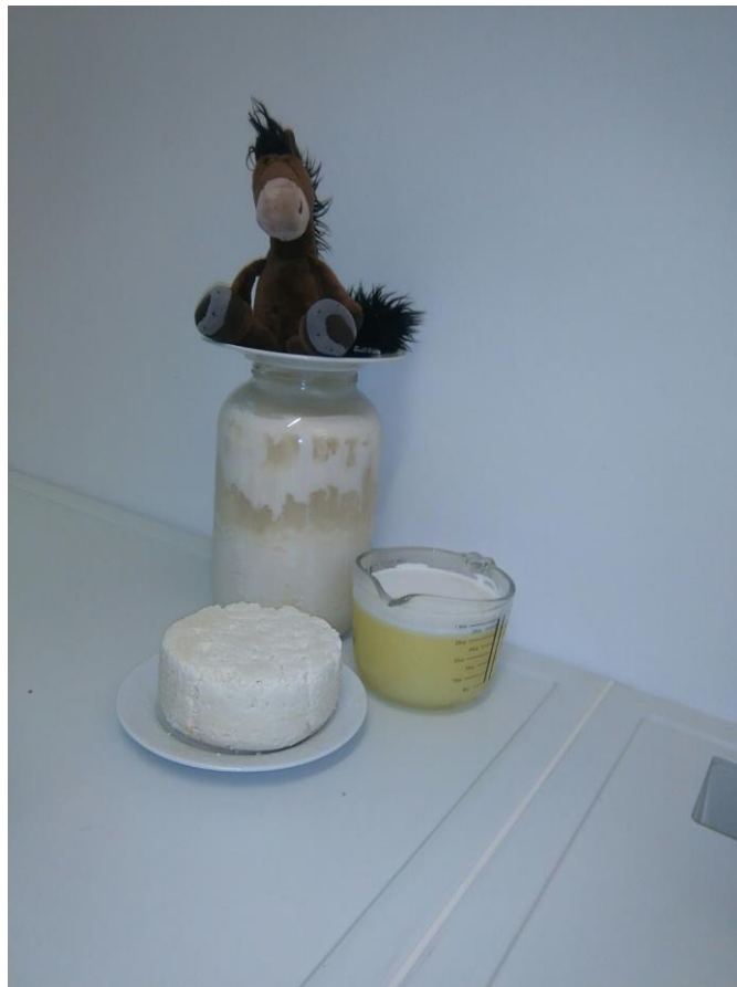
Slika 14. Sir, jogurt i sirutka