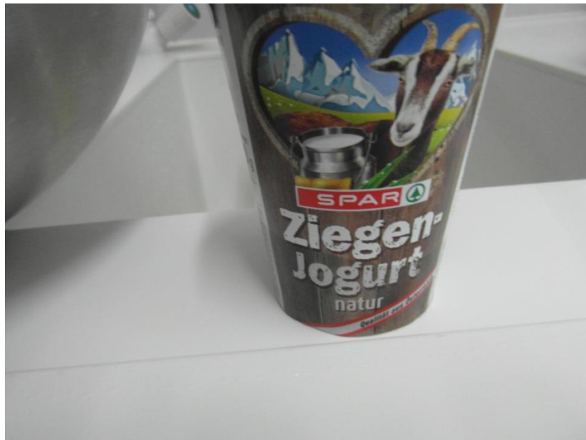
Slika 13. Kozji jogurt

Za pravljenje jogurta upotrijebila sam 1 litru kobiljeg mlijeka te 3 žlice čvrstog kozjeg jogurta (može i kiselo mlijeko)