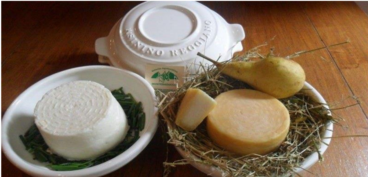
Slika 6. Asinino Reggiano sir

konzistencije, s različitim stupnjevima starenja. Također će razviti inačicu pogodnu za upotrebu kao topljeni sir, sada trenutno eksperimentira s proizvodnjom mozzarelle od 100% magaričinog mlijeka ( https://www.horsetalk.co.nz/2018/07/25/italian-asinino-reggiano-cheese-donkey/ ).