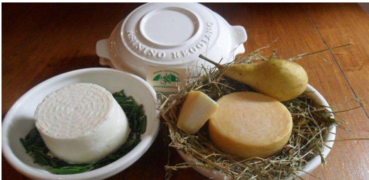
Slika 6. Asinino Reggiano sir

konzistencije, s različitim stupnjevima starenja. Također će razviti inačicu pogodnu za upotrebu kao topljeni sir, sada trenutno eksperimentira s proizvodnjom mozzarelle od 100% magaričinog mlijeka ( https://www.horsetalk.co.nz/2018/07/25/italian-asinino-reggiano-cheese-donkey/ ).