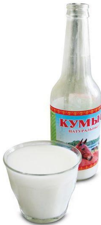
Slika 5. Kumis, fermentirano kobilje mlijeko

mlijeka kopitara. Mlijeko kopitara u prahu se najčešće pakira u vrećice od 200 do 250 g, što je ekvivalent 250 ml svježeg mlijeka ili u kapsule, koje se preporučuje za konzumaciju na duži period (Alatrović i sur. 2017.). Jako malo mlijeka kopitara se preradi u druge proizvode namijenjene konzumaciji, kao što je čokolada, sladoled, različiti bezalkoholni i alkoholni napitci i slično. Najveći dio prerade mlijeka kopitara je u kozmetičke pripravke. Na tržištu se najbrojnije pojavljuju sapuni i kreme. Razlike u kakvoći tih proizvoda dosta su velike. Te razlike rezultiraju različita kakvoća sirovina, udio mlijeka kopitara u konačnom produktu i postupci proizvodnje. Kod svih kozmetičkih proizvoda mlijeko kopitara predstavlja dosta velik trošak u odnosu na ostale sirovine. Pored toga je postupak proizvodnje kozmetike iz mlijeka kopitara nešto složeniji, ako želimo zadržati sastojke mlijeka na način, da bude učinak na korisnike što veći. Pored toga proizvodnja je po kvantitetu dosta mala pa je cijena proizvoda kad su napravljeni kvalitetno i s visokim udjelom mlijeka kopitara visoka ( http://veterina.com.hr/?p=32094 ).