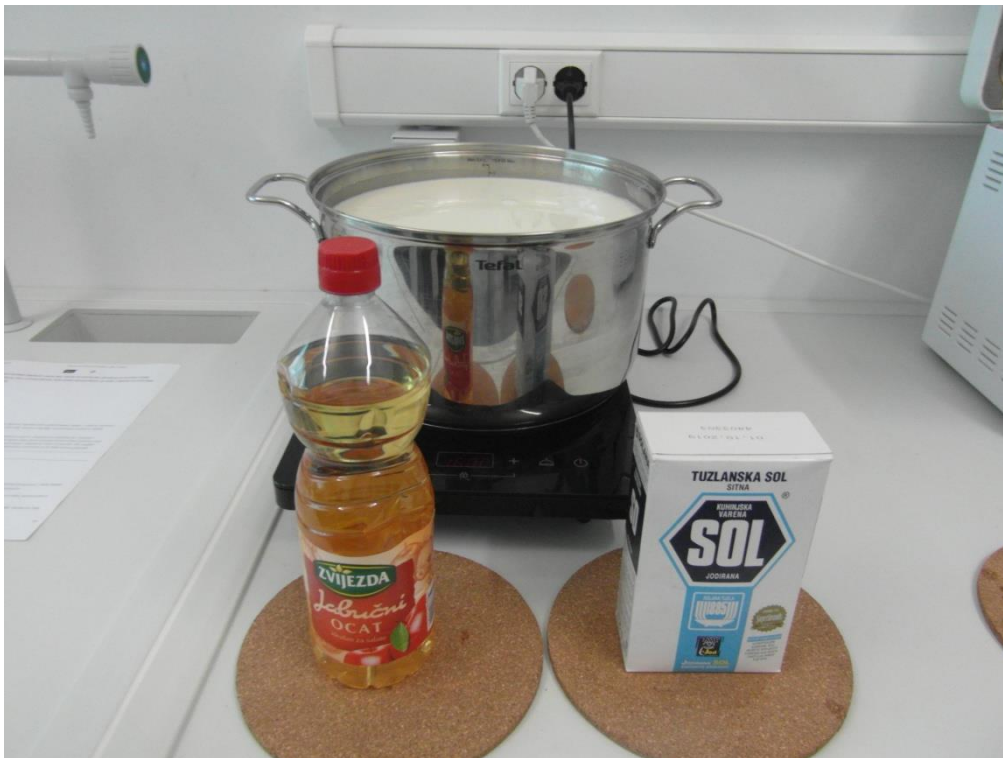
Slika 7. Sastojci potrebni za izradu sira

Za pravljenje domaćeg sira koristila sam ukupno 8,5 litara mlijeka; 6 litara kozjeg mlijeka te 2,5 litre kobiljeg mlijeka, 15 žlica octa (može se koristiti i jogurt) i sol. Sir od kobiljeg mlijeka moguće je proizvesti u omjeru 70:30 (kozjeg : kobiljeg mlijeka).