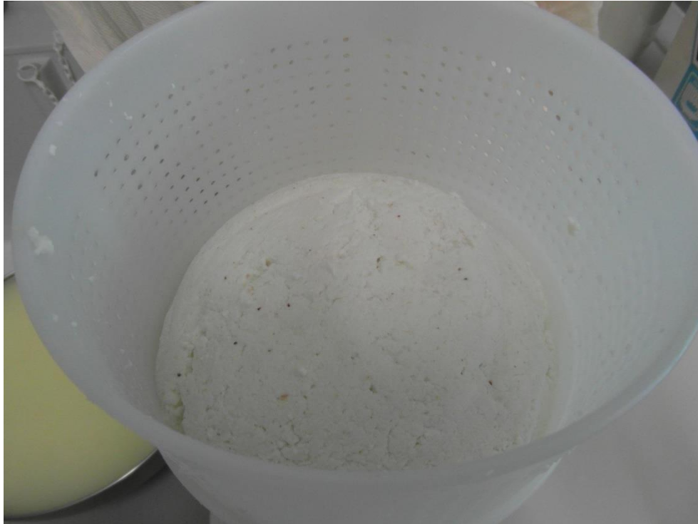
Slika 12. Stavljanje sira u posudu