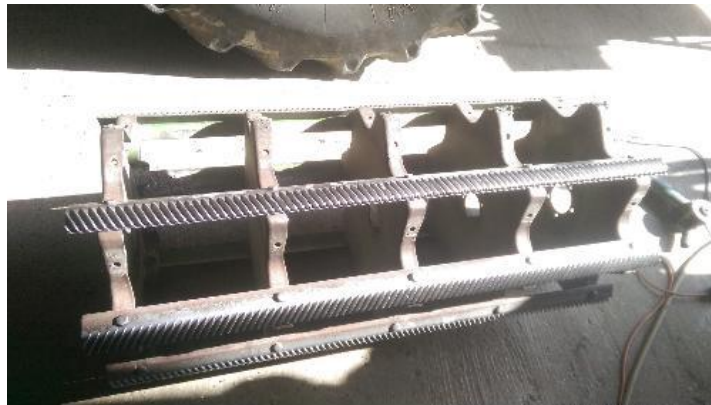
Slika 5. Prikaz bubnja (bitera) kombajna „MF Cerea 7274“

Ova dva elementa jedna su od ključnih faktora u izvršavanju žitne te izdvajanje pšeničnog zrna iz klasova pšenice. Nakon što uvlačno grlo dopremi žitnu masu, onda dolazi na bubanj koji je pokretni dio za razliku od podbubnja. Žitna masa prolazi kroz bubanj te trenjem koje bubanj stvara po podbubnju dolazi do krunjenja zrna te odvajanja iz klasova. Bubanj se sastoji od poprečnih rebrastih letvi a podbubanj je otvorene izvedbe. Podbubanj je stacionirani radni organ najčešće otvorene izvedbe s poprečnim letvama i žicama kroz koje se prosijava ovršena masa. Kut dohvata oko bubnja iznosi od 104^{\circ} do 120^{\circ} . Razmak podbubnja od bubnja na ulazu je za 2 do 3 puta veći od razmaka na izlazu. U suvremenim kombajnama razmak između podbubnja i bubnja podešava se u radu kombajna.