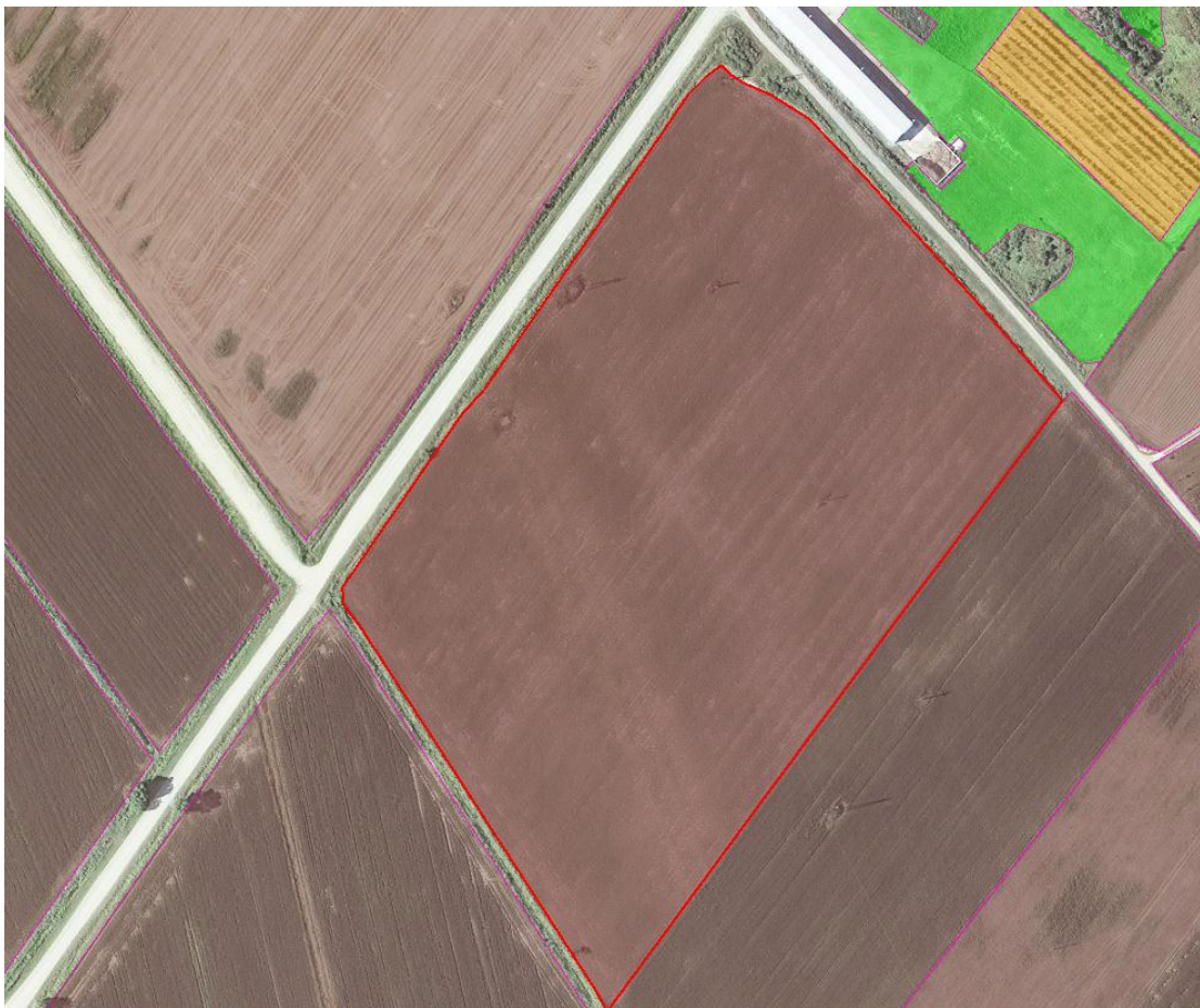
Slika 1. Prikaz ARKOD čestice 1758026

Žetva pšenice kao najvažnije krušarice u RH na OPG-u „Srećko Papac“, odvijati će se na parceli ukupne površine 5,76 ha, ARKOD oznake 1758026 koja pripada ekološkoj proizvodnji te zauzima jednu trećinu ukupnih obradivih površina na OPG-u „Srećko Papac“.