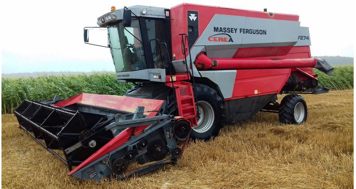
Slika 14. Kombajn „MF Cerea 7274“ vlasništva OPG Srećko Papac

Kombajn je u vlasništvu obiteljskog poljoprivrednog gospodarstva Srećko Papac. Godina proizvodnje kombajna je 2003. Na gospodarstvu koriste ga u svrhu žetve pšenice, ječma, uljane repice, soje i kukuruza s pripadajućim adaptacijama. Tijekom jedne proizvodne godine kombajn ovrši oko 200 ha spomenutih poljoprivrednih kultura. Osim za vlastite potrebe stroj se koristi u uslužne svrhe kako bi se povećala iskoristivost kupljenog stroja.