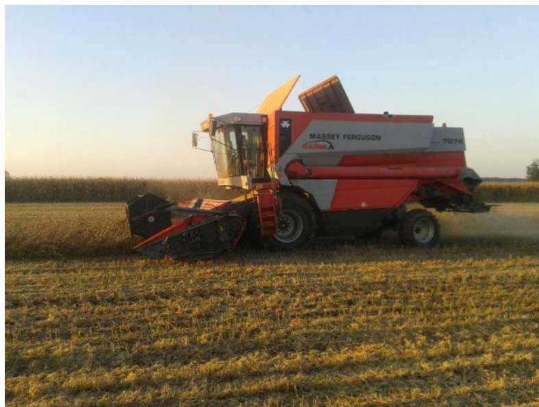
Slika 2. Prikaz kombajna „MF Cerea 7274“ u radu

puta baca naprijed prema izlazu i gore pa se i time dodatno protresuje zrno. Sječkalica biljnih ostataka reže, sječka i razbacuje žitnu masu ravnomjerno po cijeloj površini.