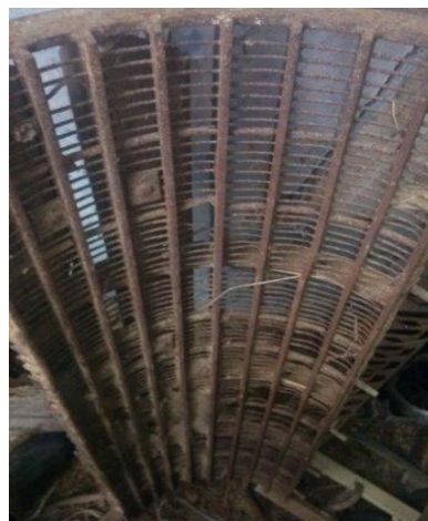
Slika 6. Prikaz podbubnja (korpe) kombajna „MF Cerea 7274“