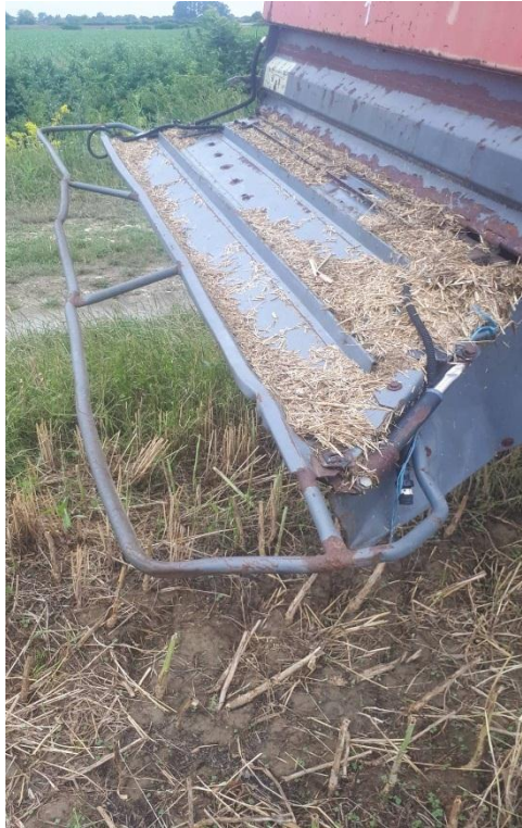
Slika 11. Prikaz razbacivača („lepeze“) žetvenih ostataka kombajna „ MF Cerea 7274 “