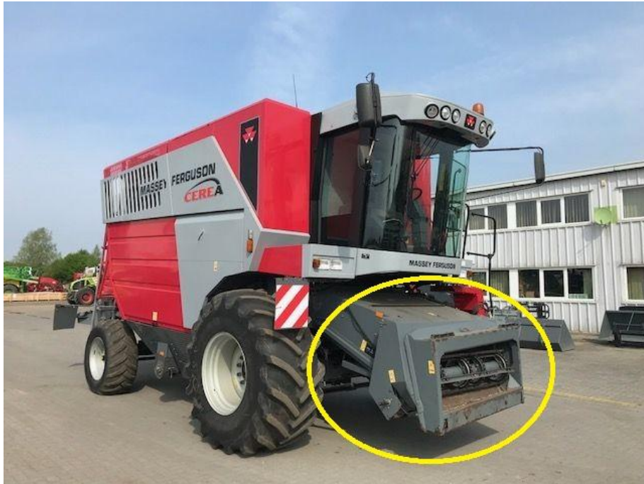
Slika 4. Žutim krugom označen i prikazan uvlačni kanal kombajna „MF Cerea 7274“

Uvlačno grlo kombajna ima zadatak primiti svu pokošenu žitnu masu, dobivši je od žetelice preko pick-up uređaja, dopremiti ju do bubnja i podbubnja u njeno daljnje izvršavanje. Uvlačno grlo sastoji se od poprečnih osovina na kojima se nalaze lančanicu po kojima se okreću uvlačni lanci sa poprečnim letvama koji odvođe i guraju masu prema bubnju kombajna.