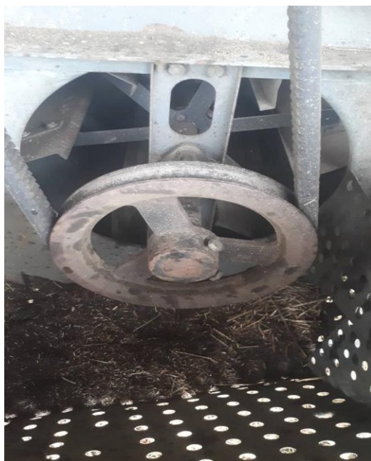
Slika 10. Prikaz pogonske remenice i remena „MF Cerea 7274“