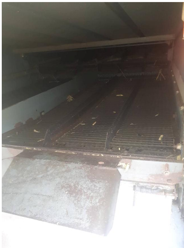
Slika 9. Prikaz gornjeg rešeta kombajna „MF Cerea 7274“

Zrno u spremnik dolazi poprečnom pužnicom koja čisto zrno predaje lančastom transporteru, a on spiralnom transporteru iznad spremnika. Na dnu spremnika nalazi se poprečno postavljene spiralni transporter. Iznad tog transportera postavljen je pokrovni lim kojim se regulira dotok zrna. Na spiralni transporter spojena je cijev za pražnjenje. Cijev je zglobno vezana za kombajn i u transportu je priključena uz kombajn. Kod pražnjenja spremnika postavlja se u radni položaj.