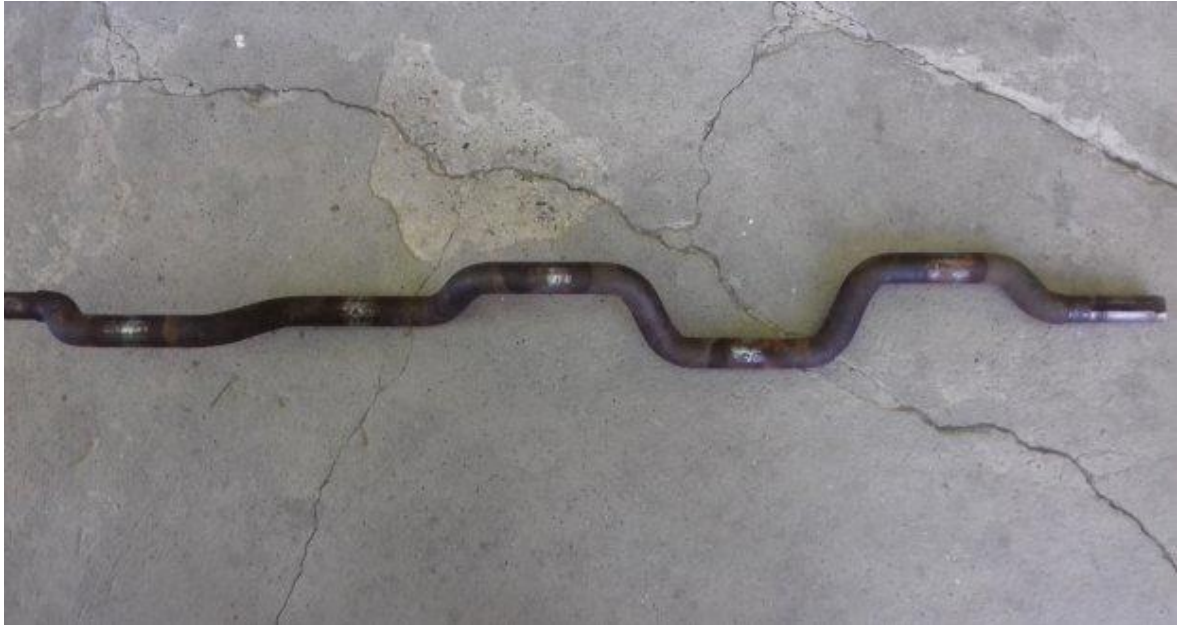
Slika 8. Prikaz koljenastog vratila slamotresa kombajna „MF Cerea 7274“