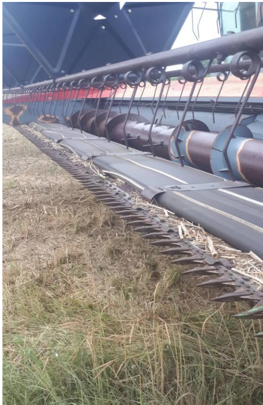
Slika 3. Prikaz žetelice kombajna s uvlačnim trakama kombajna „MF Cerea 7274“

Razdjeljivač ima zadatak prilikom košnje razdvojiti žitne stabljike koje će se u tom proходу pokositi, od onih koje se neće pokositi. Nadalje heder kombajna „Massey Ferguson Cerea 7274“ posjeduje tzv. „pokretne trake“ koje se nalaze ispred horizontalne pužnice te nanose žitnu masu bolje i ravnomjernije na pužnicu, radi lakšeg prolaska kroz uvlačno grlo kombajna.