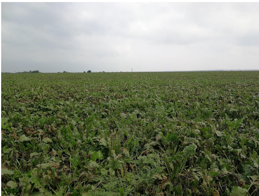
Slika 2. Repište šećerne repe u rujnu prije vađenja

Šećerna repa se vadi u tehnološkoj zrelosti u periodu od sredine rujna do sredine studenog (Slika 2.). Na rok vađenja utječu zrelost šećerne repe, vremenski uvjeti, mogućnost prerade i kapacitet šećerane. Prilikom vađenja kombajn treba pravilno vaditi sav korijen i rezati lišće i glavu korijena repe.