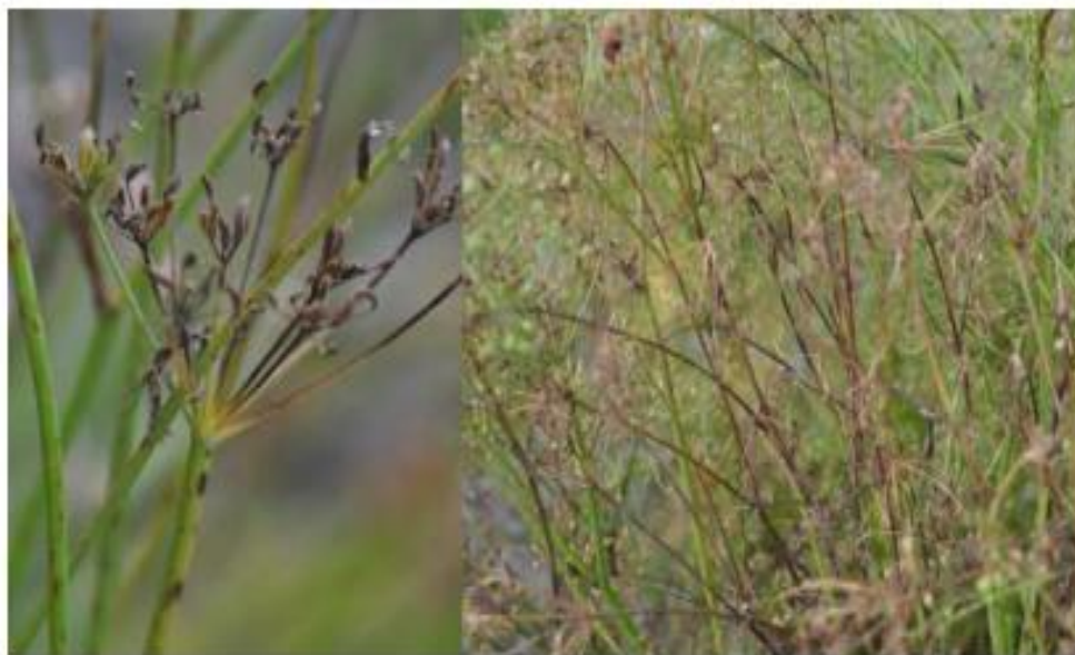
Slika 8. Simptomi uzrokovani gljivom Mycocentrospora acerina

Gljiva Mycocentrospora acerina uzrokuje antraknozu kima, simptomi su nekrotične pjege na podzemnim i nadzemnim dijelovima biljke (Slika 8.).