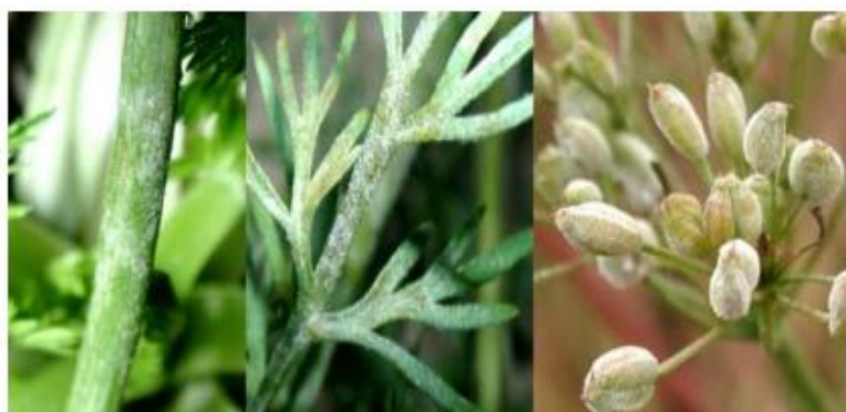
Slika 7. Pepelnica ( Erysiphe heraclei ) na nadzemnim dijelovima biljke kima