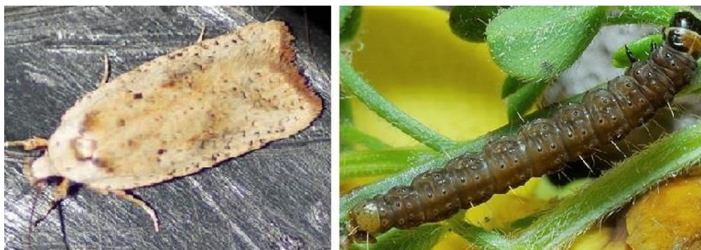
Slika 9. Imago i ličinka moljca kima ( Agonopterix nervosa )

Od štetnika, najopasniji je moljac kima ( Agonopterix nervosa ) (Slika 9.). Ličinka moljca napada stabljiku i list, a kasnije i cvat. Najpovoljnije vrijeme zaštite je treći stadij razvoja ličinke (s tim što tretman treba ponoviti nakon 8 do 10 dana) sa sredstvom na bazi tiakloprida .