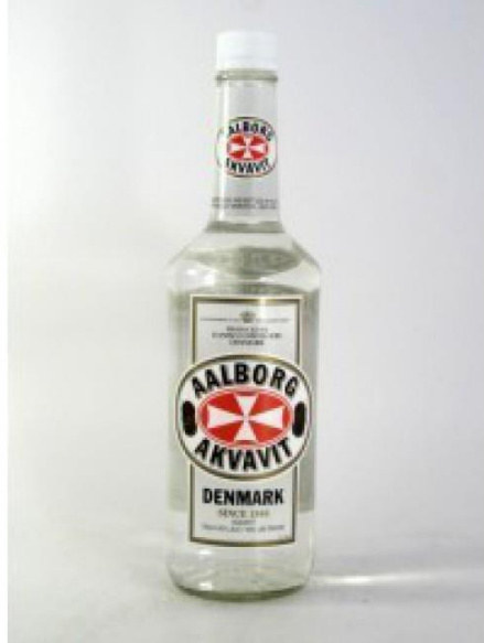
Slika 13. Skandinavsko alkoholno piće Akvavit