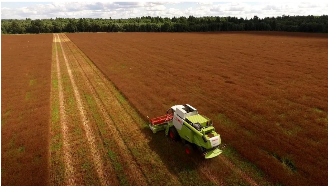
Slika 10. Žetva kima

Zbog osipanja plodova i sklonosti lomljenju, žetva treba biti provedena u pravo vrijeme. Najčešće se obavlja prijepodne ili predvečer, kada se zbog vlage u zraku sjeme manje osipa (Šilješ i sur., 1992.). Ovisno o regiji i sorti, dvogodišnji kim se žanje od srpnja do rujna, u Europi najčešće u kasnom lipnju ili prvoj polovici srpnja (Peter, 2006.). Ozimi kim je spreman za žetvu već u ožujku i travnju u uvjetima tropske klime, 4-5 mjeseci nakon sijanja. Međutim, u područjima umjerene klime jednogodišnji kim cvjeta nakon što prezimi tako da se žanje u srpnju, otprilike 15 mjeseci nakon sijanja. Žetva se obavlja kada sjeme poprimi karakterističnu tamnosmeđu boju budući da vrlo lako opada ukoliko se čeka da cijelo sjeme potpuno sazrije (web 5.). Žetva se obavlja kosilicom ili žitnim kombajnom te srpom na manjim farmama (Slika 10.).