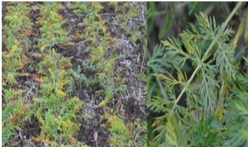
Slika 5. Pjegavost kima

Za visok prinos sjemena, vrlo je bitno održati adekvatnu vlažnost tla. Količina navodnjavanja ovisi o tipu tla i klimatskim uvjetima. Kod dvogodišnjeg kima prvo navodnjavanje treba biti pri razvoju stabljike, a drugo pri cvatnji i formiranju sjemena, odnosno u najbitnijim fazama za postizanje visokog prinosa sjemena. U semiaridnim područjima, gdje se uzgaja jednogodišnji kim, dvije faze u kojima je navodnjavanje najpotrebnije su rani razvoj kod nicanja te faza razvoja sjemena (Peter, 2006.).