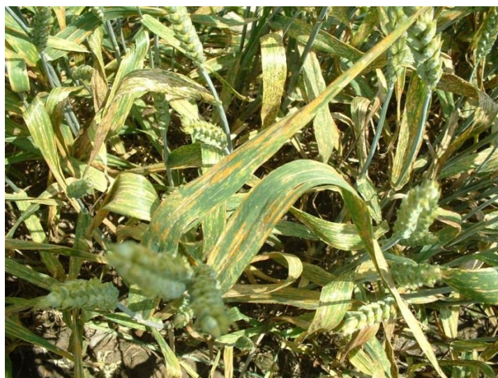
Slika 4. Žuta hrđa lat. Puccinia striiformis