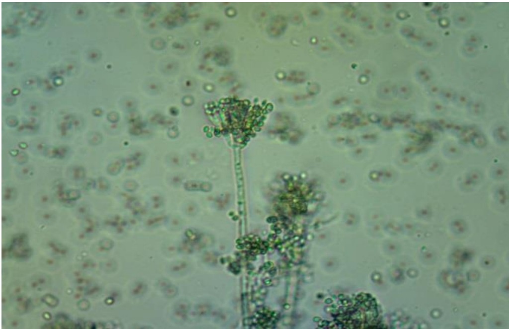
Slika 12. Penicillium sp.