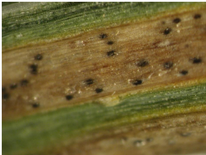
Slika 2. Smeđa pjegavost lista pšenice lat. Septoria tritici

S. nodorum može parazitirati na klasu i listu, a prenosi se sjemenom. Najčešće se pojavljuje u toplim područjima s mnogo kiše u kojima smanjuje prinos i uzrokuje pojavu smežuranih zrna. Spore koje prežive u žetvenim ostacima tijekom ljeta sazrijevaju u jesen i raznose se kišom zimi ili vjetrom te se tako šire na velike udaljenosti. Najbolja zaštita su otporne sorte, upotreba certificiranog sjemena, pravilan plodored, uklanjanje žetvenih ostataka i upotreba fungicida (Jurković i sur., 2016).