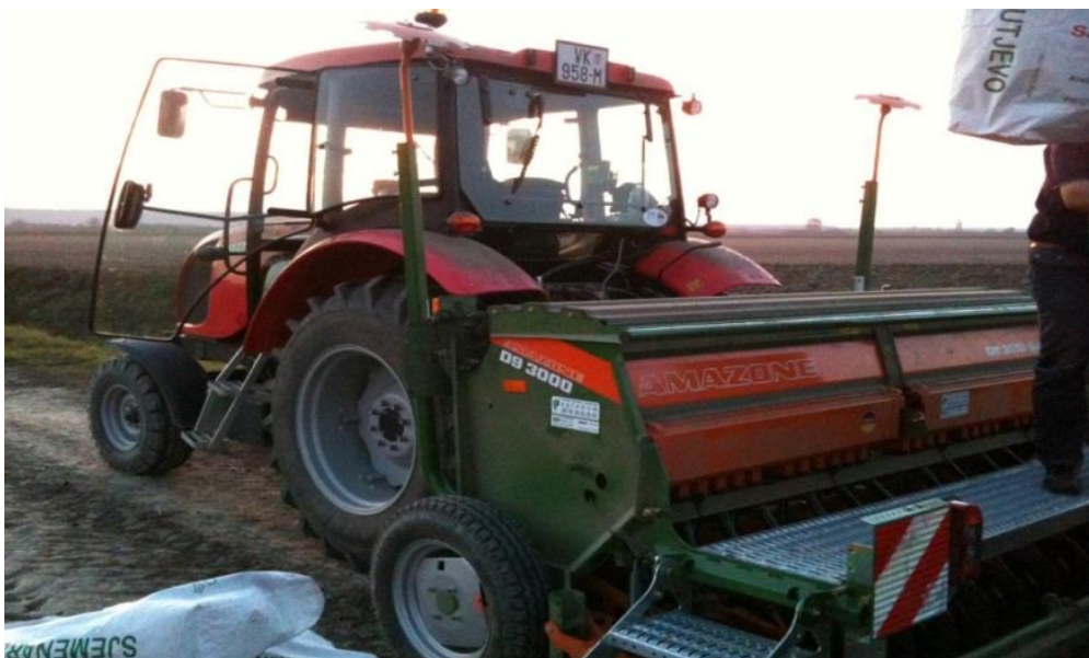
Slika 7. Sijačica Amazone D9 3000 Super

Na pokusnim tablama predsetveno je dodano NPK 0:20:30 435 kg/ha. Sjetva je obavljena sijačicom Amazone D9 3000 Super (Slika 7.) na međuredni razmak od 12,5 cm, datum sjetve bio je između 25.10 i 20.11. (Tablica 1.). Prihrane su obavljene rasipačem Rauch MDS (Slika 8.), radnog zahvata 15 metara. Prva prihrana obavljena je 22.2.2017. i dodano je dušično gnojivo UREA u iznosu od 120 kg/ha, dok je druga prihrana obavljena 3.4. 2017. i dodan je KAN u iznosu od 210 kg/ha. Zaštita se provodila prskalicom Amazone UF 901 radnog zahvata 15 metara (Slika 9.), a provodila se u dva navrata 2.5. (zaštita lista) i 15. do 18.5 2017. (zaštita klasa).