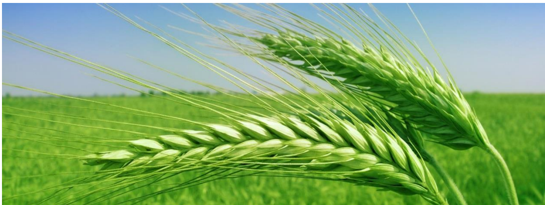
Slika 1. Pšenica lat. Triticum aestivum L.

Cvjetovi su skupljeni u cvat - klas. Klas se sastoji od klasnog vretena, koje je člankovito, a predstavlja produžetak vršnog članka stabljike. Na njemu se nalaze usjeci, pa ono ima koljenast izgled. Na usjecima se nalaze klasići naizmjenično s obje strane. Razmak među usjecima može biti manji ili veći, pa se razlikuju zbijeni i rastresiti klasovi. Klasić se sastoji od vretenca, dvije pljeve i cvjetova. U jednom klasiću može biti između 2 i 7 cvjetova. Cvijet se sastoji od dvije pljevice, dvije pljevičice, prašnika i tučka. Oplodnja je autogamna, što znači da polen pojedinog cvijeta dopijeva na njušku tučka istog cvijeta.