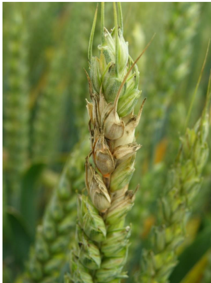
Slika 5. Fuzarijska palež klasa

zeae (Schw.) Petch.) kopulacijom anteridija i askogona tvori tamno plave do crne peritecije. Razvoj spolnog stadija se događa na samom kraju vegetacije domaćina na kojem F. graminearum parazitira. U periteciju se nalazi najčešće 8 askospora koje su trostanične. Pomoću spolnog stadija gljiva se prilagođava i daje nove patotipove koji su rezistentniji i agresivniji. Izvor zaraze su periteciji ili micelij na ostacima biljaka iz prošlih vegetacija. Uzročnik može preživjeti 2 do 3 godine i biti sposoban izvršiti ponovnu zarazu. Makrokonidije klijaju u širokom temperaturnom rasponu između 16 i 36 °C. Optimalne temperature su između 28 i 30 °C. Temperature koje odgovaraju razvoju askospora su oko 29 °C. Izvor inokuluma mogu biti zaraženo tlo, zaraženo sjeme ili alternativni domaćini. Sjeme pšenice, ali i drugih žitarica, zaraženo gljivicama iz roda Fusarium može sadržavati sekundarne metabolite (mitotoksine) koje gljivica sintetizira u nepovoljnim uvjetima. Mikotoksini, deoksinivalenon (DON), zearalenon (ZEA) i moniliformin (MON) posebno su opasni za zdravlje ljudi i životinja jer suprimiraju imunološki sustav, izazivaju mučninu i povraćanje te smanjuju apetit uzrokujući kod životinja odbijanje hrane (Ćosić 2001.).