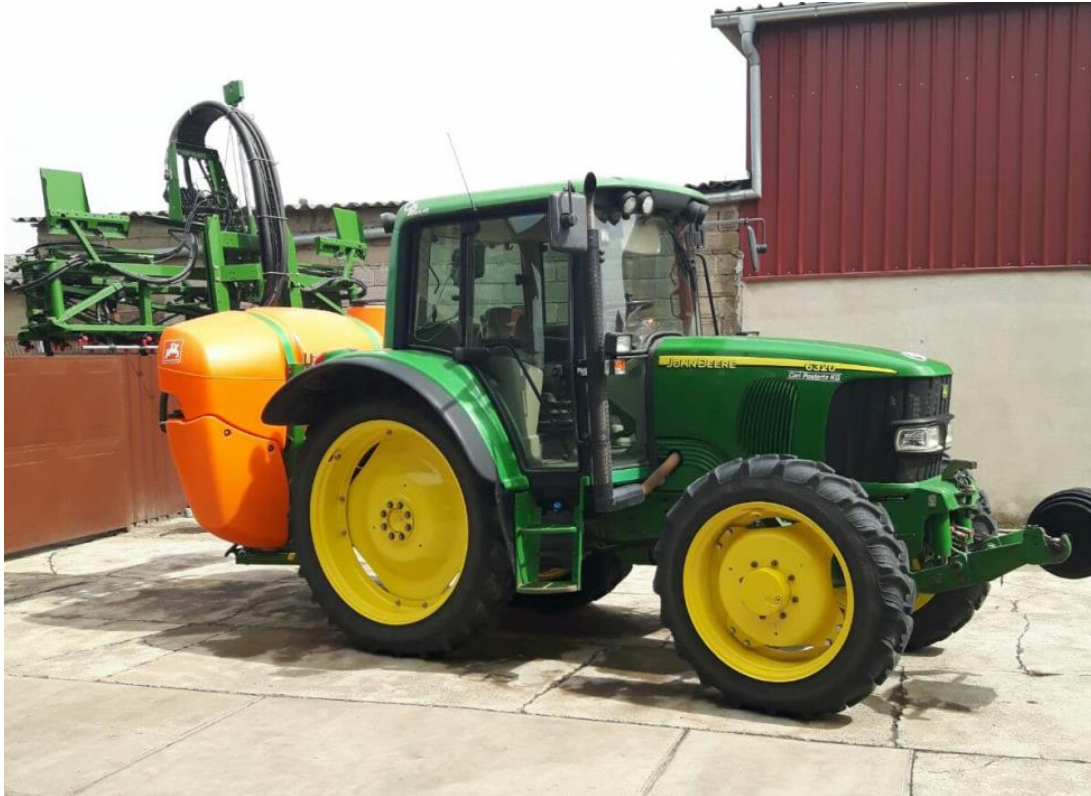
Slika 9. Prskalica Amazone UF 901