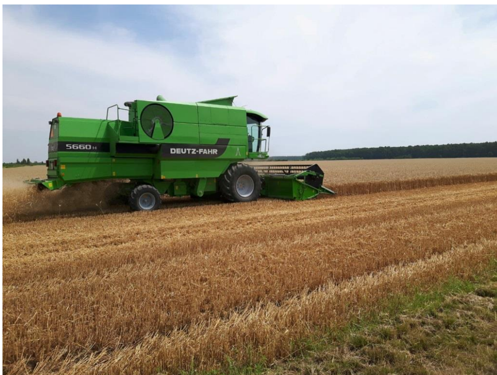
Slika 14. Ževa pšenice kombajnom Deutz-Fahr 5660H