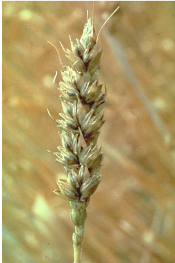
Slika 6. Tvrda ili smrdljiva snijet lat. Tilletia tritici