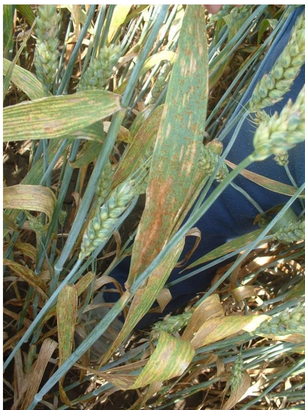
Slika 3. Smeđa hrđa lat. Puccinia recondita

Smeđa hrđa najčešća je hrđa pšenice u području s umjereno kontinentalnom klimom jer podnosi niže temperature od crne hrđe, a znatno više od žute hrđe. Javlja se na lišću, rjeđe rukavcu lista, a rijetko na vlasi, pljevama i osju. Glavni domaćin je pšenica, a zaražava i ječam, raž, zob i korove iz porodice Poaceae. Smanjuje prinose 5 - 10%. Uredosorusi su veličine 1-2 mm, imaju oblik leće i hrđaste su boje dok su teleutosorusi sjajno crne boje trajno prekriveni epidermom. Teleutospore zaražavaju prijelaznog domaćina. Temperaturni raspon unutar kojega može doći do infekcije je 2 do 32°C, a kada se infekcija ostvari dužina inkubacije ovisi o temperaturama.