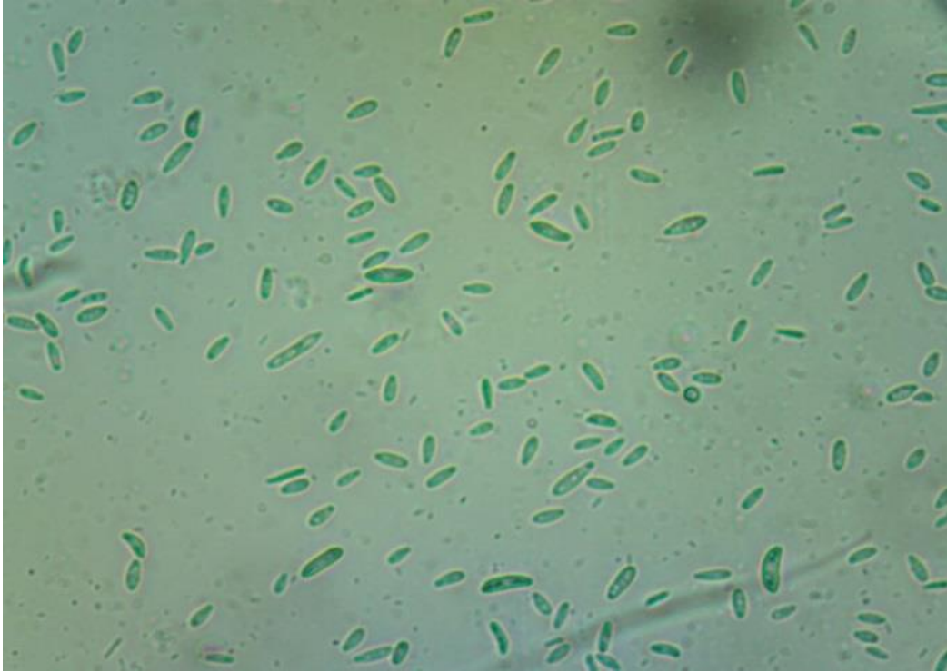
Slika 11. Fusarium sp.