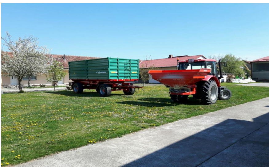
Slika 8. Rasipač gnojiva Rauch MDS

Na pokusnim tablama predsetveno je dodano NPK 0:20:30 435 kg/ha. Sjetva je obavljena sijačicom Amazone D9 3000 Super (Slika 7.) na međuredni razmak od 12,5 cm, datum sjetve bio je između 25.10 i 20.11. (Tablica 1.). Prihrane su obavljene rasipačem Rauch MDS (Slika 8.), radnog zahvata 15 metara. Prva prihrana obavljena je 22.2.2017. i dodano je dušično gnojivo UREA u iznosu od 120 kg/ha, dok je druga prihrana obavljena 3.4. 2017. i dodan je KAN u iznosu od 210 kg/ha. Zaštita se provodila prskalicom Amazone UF 901 radnog zahvata 15 metara (Slika 9.), a provodila se u dva navrata 2.5. (zaštita lista) i 15. do 18.5 2017. (zaštita klasa).