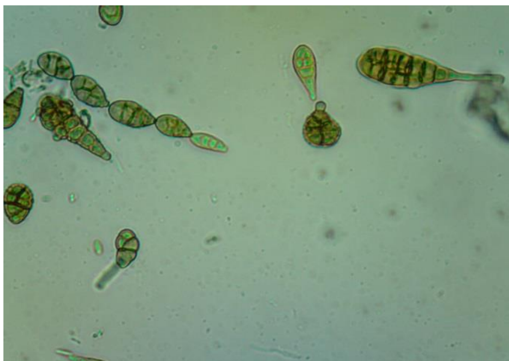
Slika 10. Alternaria sp.

Istraživanja su provedena u proizvodnoj godini 2016./2017. na poljoprivrednom obrtu Miljević na dvije sorte pšenice (Maja - 30 ha; Ingenio - 35 ha). Zdravstveni pregledi usjeva obavljani su jednom tjedno od kraja veljače do kraja vegetacije. Na obje sorte pšenice uočena je vrlo slaba pojava lisnih bolesti i to pjegavosti lista ( S. tritici ) i pepelnice ( B. graminis ). Pregledom usjeva u mliječnoj zriobi simptomi fuzarijske paleži klasa nisu utvrđeni. Zaštita pšenice je provedena preventivno fungicidom Opus team (Tablica 2.) (epoksikonazol 84 g/l + fenpropimorf 250 g/l, doza 1l/ha) krajem vlatanja i fungicidom Zamir (Tablica 3.) (267 g/L + tebukonazol 133 g/L, doza 1,2 l/ha) u cvatnji pšenice. Nakon žetve utvrđeno je zdravstveno stanje zrna (4x100 zrna za svaku sortu) metodom izmrzavanja te je utvrđena dominantna prisutnost Alternaria sp. (Slika 10.). Također je utvrđena i sporadična pojava Fusarium (Slika 11.) vrsta te slaba do srednje jaka pojava saprofitnih vrsta iz rodova Penicillium i Aspergillus (Slika 12. i 13.).