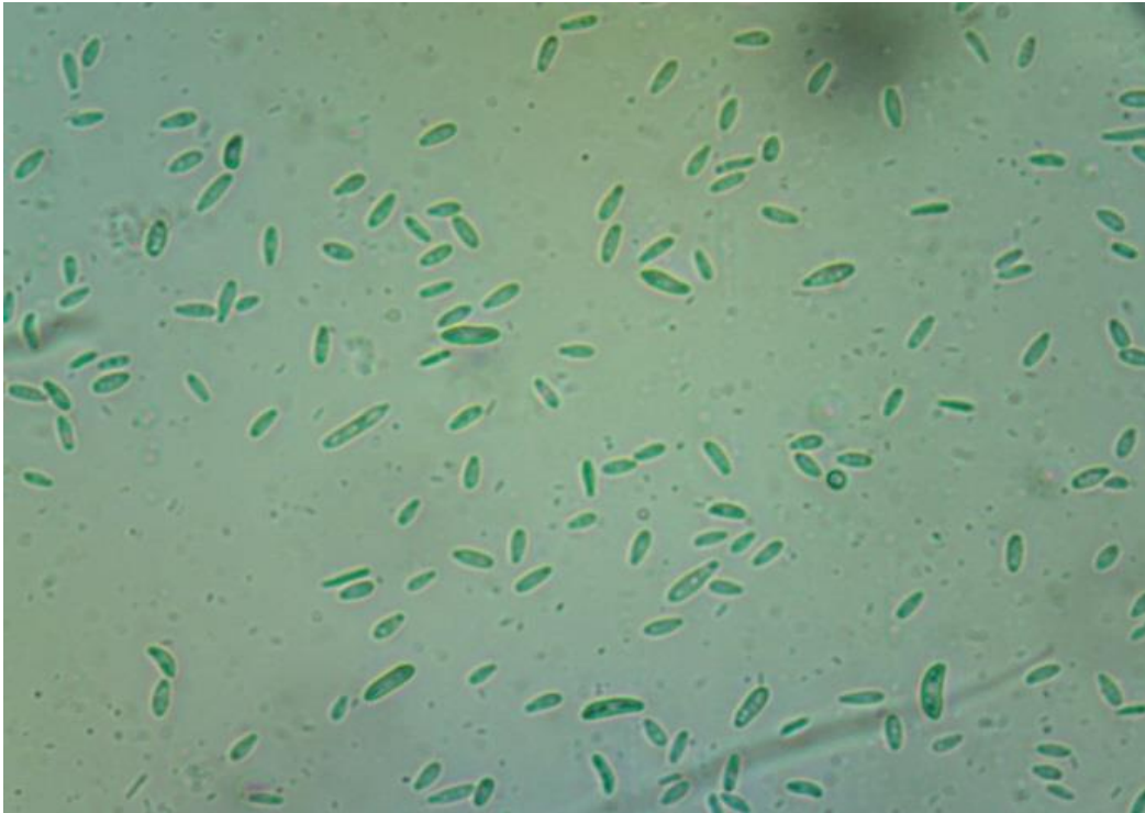
Slika 11. Fusarium sp.