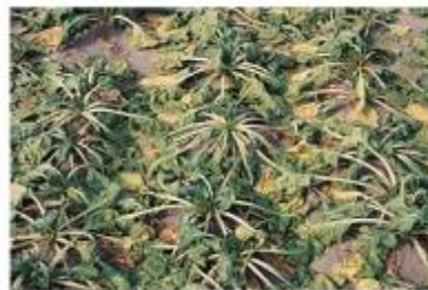
Slika 3. Izgled sjetve repe u suši

Za klijanje je potrebno više od 200% vode od težine sjemena zbog debljine pilete (120-170% od golog sjemena). Da bi proizvodnja bila uspješna, dovoljno je 600 mm ukupnih godišnjih oborina, a tijekom vegetacije je potrebno oko 350 mm. Potrebe za vodom ovise o toplini.