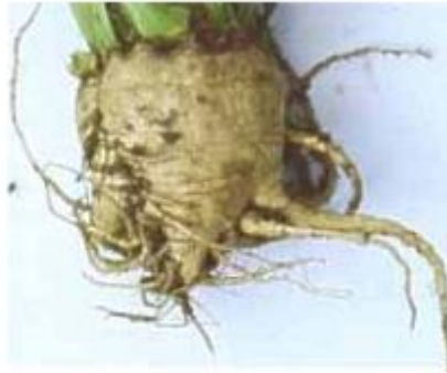
Slika 2. Razvoj korijena repe u vlažnom tlu

Izvor: http://repa.hr/wp-content/uploads/2014/03/PrirucnikRepa.pdf