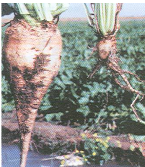
Slika 4. Korijen zaražen repinom nematodom ( Heterodera sch. )

Šećerna repa jedna je od najzahtjevnijih kultura pa njezinom uzgoju treba posvetiti izuzetnu pozornost tijekom cijele vegetacije. Pod mjerama njege šećerne repe podrazumijevaju se one mjere koje se poduzimaju nakon nicanja biljke, a to su: drljanje i valjanje, međuredna kultivacija, suzbijanje korova, suzbijanje štetnika i suzbijanje bolesti. (Jurišić, 2015.).