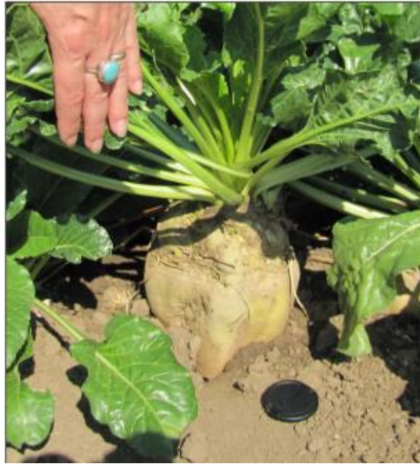
Slika 7. : Kvalitetna obrada tla – kvalitetan razvoj korijena