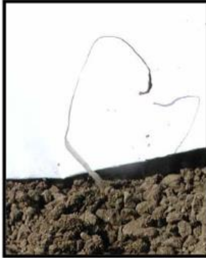
Slika 1. Izumrli ponik šećerne. repe