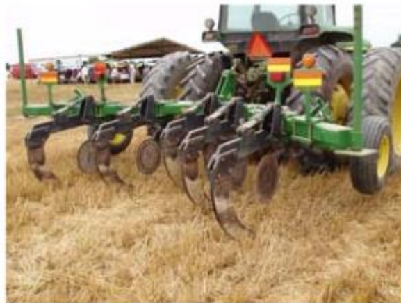
Slika 6. Podrivač