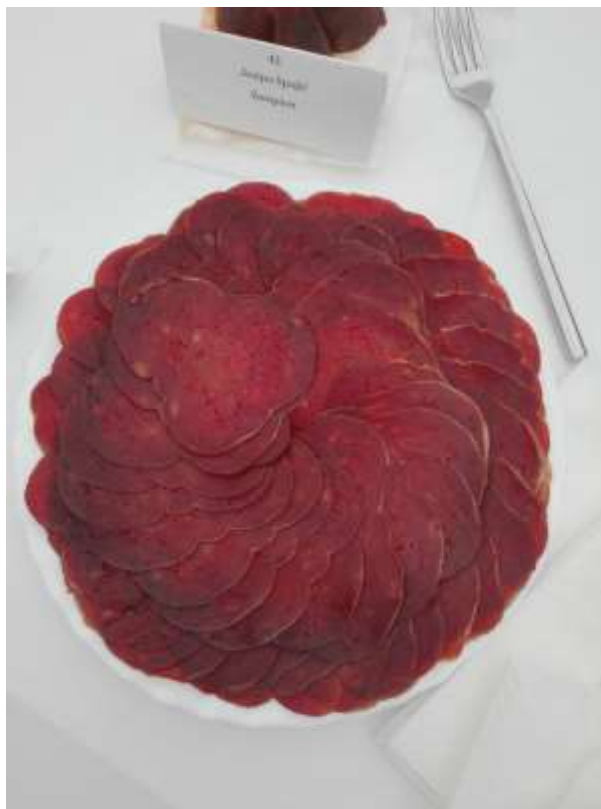
Slika1. - Slavonski kulen

Smatra se da se kulen proizvodi od početka 18. stoljeća da bi se meso od klanja sačuvalo za kasniju potrošnju. Proizvodnja kulena je danas značajan izvor prihoda za poljoprivredna gospodarstva. Mnoga istraživanja pokazuju da je potražnja na domaćem tržištu veća od ponude na istom. Jedan od rijetkih mesnih prerađevina s kojim svinjogojska poljoprivredna gospodarstva mogu biti konkurentna je upravo kulen. Neizostavan je dio slavonske tradicijske baštine te se posluživao samo u rijetkim i jako bitnim prilikama jer se prije klao mali broj svinja po kućanstvu pa se zbog toga čuvao za posebne prigode. Danas kada imamo sve veću kupovnu moć i proizvodnju kulen se sve češće servira gostima, klijentima, poslovnim partnerima itd. pa čak i poklanja.