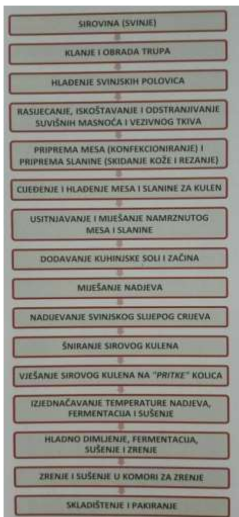
Slika 2. - Tehnološka shema proizvodnje kulena

Proizvodnja kulena se obavlja prema tehnološkoj shemi koja je prikazana na slici 2. Sama proizvodnja se sastoji od mnogo tehnoloških operacija, počevši od odabira sirovine (svinje) i klanja, obrade trupa, šniranja i vješanja gotovog sirovog kulena.