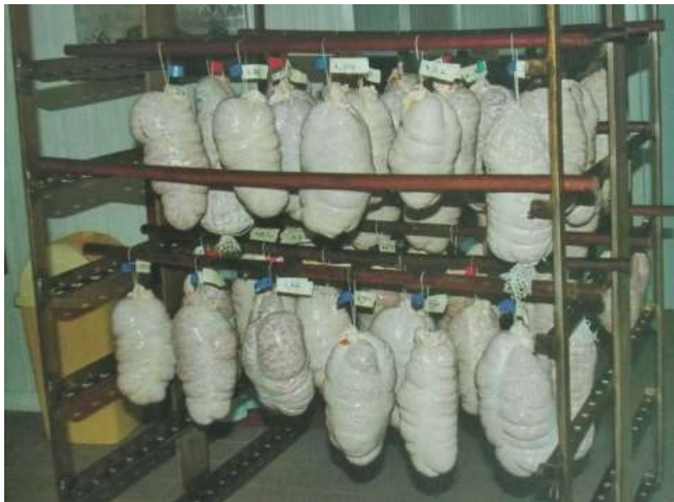
Slika 3. - Vješanje sirovog kulena na „pritke“ kolica

Sljedeći korak u proizvodnom procesu jest vješanje sirovog kulena na „pritke“ kolica ili „pritke“ fiksirane u pušnicama seoskih domaćinstava. U domaćinstvima se sirovi kuleni vješaju na „pritke“ fiksirane u prostoriji za zrenje ili pušnici. (Kovačević, 2014.)