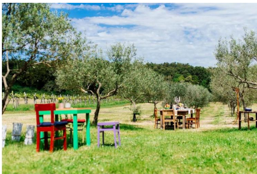
Slika 3. – Domaćinstvo u Istri

Takav oblik turizma naviše je raširen u Istarskoj i Dubrovačko-neretvanskoj županiji. Istarska županija je u suradnji sa Turističkom zajednicom Istarske županije dala izravni poticaj za razvoj turizma na seoskim domaćinstvima u unutrašnjosti Istre već 1996. godine. Stoga ne čude činjenice da je Istra danas najjača turistička regija uz razvijeni priobalni turizam i jaku ruralnu ponudu.