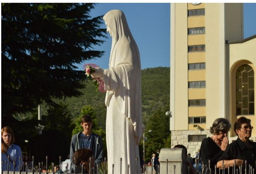
Slika 1. - Vjerski turizam; hodočašće u Međugorju