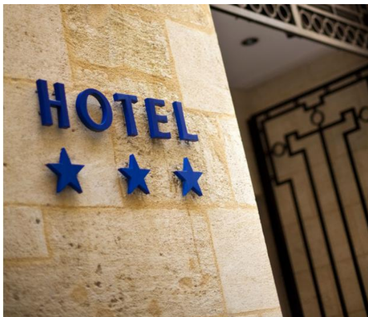
Slika 4. – Kategorizacija objekata