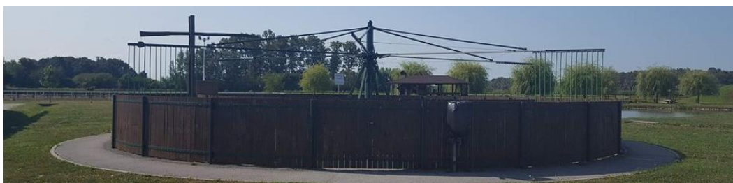
Slika 8. Šetalica za trening konja (Perković, 2017.)

Konji na ranču „Marin“ nakon napornog treninga mogu se opustiti u šetalici. Šetalica je mehanička sprava koja konja vodi u krug te mu omogućava da se stalno kreće. Na taj se način konji mogu ohladiti nakon treninga te mu se mišići postupno hlade i opuštaju. Šetalica također služi kao lagani trening zimi, kada se konji odmaraju za nadolazeću sezonu. Konji u šetalici treniraju svaki dan, 20 minuta. Tako im se održava kondicija te ih se lagano uvodi u pripreme koje su kasnije sve intenzivnije (Slika 8.) (Podaci trenera konjičkog kluba „Ramarin“).