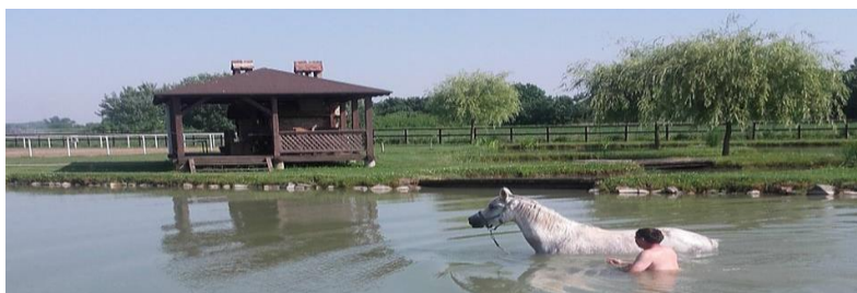
Slika 7. Trening konja u vodi (Perković, 2017.)

vodi tijelo lakše, teže se kreće. Nakon toga se na dubini manjoj od 1 m obavlja trening od 5 minuta kasom zbog jačanja mišića i tetiva nogu konja (Mišanec, 2012.).