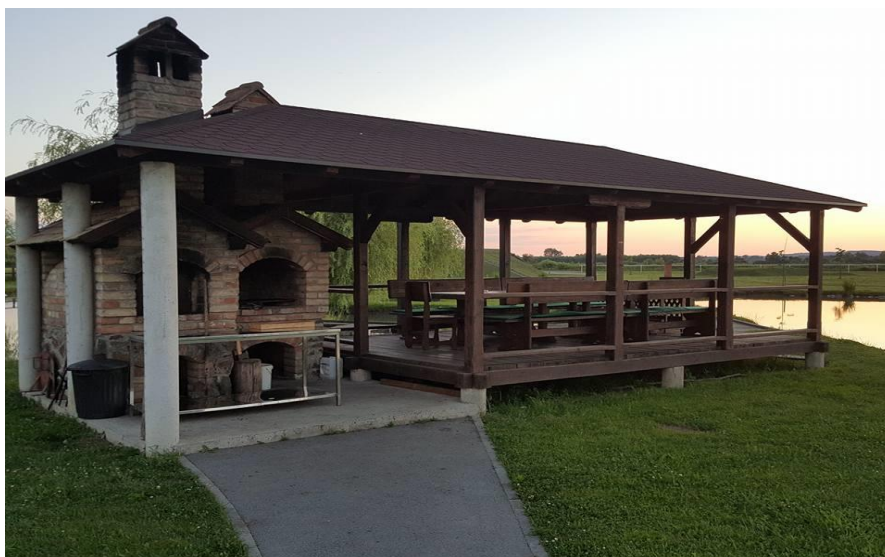
Slika 12. Sjenica s roštiljem i krušnom peći

Ako je pak riječ o većem slavlju, na raspolaganju je „klet“ kapaciteta za 80 ljudi, pogodna za proslave kao što su zaruke, krštenje, rođendani, itd. (Slika 13.).